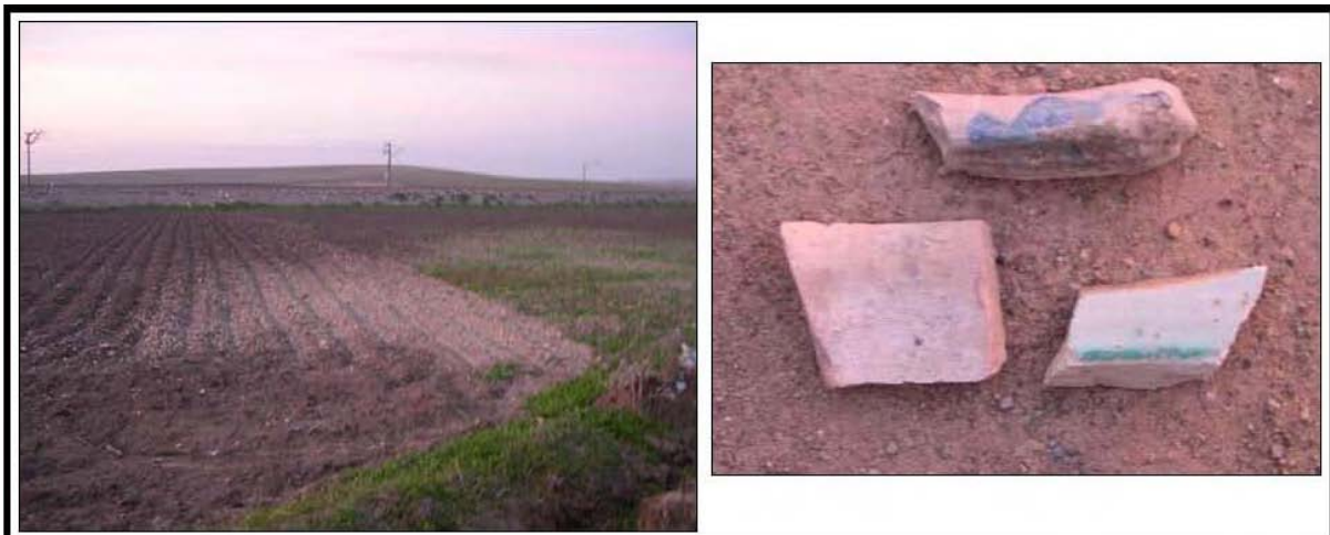
1. OESTE DE LA CASA DEL POZO VIEJO.

RIESGOS: Se localiza a 80 metros del eje de la traza.