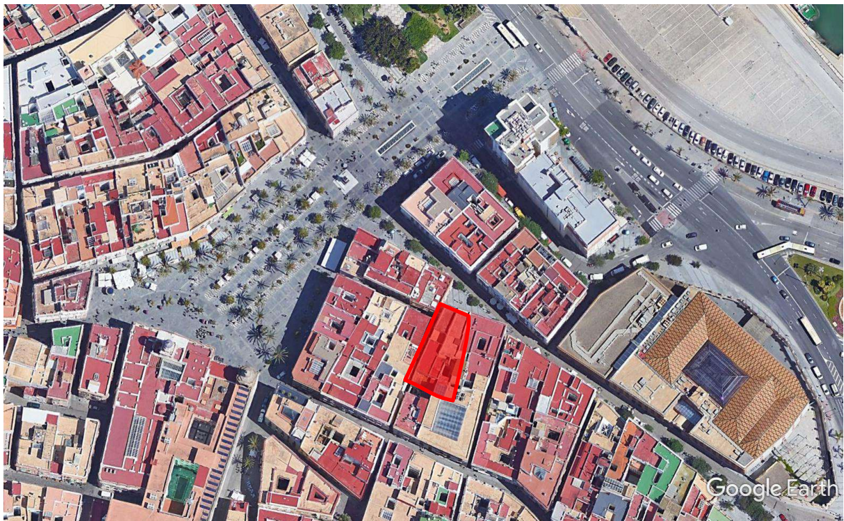
Lám II. Detalle de la finca en el entorno.