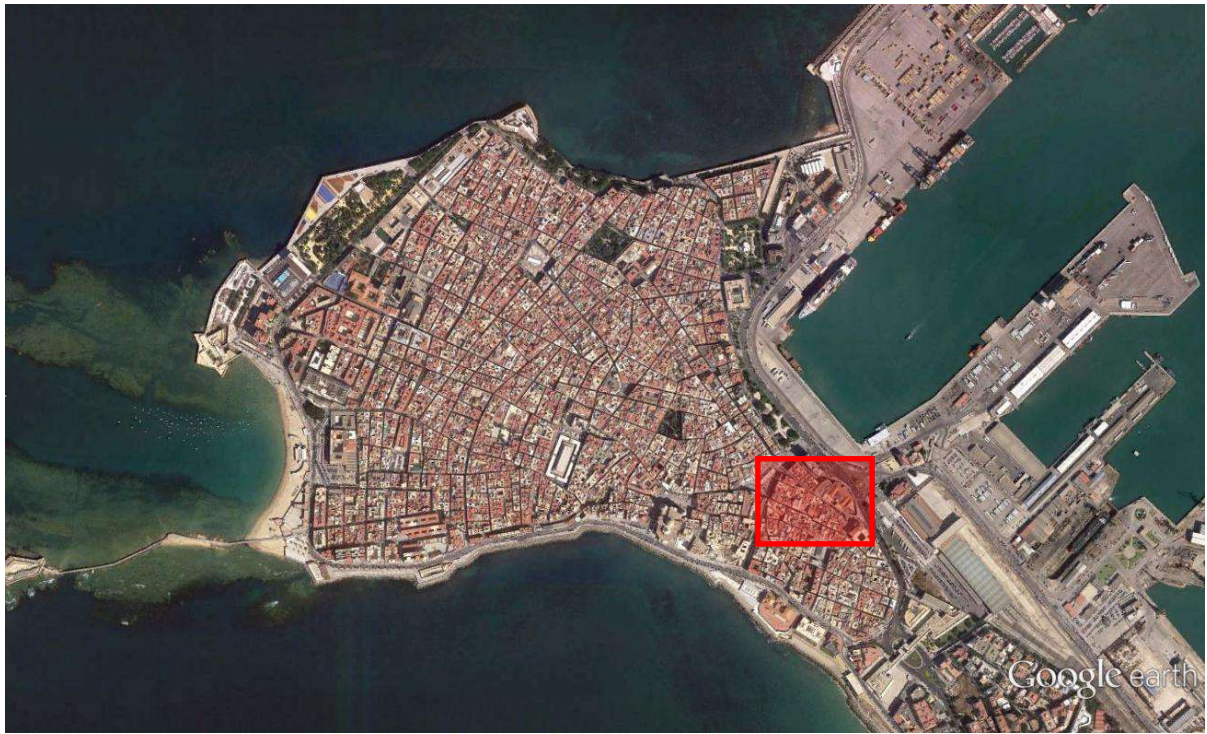
Lám I. Ubicación en la ciudad de Cádiz.