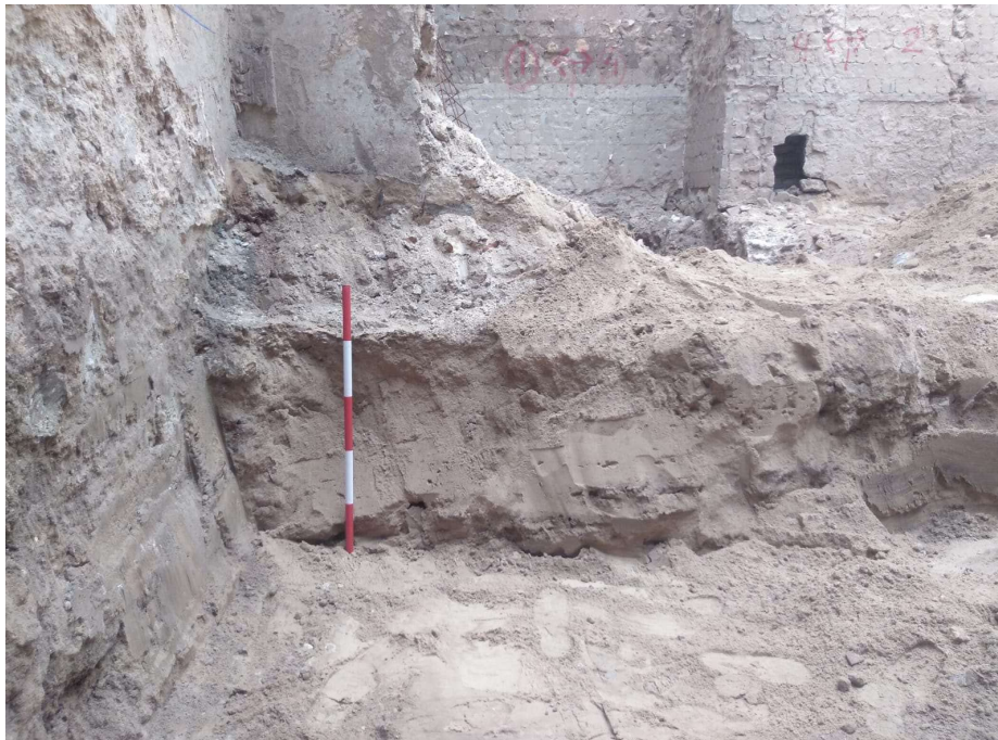
Lám. IV. Perfil general de excavación para losa de cimentación.