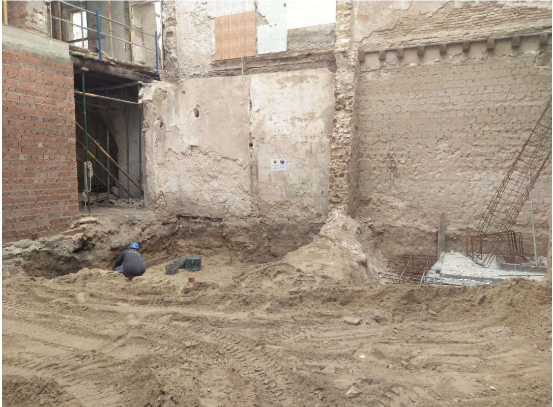
Lám. III. Vista general del extremo suroeste de la finca donde se ubica la cimentación de losa de hormigón.