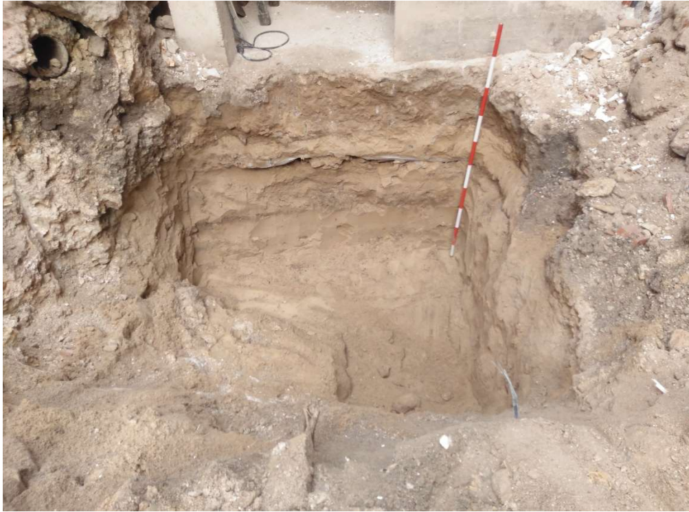
Lám. VI. Perfil de foso de ascensor.