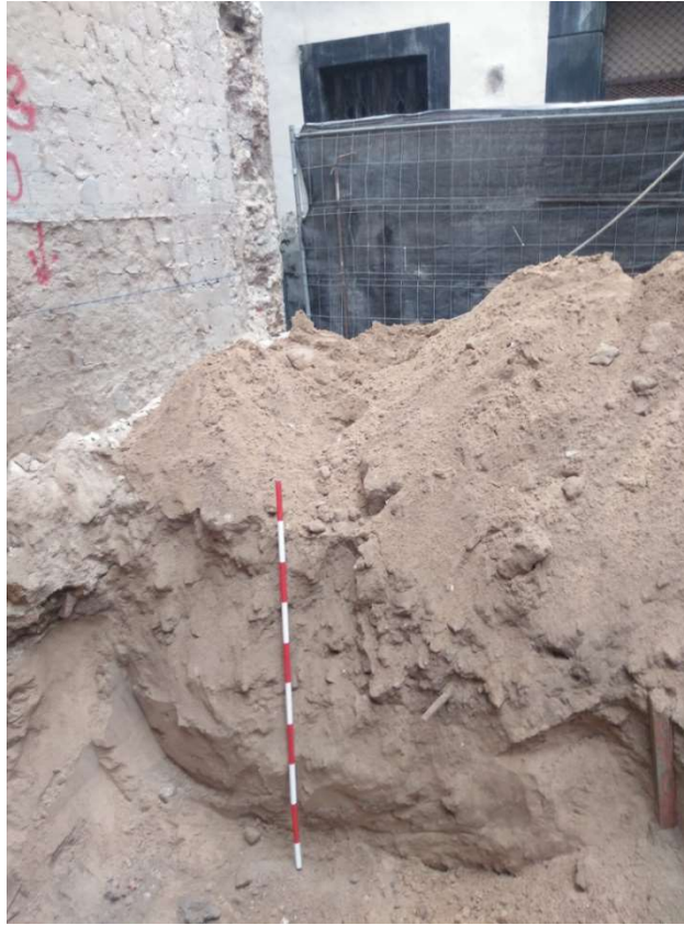
Lám. V. Perfil de batache en esquina suroeste.

En la excavación para esta losa de cimentación se documenta un primer estrato compuesto por restos de pavimentación contemporánea y escombros (UE1) de unos 0,20 m. de potencia y bajo éste un estrato de arena de duna (UE2) hasta la cota final, donde se localizan algunos restos óseos de fauna algunos fragmentos de cerámicas modernas (bordes de botijas, escudilla de loza blanca,...) junto a otro de apariencia almohade (galbo de posible ataífor con línea de almagra bajo melado, galbo de jarra restos de decoración pintada en rojo).