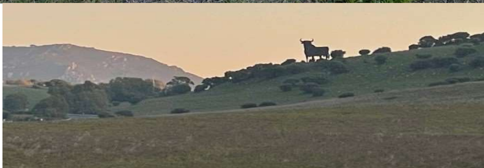
Fotos 3 y 4: Ladera situada al este de la subestación eléctrica (arriba) y toro de Osborne (abajo)

El bien cultural conocido más cercano es un Toro de Osborne (foto 4), situado sobre un promontorio a la altura del p.k 67 de la N-430, alejado de las parcelas sometidas a evaluación (foto 4); aproximadamente a 3 kilómetros de las mismas. En definitiva, en ningún momento fueron apreciados materiales, estructuras ni estratos arqueológicos o de relevancia cultural.