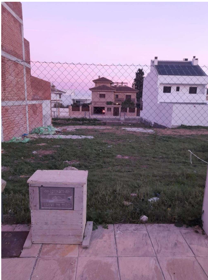
Lámina 2. Estado previo de la parcela.