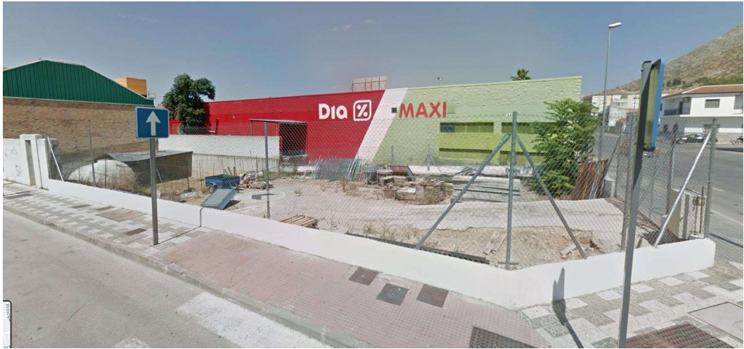
Lámina 1. Estado previo de la parcela.

Las distancias entre los vértices del solares son: