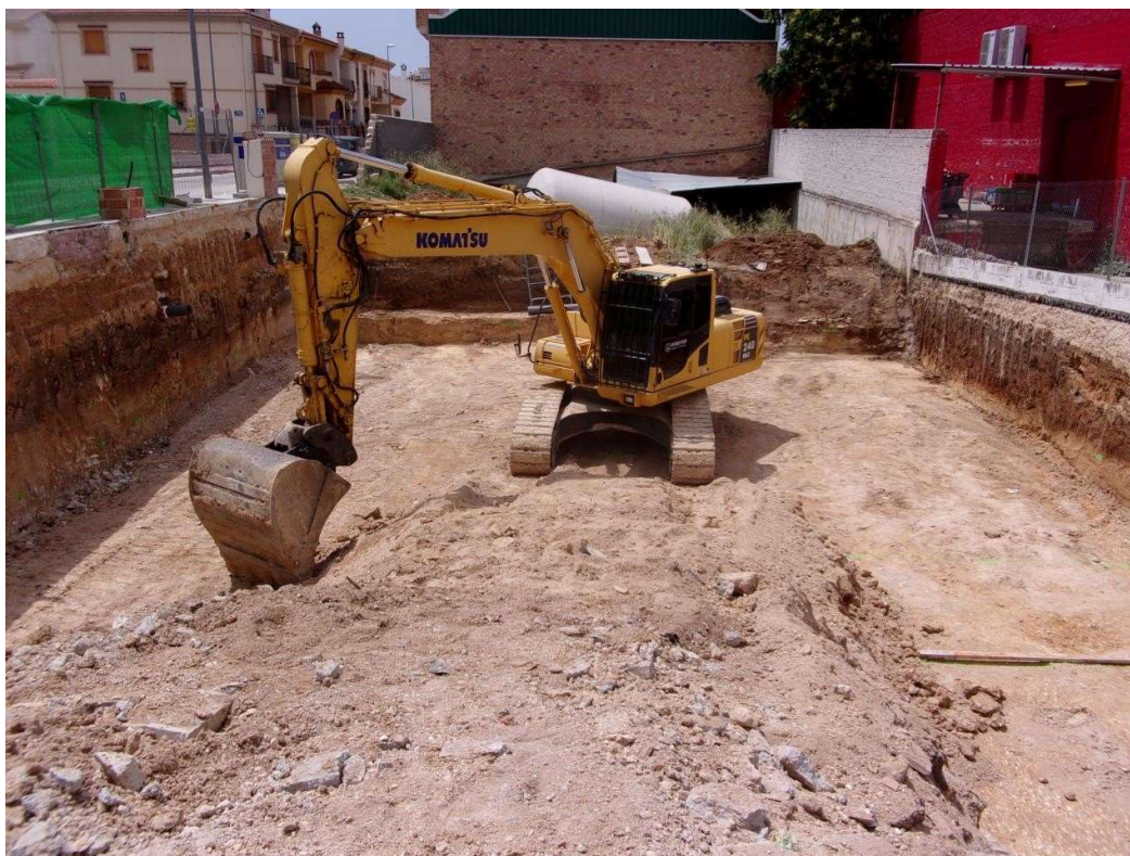
Lámina 4. Planta final.