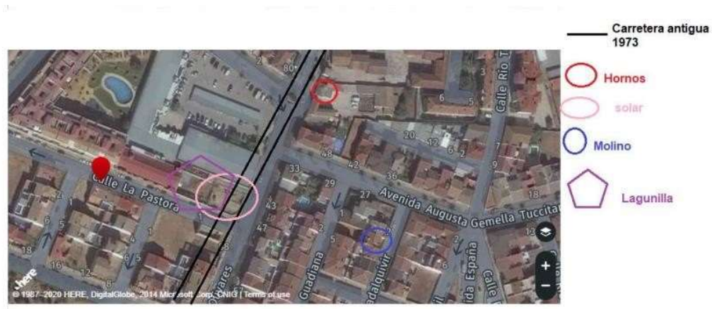
Lámina 3. Entorno parcela.

Se corresponde con el momento de parcelación y urbanización de esta zona, como suelo urbano. Esta etapa está representada en la intervención por los niveles de asfalto y diferentes zahorras de apoyo. Y por otro lado, en relación con el momento de construcción de edificaciones próximas. Todo ello como hemos apuntado por la transformación de auge de la empresa, y la necesidad de nuevos espacios de hábitat.