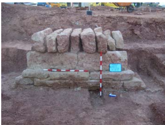
Lámina VII. Cara occidental del tramo de canal islámico