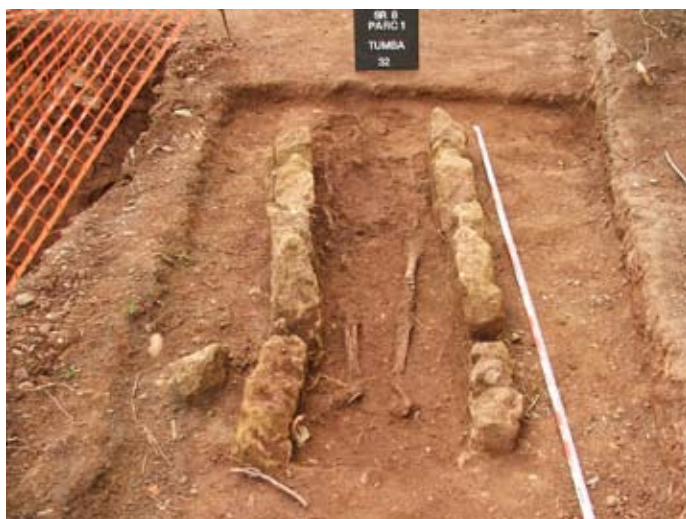
Lámina V. Tumba 32. Parcela 1