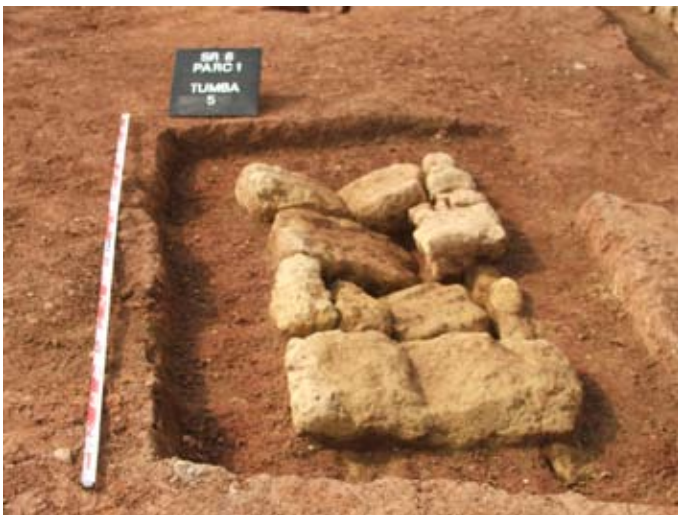
Lámina I. Tumba 5. Parcela 1

En la Edad Moderna se realiza una nueva conducción hidráulica que llevaría agua de algún manantial cercano a alguna zona de la ciudad. Finalmente, este lugar pasó a ser zona industrial (Polígono Industrial de Chinales) de la actual ciudad de Córdoba.