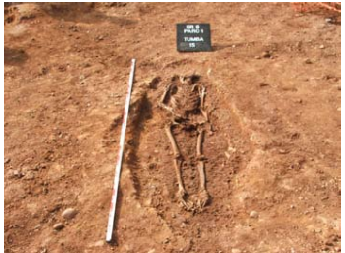
Lámina II. Tumba 15. Parcela 1