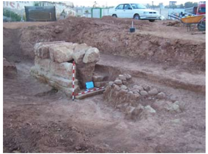
Lámina X. Vista general de la canalización islámica