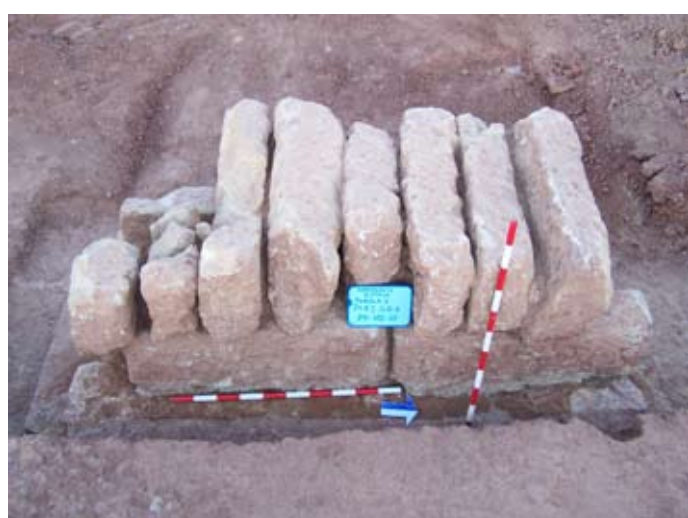
Lámina VIII. Cubierta de la canalización