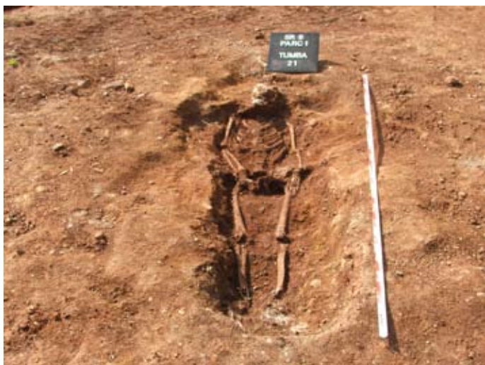
Lámina III. Tumba 21. Parcela 1