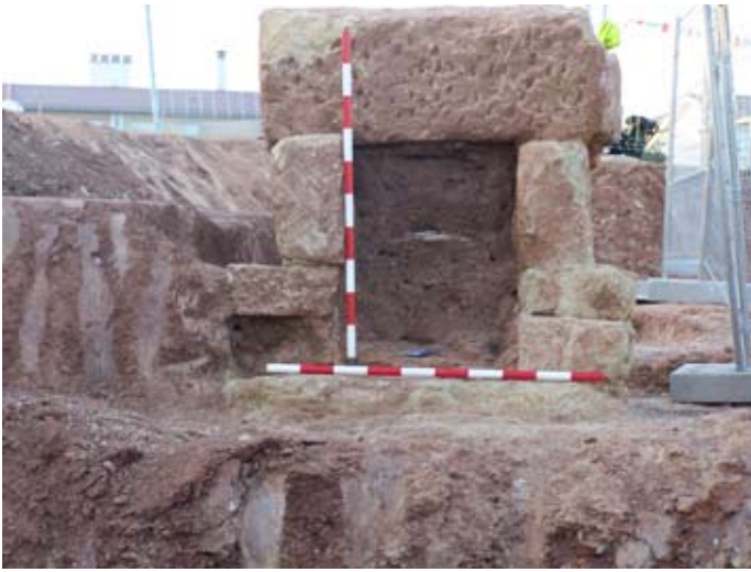
Lámina IX. Vista de la colmatación interior