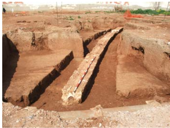
Lámina VI. Canalización Edad Moderna. Parcela 2