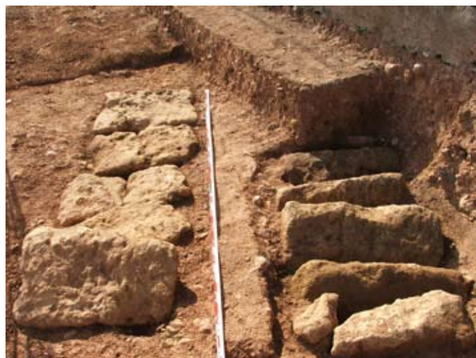
Lámina IV. Tumbas 35 y 36. Parcela 1