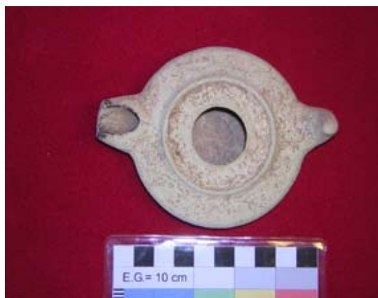
Lámina I. Candil de cazoleta extraído de la U.E 190.

Otras estructuras pertenecientes a esta fase, serían dos niveles de pavimentos de gravas, U.E 277 (94.70 m.s.n.m), en la esquina noreste del solar, y U.E 189 (94.72 m.s.n.m), emplazado en el espacio 5 de la fase inmediatamente posterior, y que se encontraba colmatado por un estrato de limas (U.E. 190) que aportan materiales cerámicos emirales (candil).