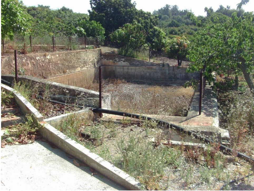
Fig. 11. Imagen de la alberca situada en la cortijada de Puerta del Hierro.