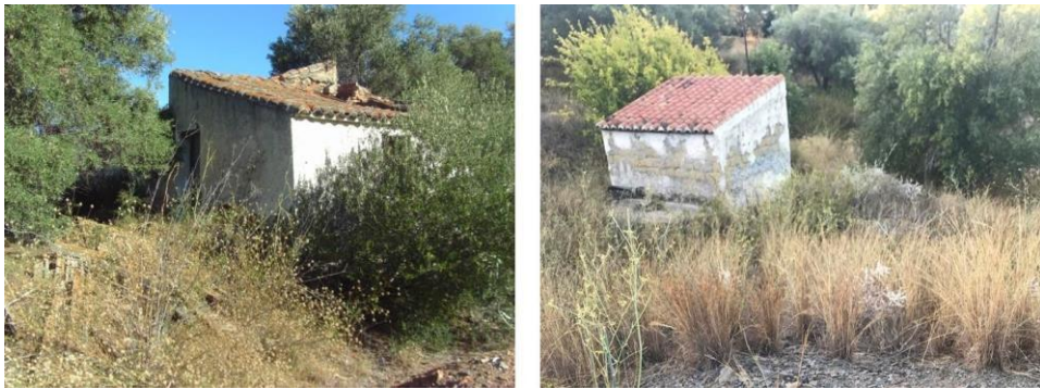
Fig. 12.- Imágenes de las construcciones, hoy en desuso, presentes en la parcela.