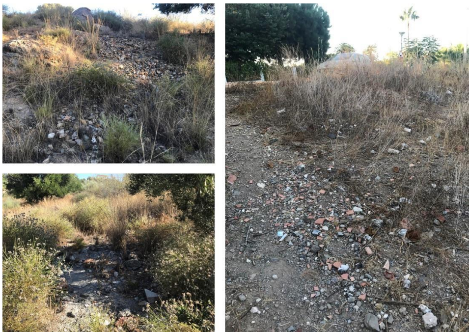
Fig. 9. Imágenes de restos de escombreras con material cerámico y constructivo de factura contemporánea localizados en el entorno de los caminos que atraviesan el área de actuación.