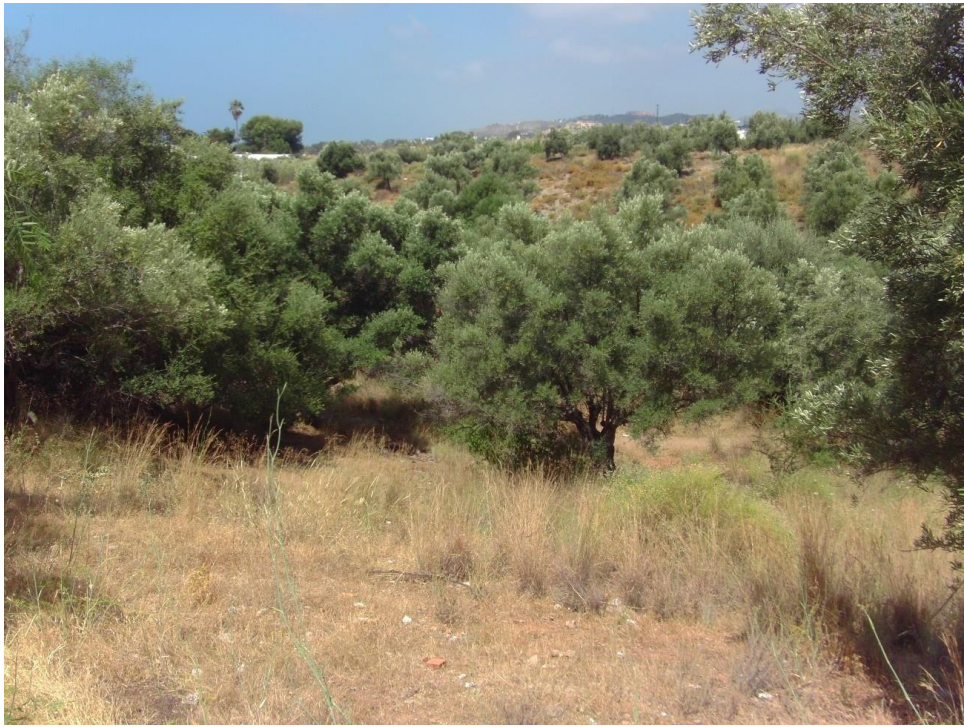
Fig. 7. Imagen general de la parcela intervenida.