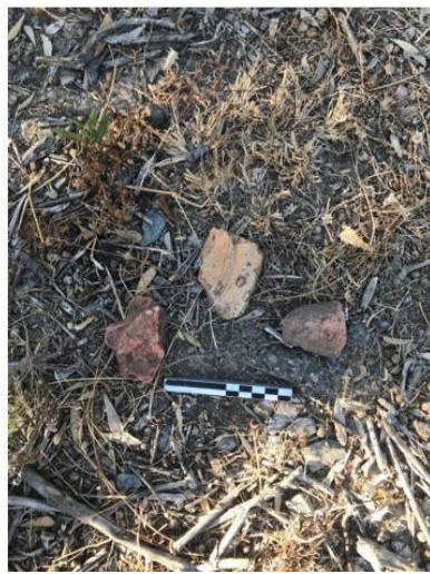
Fig. 8. Imágenes de material cerámico de factura contemporánea encontrado en el área de actuación.