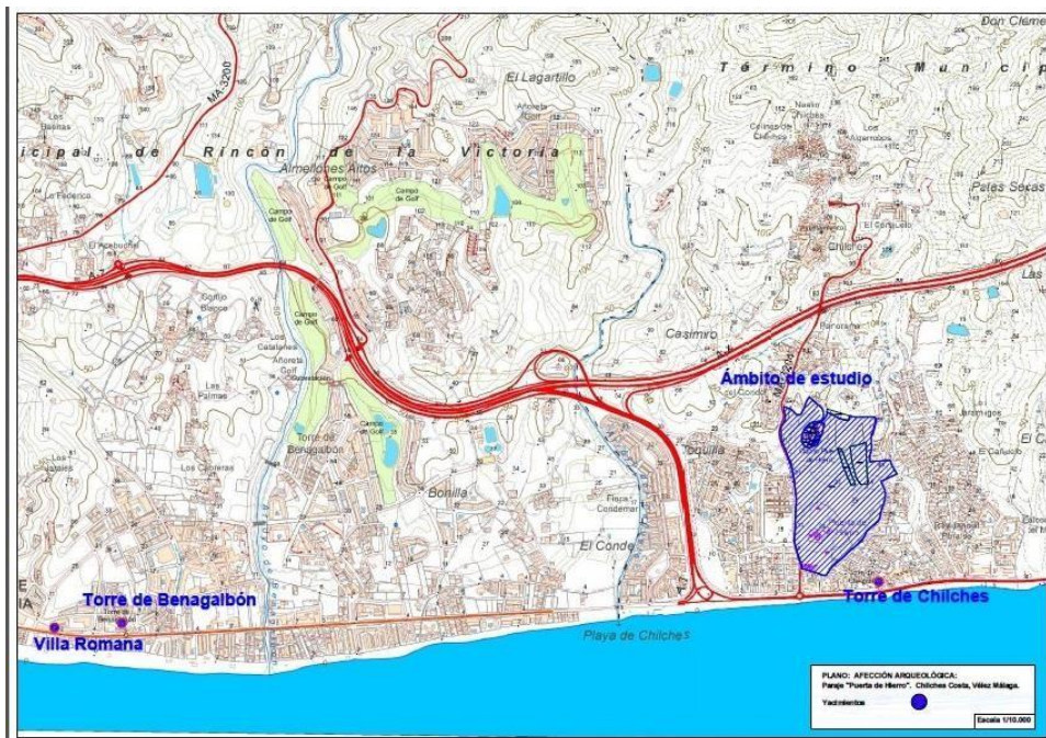
Fig. 4. Localización de los yacimientos arqueológicos en el entorno del área de actuación.