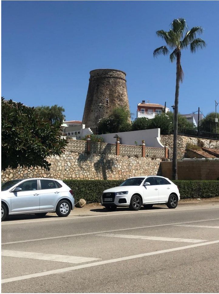
Fig. 5. Imagen de la torre de Chiches.