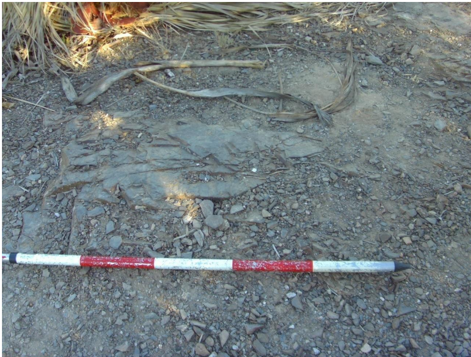
Figura 3. Afloramientos rocosos de filitas en el área objeto de estudio.