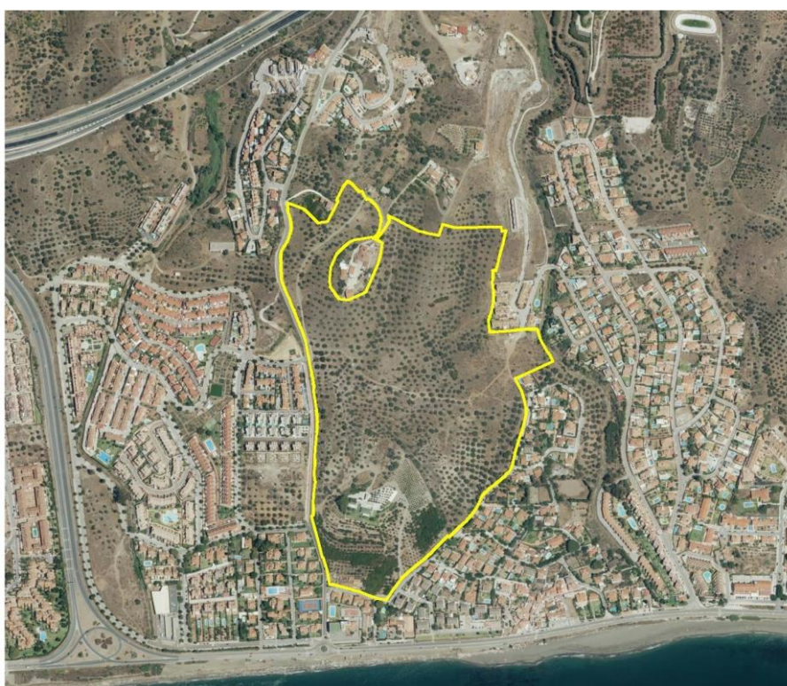
Figura 2. Imagen aérea del área intervenida y su entorno.