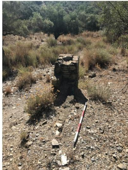
Fig. 10. Imágenes de los registros del sistema de riego de la parcela.