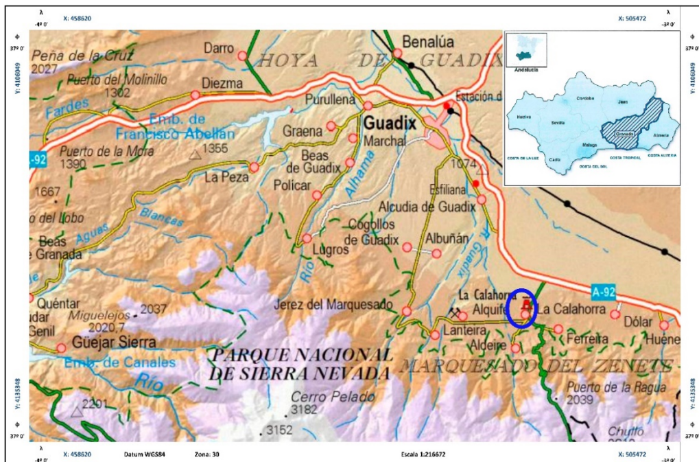
Figura. 1. Localización de la Calahorra (Granada). Elaboración propia a partir de planimetría del Visor Iberpix, Instituto Geográfico Nacional.

El presente trabajo muestra los resultados obtenidos en el desarrollo de la I. A. P. mediante control de movimiento de tierras realizado en varias calles de la localidad granadina de La Calahorra, y más concretamente, en las calles Los Caños, Macabe, San Sebastián y Plaza del Ayuntamiento.