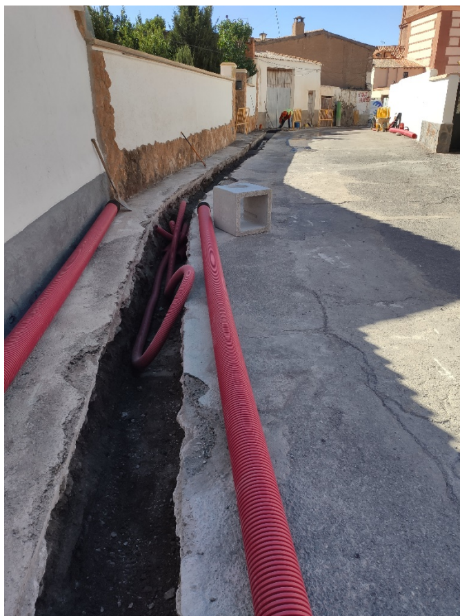
Lámina I. Proceso de apertura de zanjas para la infraestructura eléctrica.

El inicio de los trabajos arqueológicos tuvo lugar en la calle Macabe, habida cuenta de que era la que tenía mayores posibilidades, atendiendo a su topónimo, de localizar posibles restos arqueológicos, en este caso, de carácter funerario. Sin embargo, ni en esta calle, ni en el resto de las que fueron objeto de esta actuación arqueológica se hallaron evidencias arqueológicas de ningún tipo.