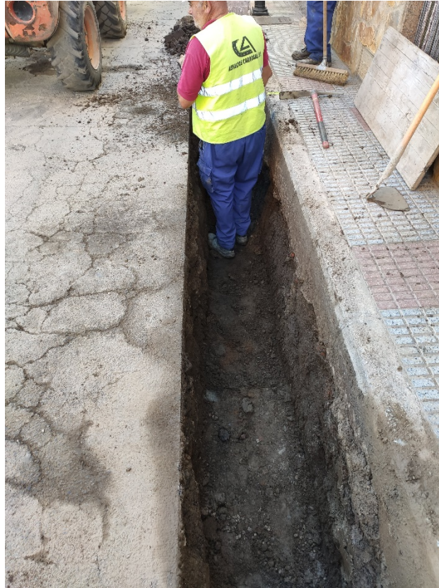
Lámina II. Proceso de apertura de zanjas para la infraestructura eléctrica.

Debemos destacar que, durante la apertura de las zanjas, se detectaron numerosas infraestructuras contemporáneas (bajantes, abastecimientos de agua, acometidas eléctricas, etc.) que afectaban la secuencia arqueológica, y que manifestaban que, de haber existido en estas zonas algún resto arqueológico pretérito, debería aparecer, al menos removido, en el nivel arcilloso anteriormente descrito. La absoluta inexistencia de cerámicas o fragmentos óseos de carácter arqueológico detectada indica que estos espacios, como mínimo a nivel de la cota de afección alcanzada, nunca han contado con dichos restos arqueológicos.