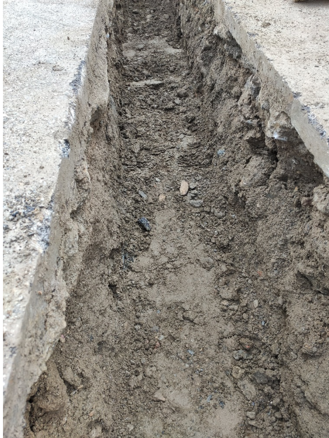
Lámina III. Detalle de la secuencia estratigráfica documentada.