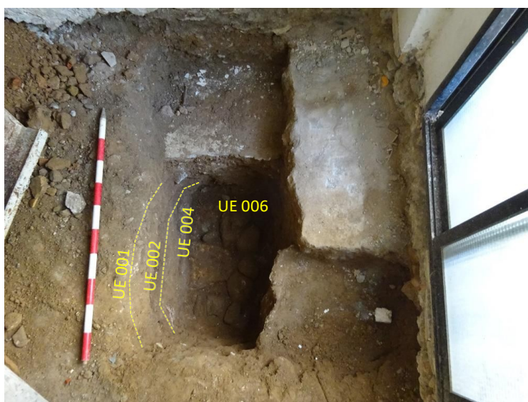
Zanja de P3.