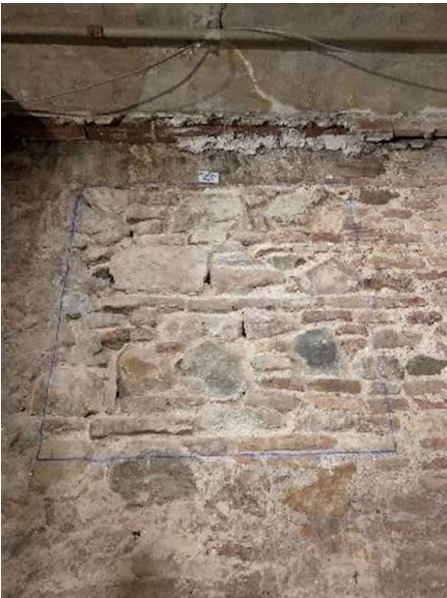
Lám.V: Muro transversal al muro donde la ubican las catas. Sureste