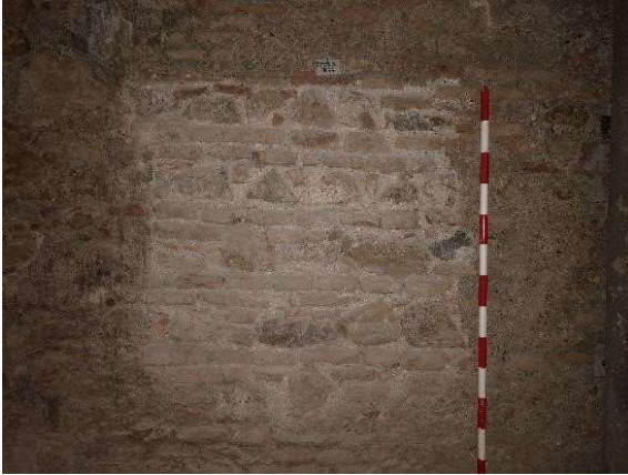
Lám. IV: Cata 8