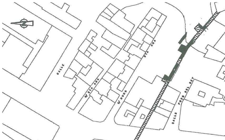
Lám.III: Cata 5