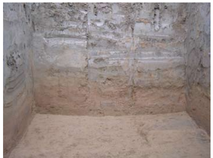
Lámina III. Estratos geológicos en sondeo 1.