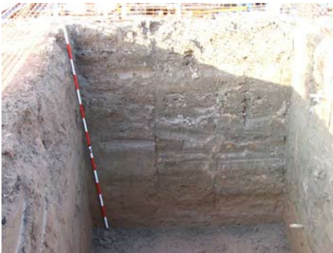
Lámina II. Sondeo 1. Perfil Sur