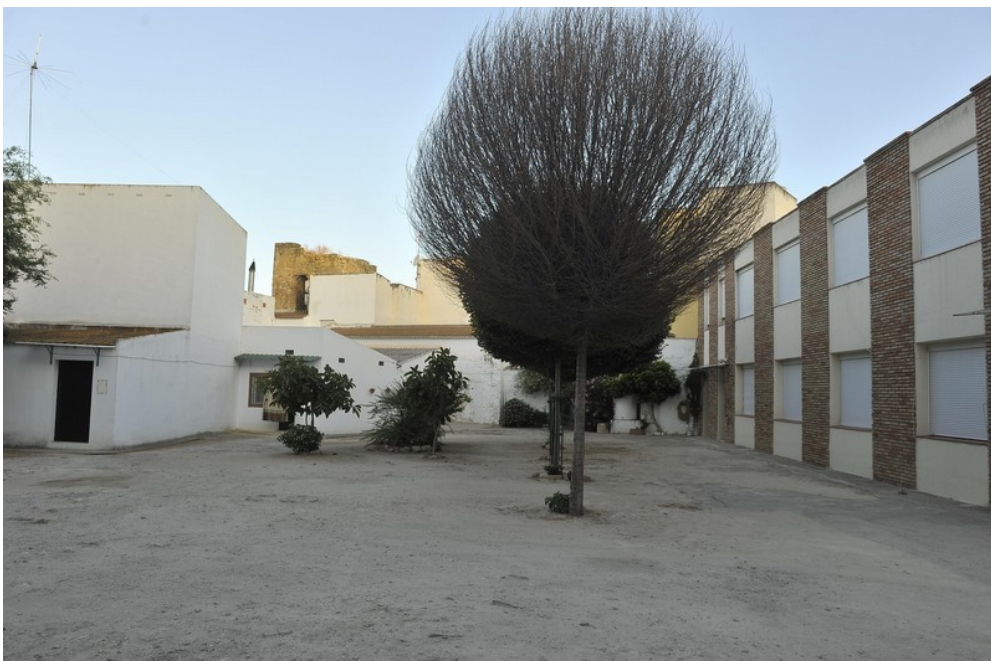
Fig. 2. Área de la Actividad Arqueológica, vista desde el este.