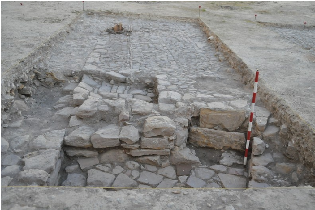
Fig. 5. Sondeo 3. Se observa el vano tapiado E-7, el pavimento de losetas y piedras E-13 que va asociado al muro E-10B y al muro E-15, y que a su vez está cortado por el muro E11. En la parte superior se observa el pavimento moderno E-9 bajo el pavimento E-3.