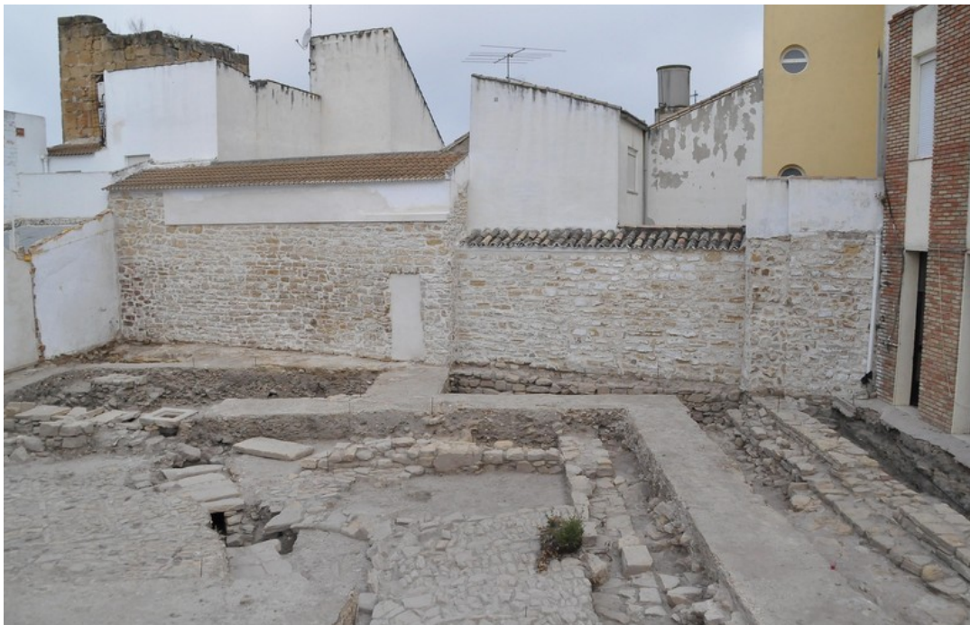
Fig. 4. Grupo Estructural 1. Muralla tras su restauración.