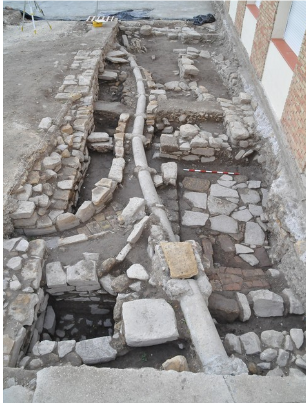
Fig. 7. Sondeo 5 y 6. Planta final una vez retirado el pavimento contemporáneo E-3.