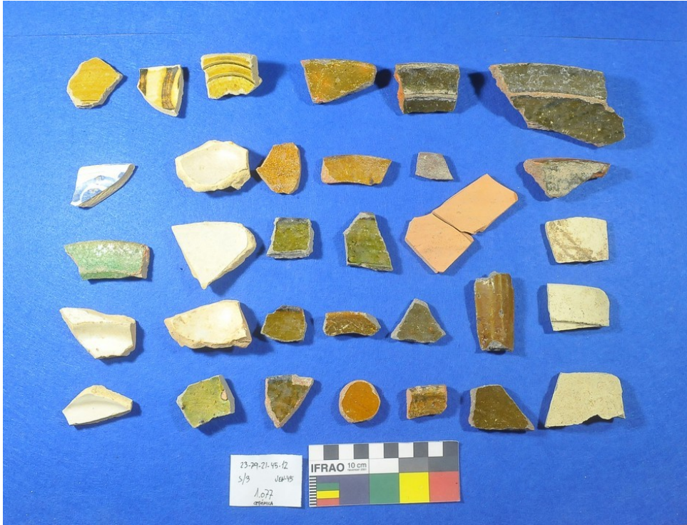
Fig. 13. Conjunto cerámico de finales de Época Moderna s. XVIII. Conjunto perteneciente a la UEN-45, estrato sobre el que se asienta el pavimento E-9.

Fuente: Fototeca ARQVIPO. Sign. 23-79-21-45-12-1077. Año. 2020.