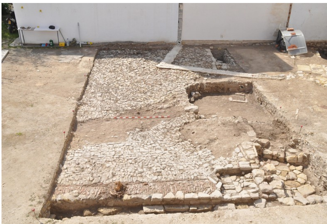
Fig. 10. Sondeo 4. Vista general del espacio empedrado E-3.