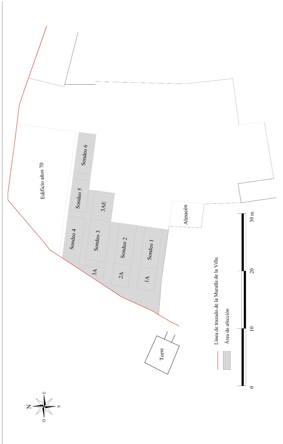
Fase I del Proyecto del Centro Parroquial.