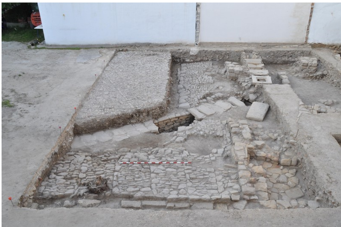
Fig. 11. Vista general del empedrado E-9 en el área de los sondeos 1, 2 y 3.