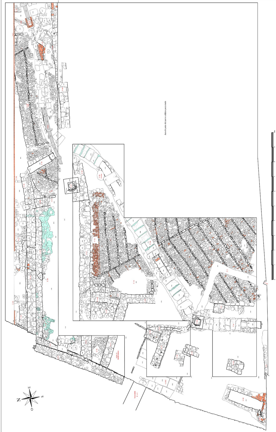
Lámina III. Planta I con estructuras de Fases Contemporáneas.