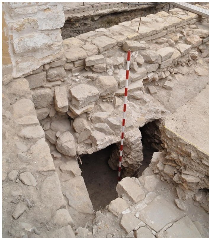
Fig. 8. Sondeo 4A. Vista de la cámara “bufa” de bóvedas de yeso E-55.

Fuente: Fototeca ARQVIPO. FD-2019-11-15-IMSVSA-023. Sign. Año 2019.