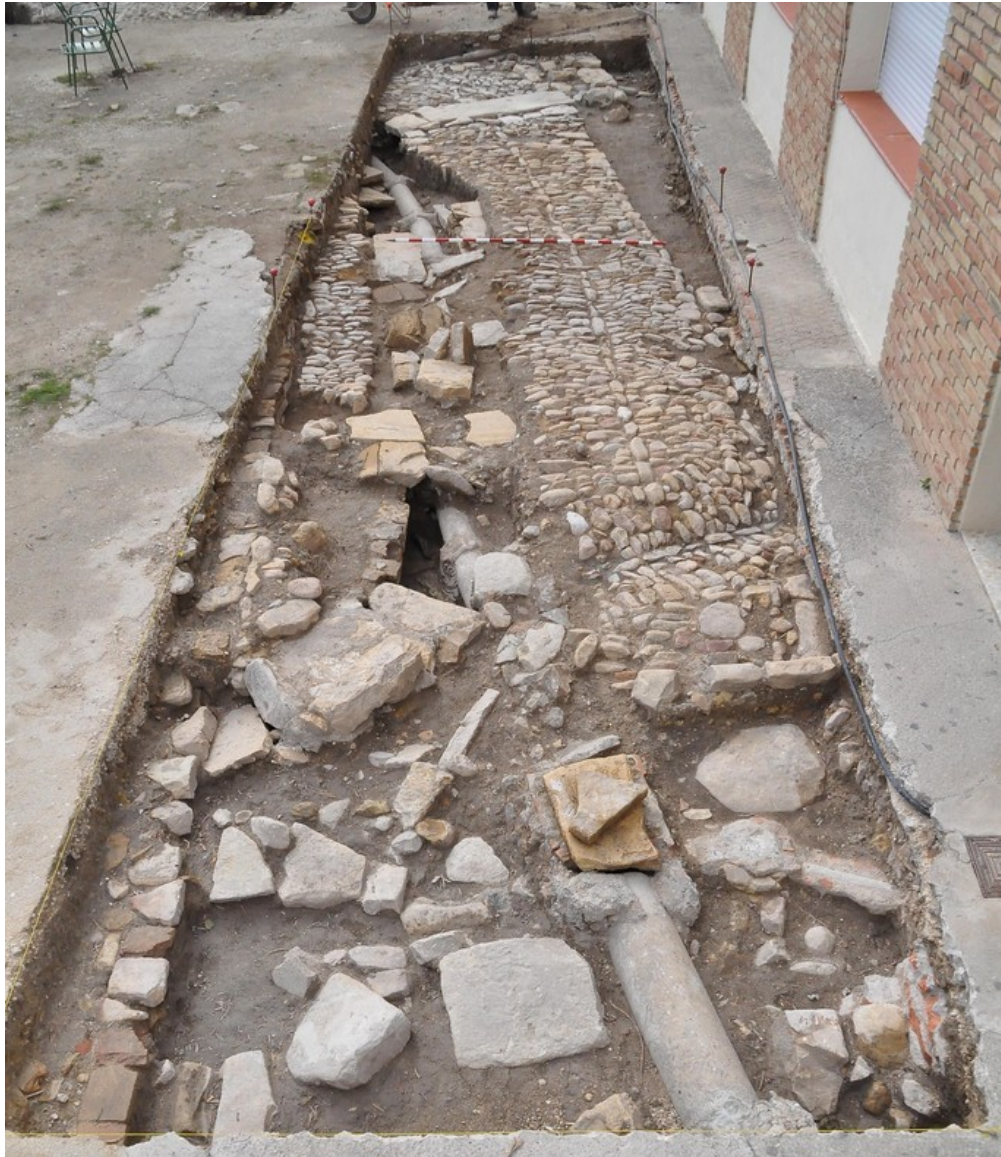
Fig. 6. Sondeo 5 y 6. Vista de calle E-38 cortada por el saneamiento E-43. Se observa el muro E-39 delimitando la calle por el norte y al muro E-64 delimitando la calle por el sur.

Fuente: Fototeca ARQVIPO. FD-2019-04-10-IMSVSA-035. Sign. Año 2019.