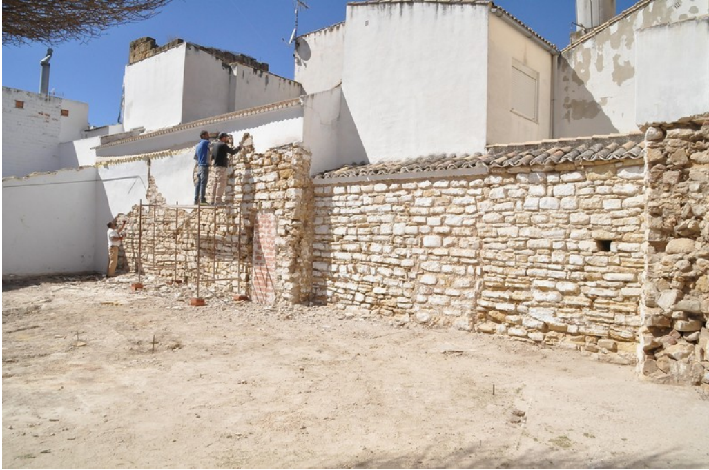
Fig. 3. Retirada de revocos actuales sobre el GE-1. Línea de Muralla de la Villa.