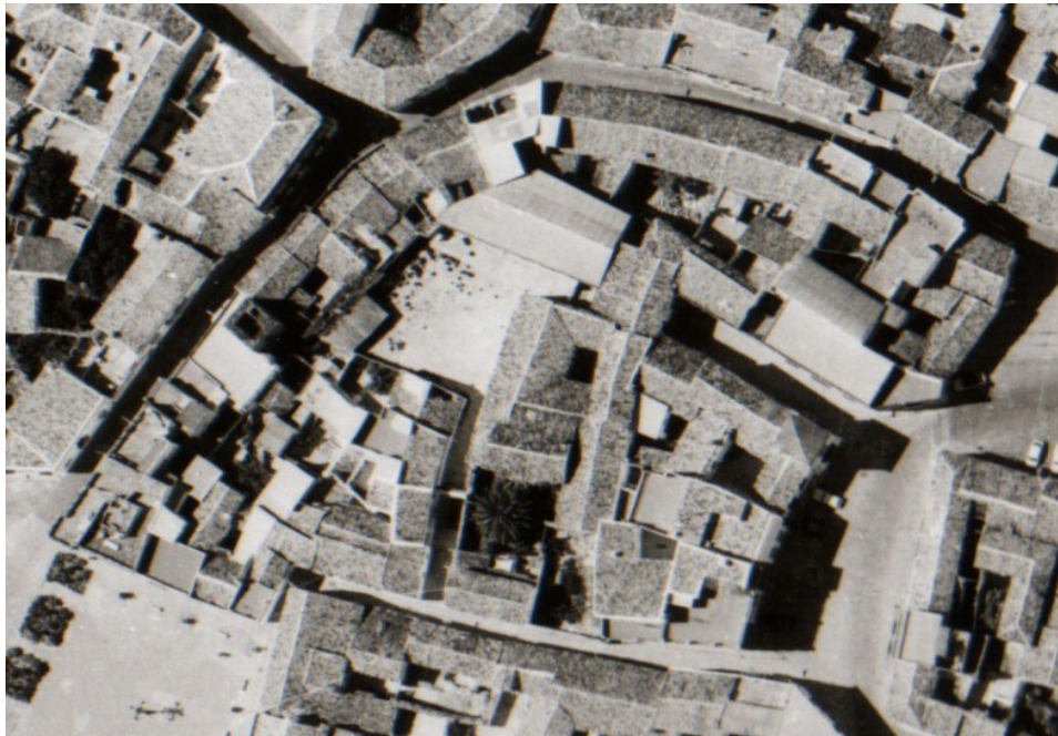
Fig. 1. La parcela de Acción Católica a mitad de la década de los 80 con la “Casa de Mendoza”, la casa de los caseros y el nuevo edificio de Guardería Infantil-Hogar del Pensionista.