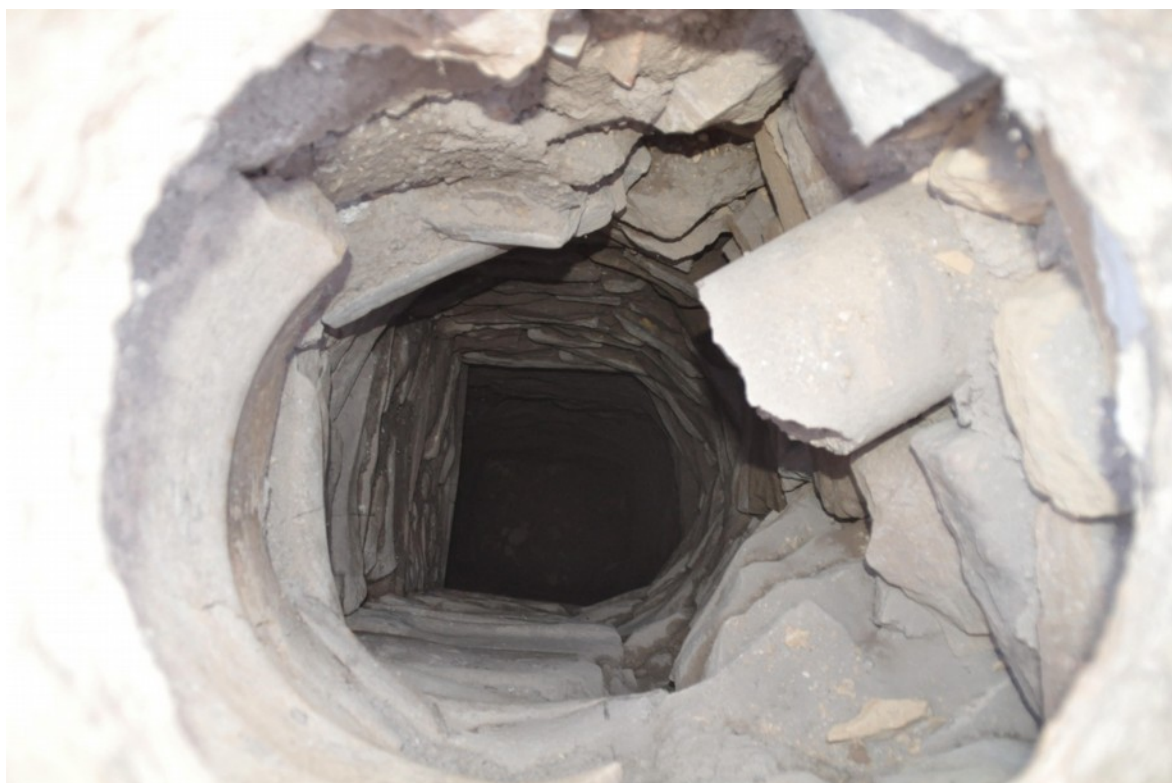
Fig. 12. Vista del pozo E-57.

Fuente: Fototeca ARQVIPO. FD-2019-05-07-IMSVSA-014. Sign. Año 2019