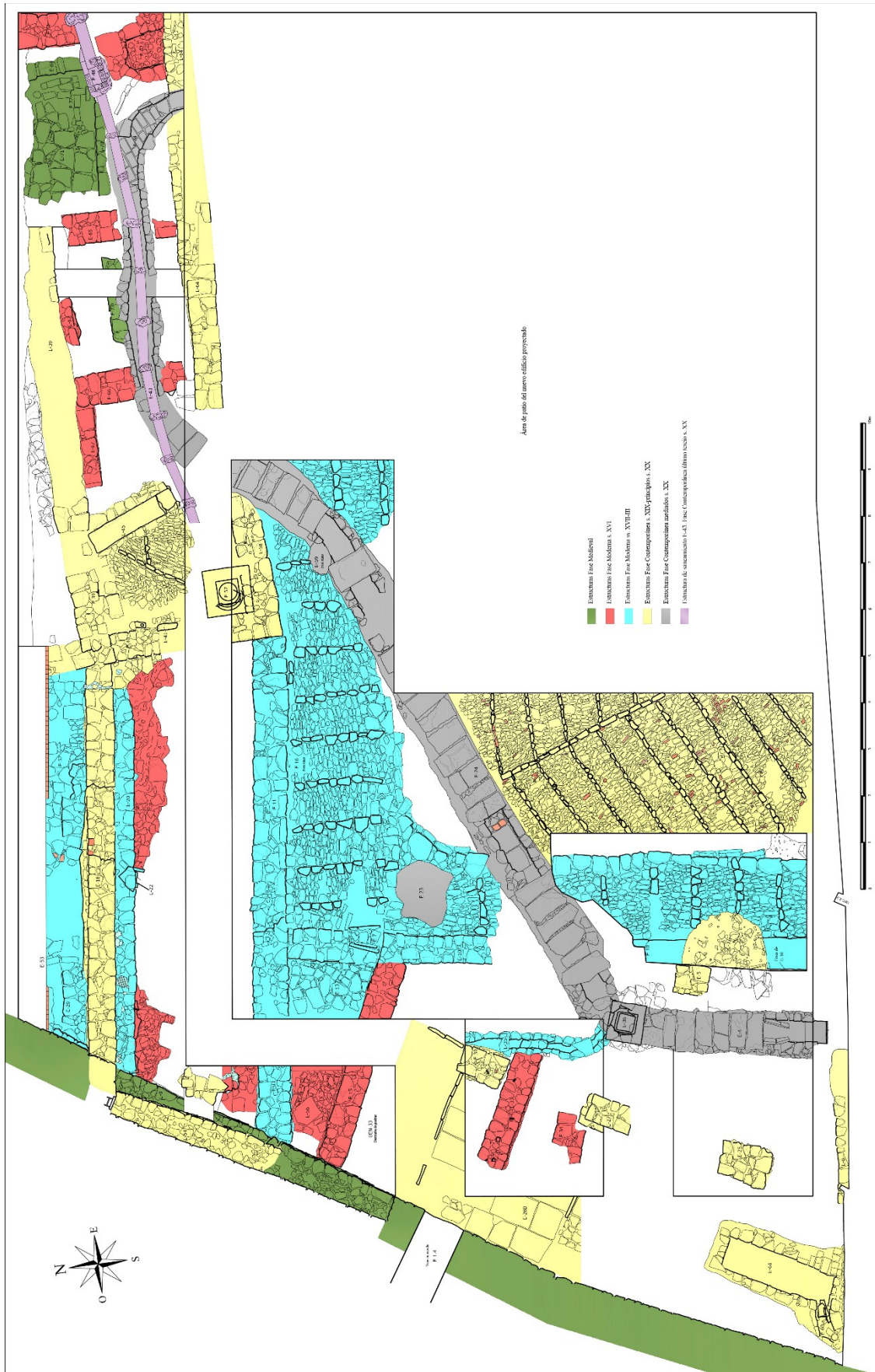
Lámina IV. Planta final con las estructuras adscritas a sus fases.