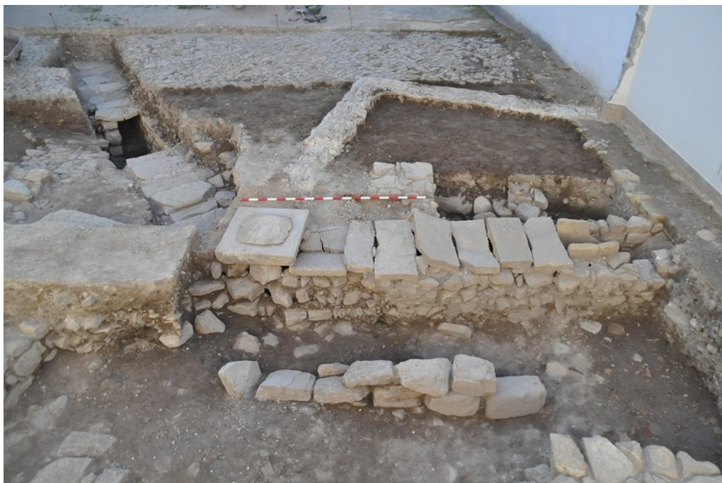
Fig. 9. Sondeo 1. Vista de las atarjeas E-4 y E-24 y su conexión con el pozo E-36.