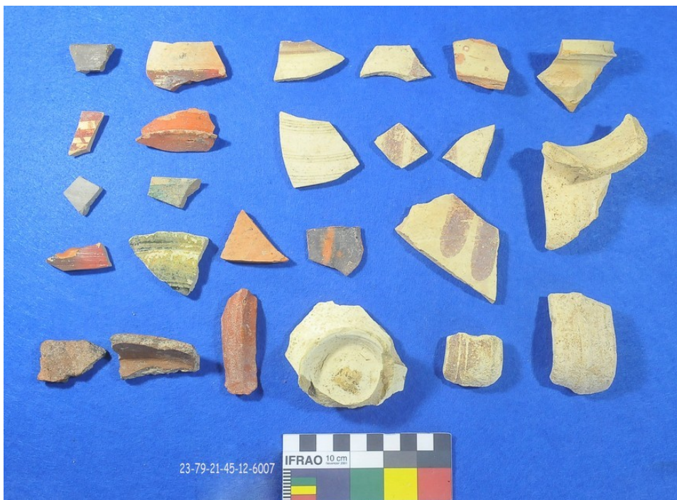
Fig. 14. Contexto cerámico de Época Medieval Hispanomusulmana o Andalusí ss. XI-XIII. Conjunto asociado a pavimento E-71.