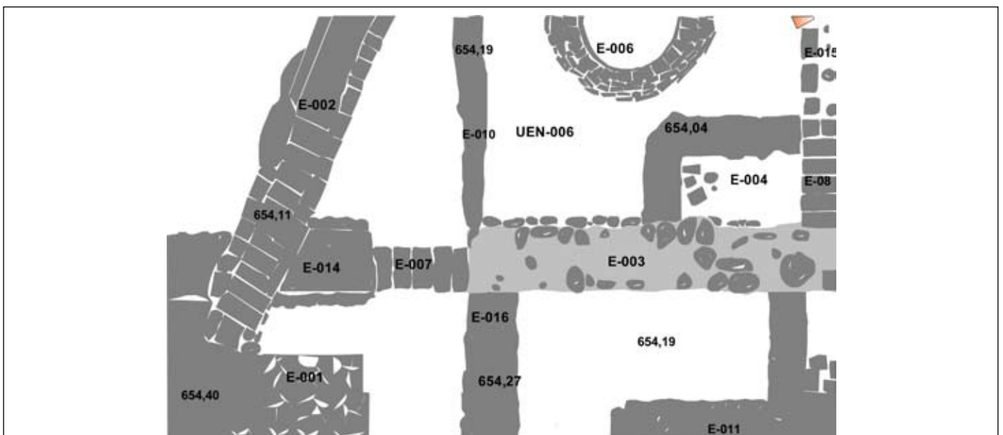
Figura 4. Planta del sector 2.

En el sector 2, esta fase está representada por un gran muro de mampostería E-003 ( de 2,90x 0,60x 1,00 m), que recorre el sector longitudinalmente de norte a sur, presentando zarpa de cimentación de cantos rodados de mediano y gran tamaño, asociado a otro muro de las mismas características E-014( 1,20x0,60x 1,00m), que dejan entre ellos una zona de paso, de una anchura de 0,90 m., posiblemente serviría de entrada a la vivienda, del que se conserva un suelo conformado por cuatro ladrillos de barro (E-007). La E-016, muro de mampostería( 1,20x0,40m,) que conecta con la E-003, sirviendo de cierre por su lado norte al CE-03, patio de la vivienda, en el que se