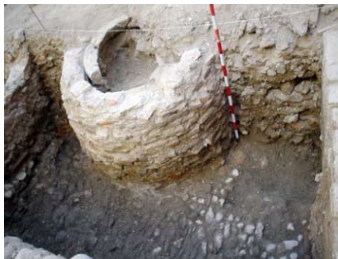
Lámina III. Detalle de la tinaja que rompe el empedrado de la 1ª fase moderna.

Tanto el sustrato geológico como las estructuras documentadas se hallan cubiertas por un nivel estratigráfico de relleno (UEN-0001), procedente del derribo de la vivienda actualmente demolida, con abundante material de construcción( fragmentos de ladrillos, tejas,etc), y fragmentos de cerámica principalmente por época contemporánea de tipo “Fajalauza”, abundando los fragmentos de lebrillos y fragmentos de cazuelas.