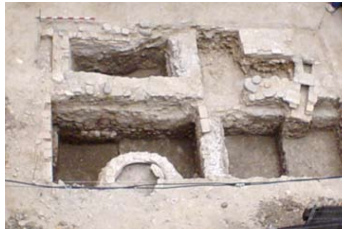
Lámina II. Vista general del sector 2.

El solar se encuentra en una zona de mediana pendiente, con una altitud media de 654 m.s.n.m. . El primer nivel que se documenta en ambos sectores corresponde al nivel geológico. En este caso, el substrato geológico se caracteriza por una tierra limo-arcillosa de color marrón grisácea muy compactada (UEN-0005), sin intrusiones artefactuales y con un alto grado de humedad.