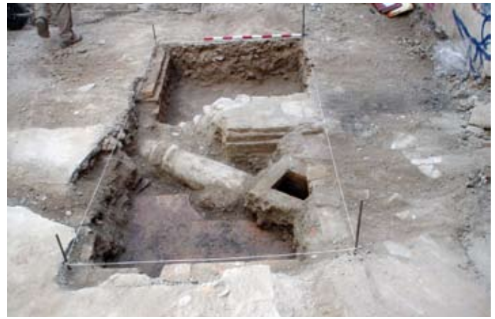
Lámina I. Vista general del sector 1.

En cuanto a la metodología de excavación el sistema utilizado ha permitido llevar a cabo la denominación de los elementos arqueológicos cuyas referencias locacionales han venido marcadas por las coordenadas U.T.M. Durante el proceso de excavación la documentación ha prestado especial atención a las unidades estratigráficas (depósitos sedimentarios naturales o antrópicos y estructuras arquitectónicas).