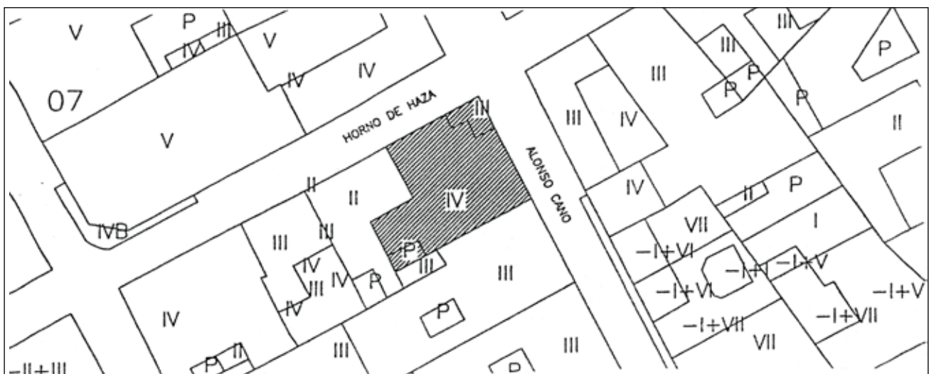
Figura 1. Ubicación del edificio en la ciudad de Granada. E. 1:500.

El proyecto de obra recogía la construcción de una losa de hormigón para la cimentación, de 0,50 m. de grosor y que con los 0,10 m. de hormigón de limpieza, tendrá una potencia de 0,60 m. se empleará HORMIGÓN ARMADO-HA-25 y acero del tipo B-500-S. La profundidad mínima a alcanzar será de un metro respecto a la rasante definitiva del terreno, que puede oscilar según el terreno existente, de 1 a 1,50 m. El foso del ascensor va a -1,50 m..