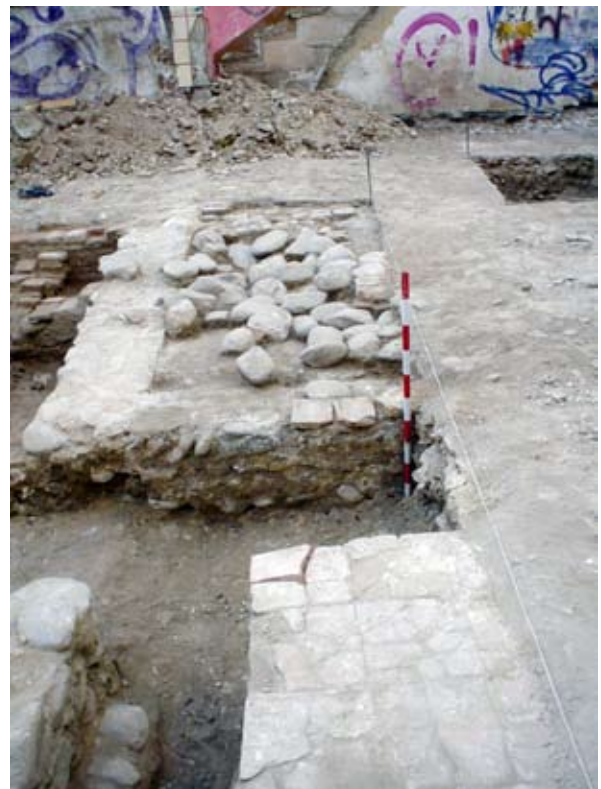
Lámina IV. Detalle del “encarchado” en el sector 2-B.

Todo este sector, dedicado principalmente a la explotación agrícola, se encontraba estructurado por una red de acequias que se derivaba de la conocida como el Darillo turbio. Así se encontraban las huertas, de origen islámico, de Genincada y de Gidida.