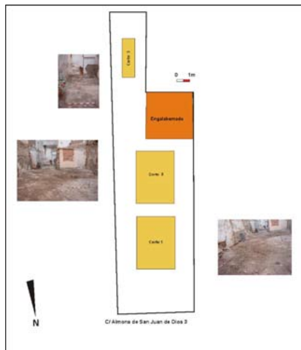
Figura 2. Planteamiento de la intervención arqueológica

El diseño espacial de los cortes arqueológicos llevado a cabo respetó en todo momento el que fuera propuesto en el proyecto de actuación arqueológica, es decir, tres cortes cuyas dimensiones fueron: dos cortes arqueológicos de 3 x 4 metros (cortes 1 y 2) y uno de 1 x 3 metros (corte 3). (Fig. 2)