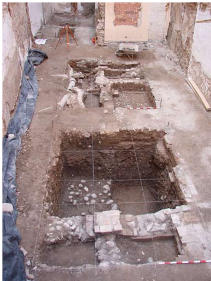
Vista general de la Intervención