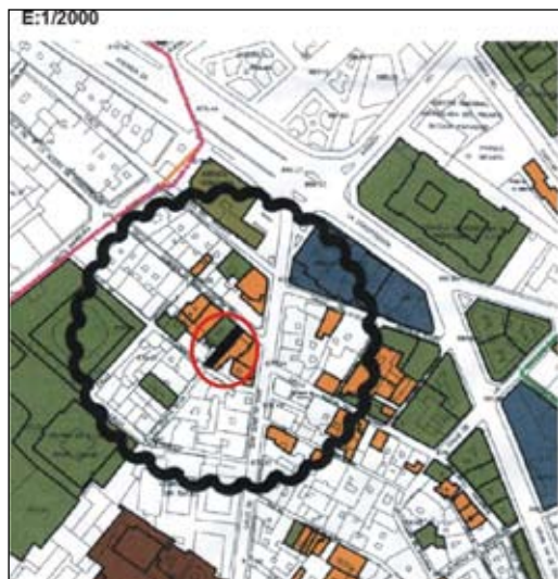
Figura 1. Localización del solar a partir del Plano catastral de Granada

El solar objeto de actuación se localiza en el nº 3 de la calle Almona de San Juan de Dios de Granada, presenta forma rectangular con orientación norte-sur y con una superficie de 132 metros cuadrados de los cuales 99 correspondieron a la superficie construida. La fachada principal y por la que se accede al inmueble está situada en su límite norte, tal como se aprecia en el plano de situación (Fig.1).