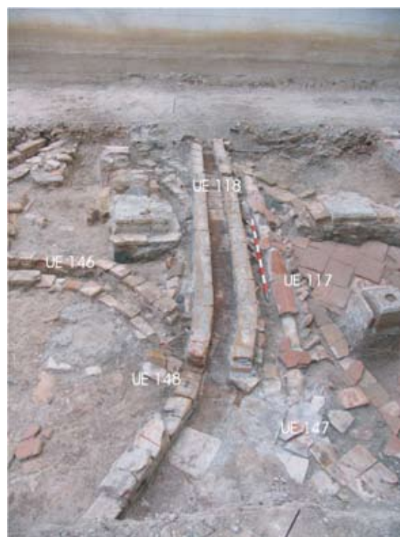
Lámina I. Vista general de sistemas de evacuación contemporáneos

Finalmente, adosado al cuarto pilar se excavó parte de una bajante de ladrillo ( UE 126 ) que se asocia a un tramo de atarjea que evacua directamente a la calle ( UE 127 ).