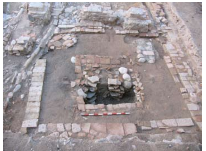
FASE 4: EXCAVACIÓN DEL ALCORQUE NAZARÍ