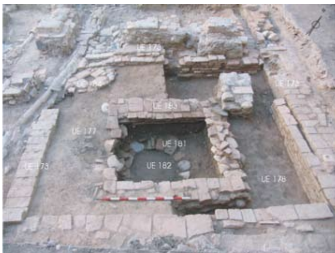
Lámina IV. Vista general del patio islámico. Casa 01

Sobre este último pavimento se dispone una conducción de agua de época moderna (UE 143) que permite evacuar las aguas pluviales desde el patio hasta la calle además de la construcción de un pozo (UE 181), aprovechando el hueco del alcorque, cortándolo en uno de sus extremos. Interiormente presenta un relleno de limos con tonalidades verdosas (UE 182), con algunos fragmentos de cerámica del siglo XVI-XVII, lo cual nos da la cronología del periodo de uso.