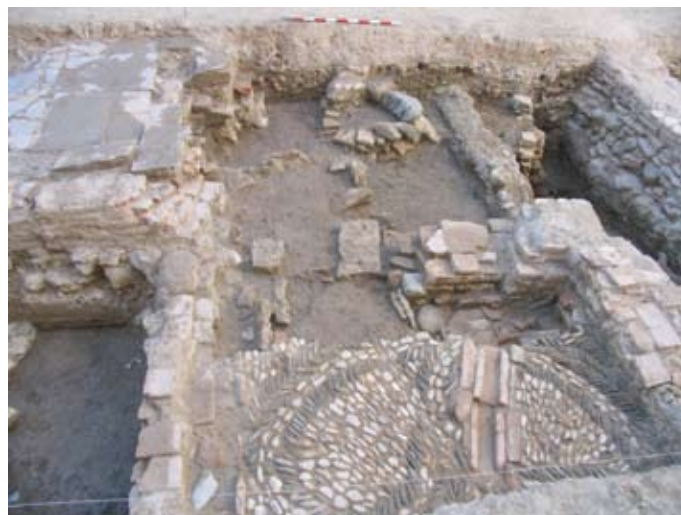
Lámina VIII. Vista general Ámbito 03

Finalmente sólo nos resta indicar que entre la zanja del aljibe ( UE 211 ) y el muro de tapial se documentó una pieza de cerámica en forma de alcadafe o panera de gran tamaño, de época almohade que se encuentra rellena de un estrato de tierra suelta ( UE 239 ) en el que se recuperaron varias piezas de la misma época completas, si bien no podemos relacionarlo funcionalmente con el resto de la vivienda ya que este sector se encuentra fuertemente alterado por el aljibe.