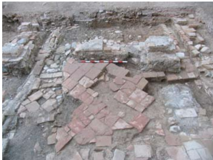
FASE 1: PATIO EN ÉPOCA MODERNA