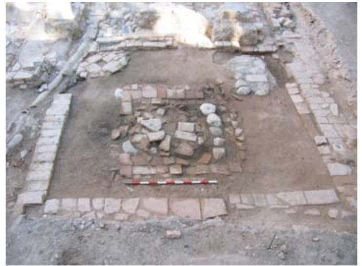
FASE 3: VISTA GENERAL DEL PATIO CON JARDÍN. SIGLO XIV-XV

Finalmente podemos comprobar como el diseño original del jardín es en una cota inferior al andén y sin alcorque central.