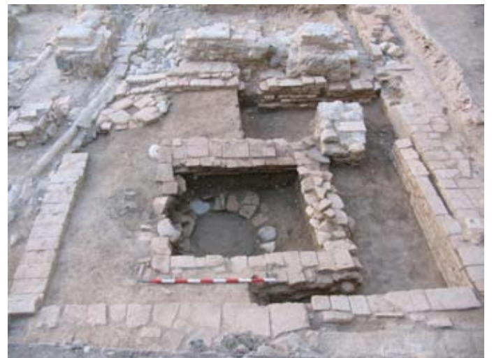
FASE 5: EXCAVACIÓN DEL PATIO-JARDÍN HASTA LA COTA DEL SIGLO XI-XII