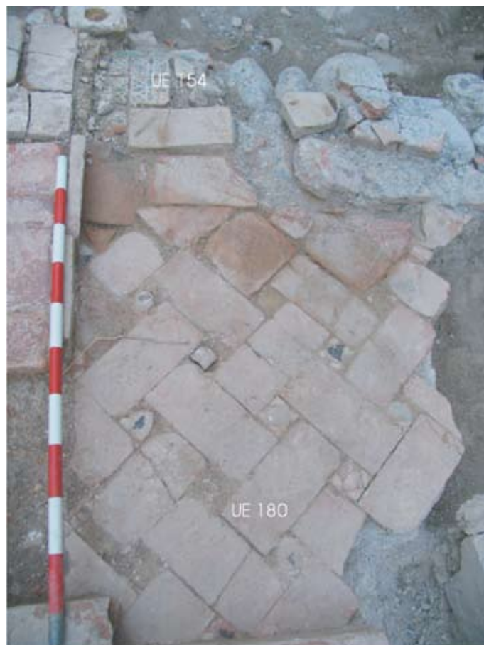
Lámina V. Pavimento almohade. Casa 01

Se observa con claridad cómo los restos del muro islámico se encuentran amortizados por los pilares de la casa contemporánea que sustituyen funcionalmente a aquel.