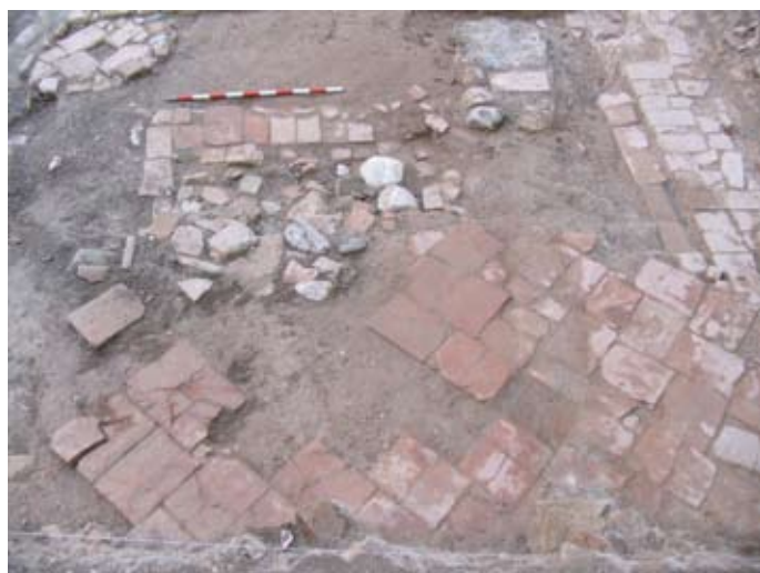
FASE 2: PROCESO DE EXCAVACIÓN. DELIMITACIÓN DEL POZO. EN USO EN EL SIGLO XVI.