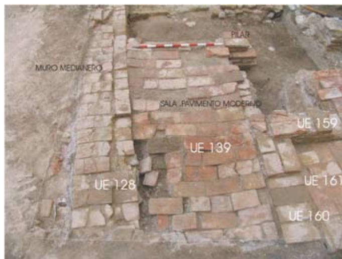
Lámina II. Vista general del pavimento contemporáneo

Dado que la excavación nos muestra elementos más recientes de la casa y otros de época islámica, entre los que se intuye la estructura de una vivienda, se procedió a eliminar los elementos que distorsionaban una lectura de la fase medieval, en especial las conducciones de saneamiento. Durante el desmontaje de la UE 127 también se excavaron una serie de aportes de relleno contemporáneo (UE 138) que cubren una importante bolsa que contiene material cerámico del siglo XVII (UE 140).