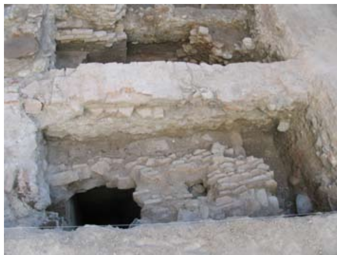
Lámina VII. Vista general del Aljibe moderno

En la cara interna se documenta otra zona de letrinas que presenta las mismas características que las de la casa del sondeo 01, es decir, una retícula de lajas de arenisca y un pozo ciego de cuarto de círculo.