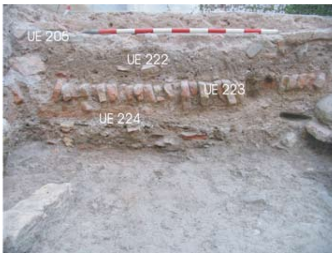
Lámina VI. Detalle de sección. Ámbito 01. Sondeo 02

Ambos espacios se encuentran separados por un muro, que actuaría de escalón (UE 204) ya que bajo los restos removidos del empedrado, bajo el que se documenta el desagüe del patio por medio de una atarjea que se dirige hacia la calle en dirección noroeste (UE 205), se excavaron los restos de un primer nivel de pavimento de ladrillos a sardinel (UE 223) en una cota ligeramente inferior que presenta una preparación de tierra rojiza sobre un lecho de cal (UE 224).