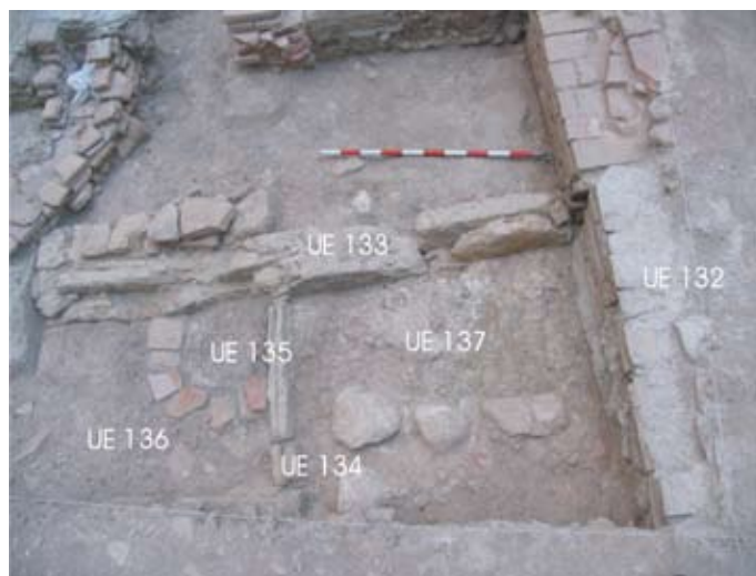
Lámina III. Detalle de la zona de letrinas. Casa 01

Sin embargo, el extremo sur de la crujía, que coincide con el fondo del solar y que queda dentro de la segunda ampliación, no permite aportar muchos más datos. La jamba derecha de la puerta fue sustituida por un pilar contemporáneo, del que sólo queda la cimentación de cantos y cemento, mientras que el pavimento ha desaparecido debido a la construcción de una estructura de bloques de hormigón.