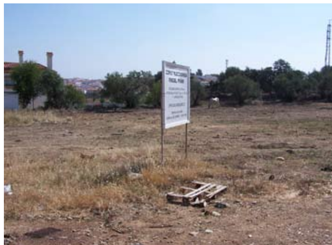
Lámina III. Vista de la superficie del Sector 2.

de tierra vegetal tiene muy poco espesor, y por lo tanto disminuye el posible potencial arqueológico. De este modo, de toda la superficie del denominado Sector 2 sólo encontramos un único fósil arqueológico, hallado en la zona norte comprendida entre los transeptos 28 y 29; se trataba de un pequeño fragmento cerámico de una taza de loza blanca, cuya calidad nos hace pensar que debió de ser producida, al menos, a comienzos del siglo XX.