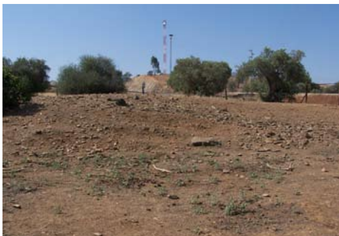
Lámina I. Vista de los restos constructivos en superficie de la porqueriza-establo hallado en el Sector 1

Por otra parte, se ha elaborado un recuento de los materiales encontrados en este Sector de la parcela: un 72% de ellos corresponden a piezas fabricadas en el siglo XX, entre las que predominan la loza blanca (3 fragmentos), las cerámicas policromadas (3 fragmentos de galbos, asa y un borde de lebrillo), un fragmento de porcelana y otro de un azulejo industrial de la segunda mitad de esta centuria; un 23% a fragmentos datados en el siglo XIX (se trata de tres ejemplares, entre los que destaca una cerámica originaria de la serranía de Huelva que imita los modelos italianos fabricados en Pisa, que a su vez intentaban reproducir la marmorata del siglo I d.C.); y un 2% (sólo un ejemplar de reducidas dimensiones y muy rodado) corresponde a Terra Sigillata Hispánica.