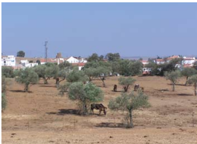
Lámina II. Vista general del Sector 1.

Por otra parte, se ha elaborado un recuento de los materiales encontrados en este Sector de la parcela: un 72% de ellos corresponden a piezas fabricadas en el siglo XX, entre las que predominan la loza blanca (3 fragmentos), las cerámicas policromadas (3 fragmentos de galbos, asa y un borde de lebrillo), un fragmento de porcelana y otro de un azulejo industrial de la segunda mitad de esta centuria; un 23% a fragmentos datados en el siglo XIX (se trata de tres ejemplares, entre los que destaca una cerámica originaria de la serranía de Huelva que imita los modelos italianos fabricados en Pisa, que a su vez intentaban reproducir la marmorata del siglo I d.C.); y un 2% (sólo un ejemplar de reducidas dimensiones y muy rodado) corresponde a Terra Sigillata Hispánica.