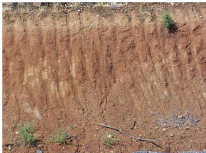
Lámina IV. Perfil de la cuneta junto a la carretera A-499.

Tal y como se propuso en el Proyecto de esta Actuación Arqueológica, uno de los objetivos a perseguir era no sólo la localización de los yacimientos arqueológicos en el área de estudio, sino también en su entorno más inmediato, por lo que se procedió a la supervisión visual de los alrededores de la finca, donde únicamente se pudo localizar los restos de dos molinos de viento que antaño se emplearon para la muela del cereal y cuyo origen no podemos precisar, pues no encontramos en sus alrededores materiales que nos permitiesen aportar una cronología más o menos fidedigna.