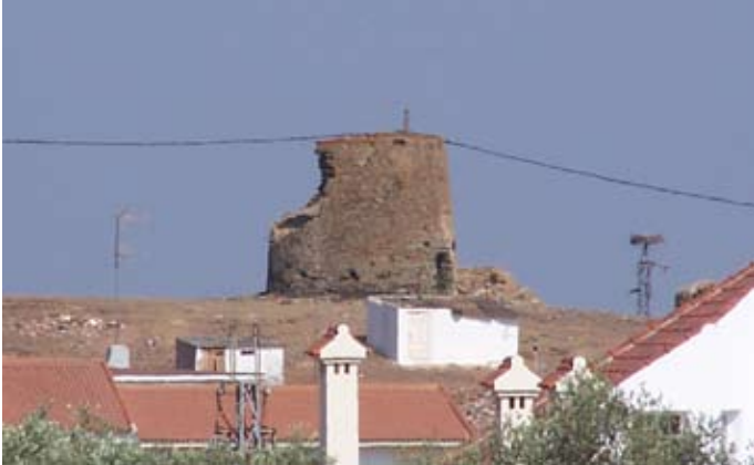
Lámina V. Molino de “La Chana”.

Del mismo modo, la documentación consultada no aporta más información que la ya mencionada en el apartado dedicado a la presentación del contexto histórico de la Memoria; las últimas publicaciones sobre investigaciones arqueológicas en el término municipal de Puebla de Guzmán son las llevadas a cabo en el año 2002, consistentes en una Prospección Arqueológica Sistemática en el área inundable de la presa del Andévalo, en la que se detectaron numerosos yacimientos de cronología indeterminada dentro del término de este municipio, entre los que destaca el de La Junta, ubicado en la unión de los ríos Albahacar y Malagón, en una zona alejada del solar que nos atañe, y donde se localizó un asentamiento fortificado de la Edad del Cobre.