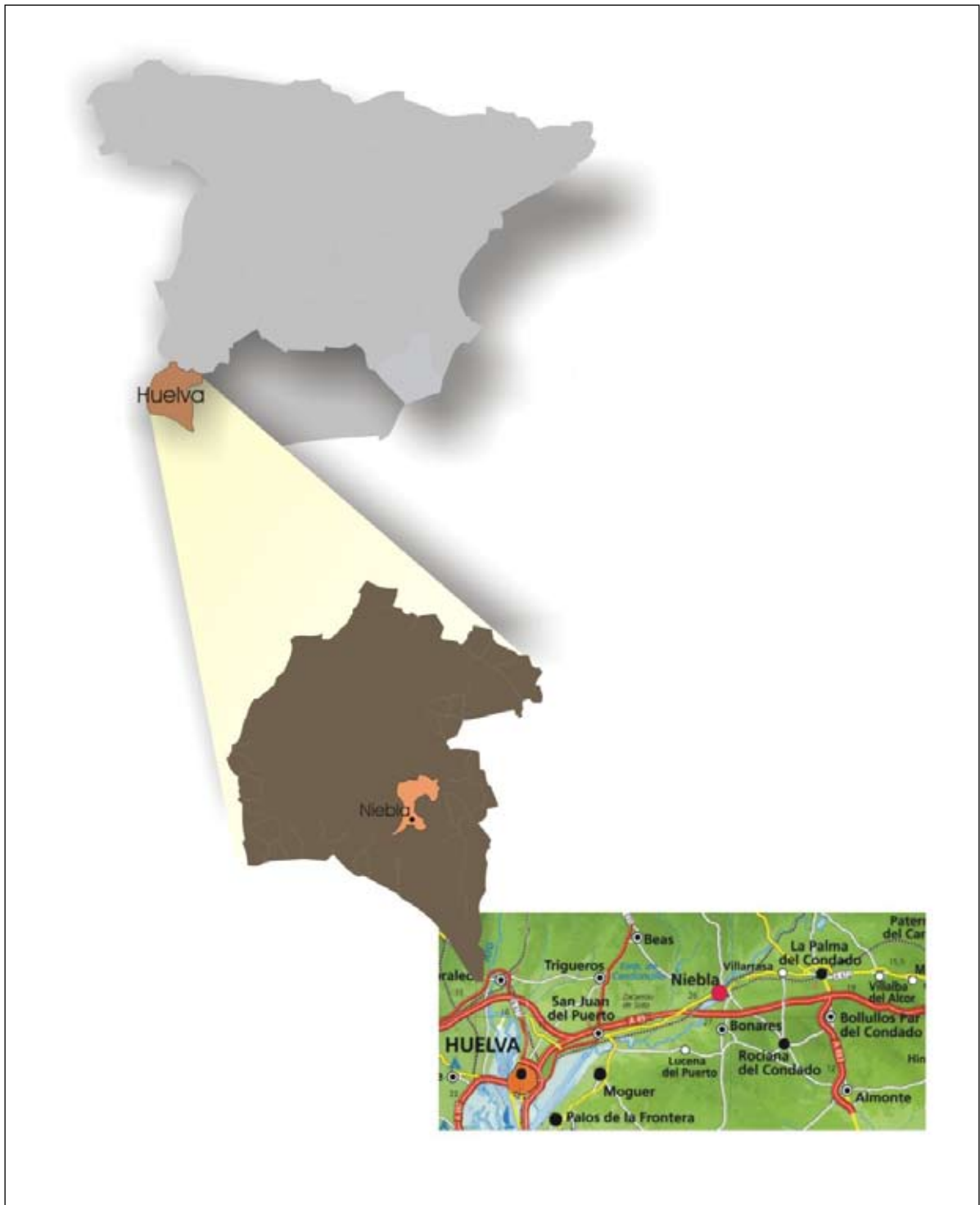
Figura 1. Localización del término municipal de Niebla.