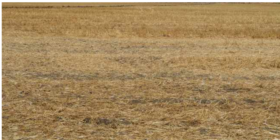
Láms. X a XII. Sector B.