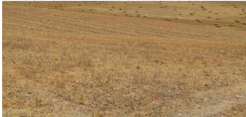
Láms. VI a IX. Sector B.