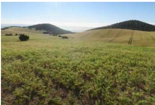
Láms. XXVII a XXXIII. Sector 2.