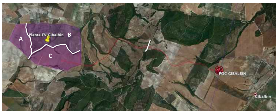
Figura 5. Sectores de la central solar y línea de evacuación Gibalbín.

Los resultados arqueológicos, respecto al hallazgo de nuevos yacimientos, han sido positivos, concretamente en el sector C.