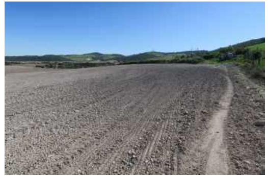
Láms. XIII a XVI. Sector C.