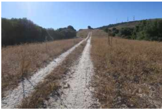
Láms. XX a XXVI. Sector 1.