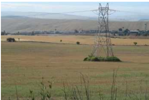
Láms. XXXIV a XL. Sector 2.