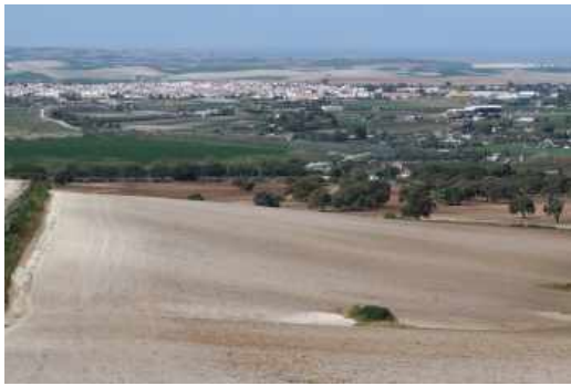
Láms. I a V. Sector A.