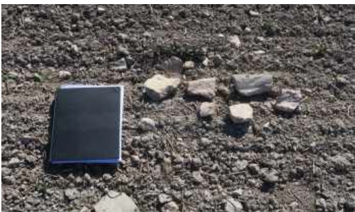
Láms. XVII a XIX. Sector C. Yacimiento arqueológico "La Mazmorra".