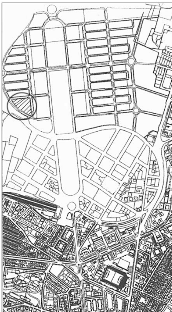
Figura 1. Situación de la parcela

El solar tiene forma de polígono irregular y ocupa una superficie total de 8417,48 m 2 .