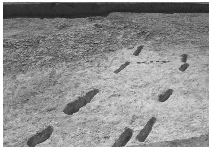
Lámina II. Huellas de cultivo.

La Fase 2 está determinada por las huellas de cultivo de viñedo documentadas en los transectos 1 y 2, y la ampliación realizada entre ambos. Estas huellas con unas dimensiones de 10-15 centímetros de anchura por 40-50 centímetros de largo, tienen una disposición regular y homogénea con una separación entre ellas de 1, 5 a 2 metros. Su relleno máximo conservado es de 25 centímetros. Este cultivo es anterior al último cultivo de olivar que ha estado en uso hasta hace pocos años. Esta fase corresponde a una época relativamente reciente, siglo XIX o principios del XX. Apenas apareció material en el interior de estas huellas, tan sólo algún fragmento de material cerámico vidriado pequeño y rodado.