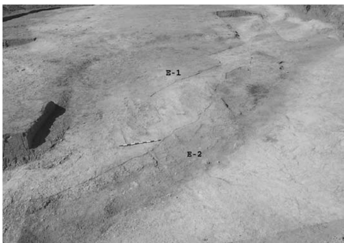
Lámina I. Vista General de área norte del solar