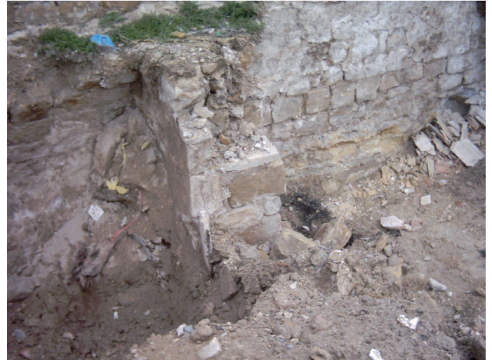
Lámina VII. Detalle puerta de acceso entre dos cantinas.

En el sector norte del solar se localizaron tres cantinas conectadas por dos puertas de acceso (Lámina VII). Estas cantinas pertenecían a la casa de los propietarios de la fábrica de harina, y se encontraban ubicadas al norte del solar, limitando a la calle Ventanas.