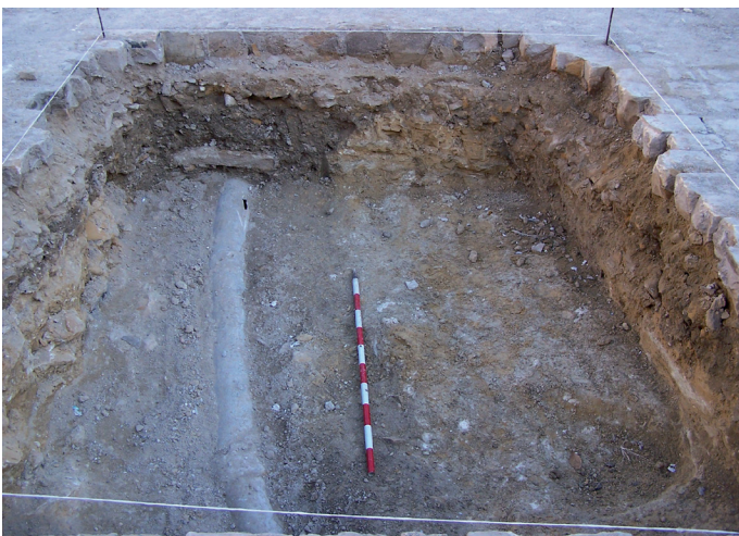
Lámina III. Corte 5: U.E. 4 (zanja), U.E. 5 (cubierta de hormigón) y U.E. 6 (tubería).

En la superficie de este corte existía un empedrado (adoquines), ya que este sector del solar no pertenecía a la fábrica, sino que formaba parte de la antigua Plaza de la Aguardentería que fue adosada al solar una vez dejó de funcionar la fábrica, a mediados de los años 70. Bajo él la potencia era escasa y tan sólo se localizó una tubería de hormigón en dirección oeste-este, cuya fosa cortaba la roca (Lámina III).