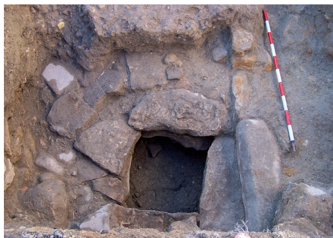
Lámina I. Corte 1: U.E. 9 (brocal de un pozo de grandes piedras) y U.E. 10.

Por su parte, el muro (UE 10) se encontraba junto al pozo, al norte. Presentaba una dirección este-oeste y había sido construido con piedras de tamaño mediano, excepto junto al pozo, donde se utilizaron losas similares a las que formaban el brocal. Apareció derruido por la cimentación de la fábrica. En el entorno de ambas estructuras (UE 9 y 10) se encontró material moderno (Lámina I).