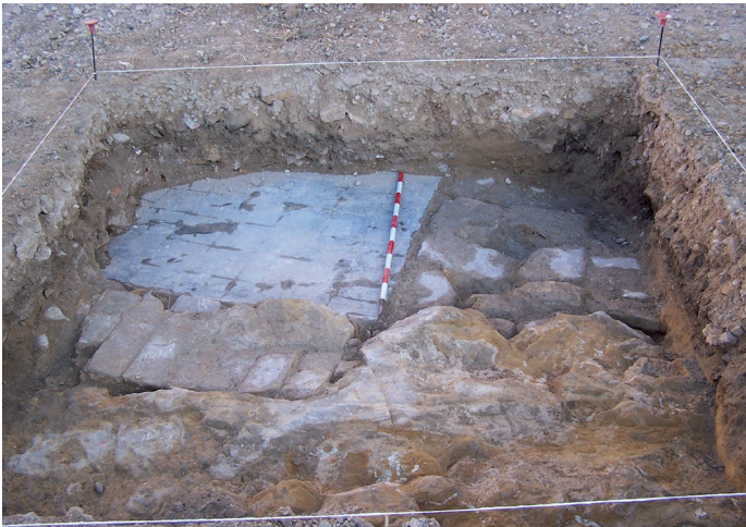
Lámina II. Corte 3: U.E. 5, U.E. 6 (pavimento) y U.E. 7.

En el corte 4 existía muy poca potencia y únicamente se encontró un pequeño pilar de ladrillos y una atarjea (UE 4) que cortaba la roca en dirección norte-sur.