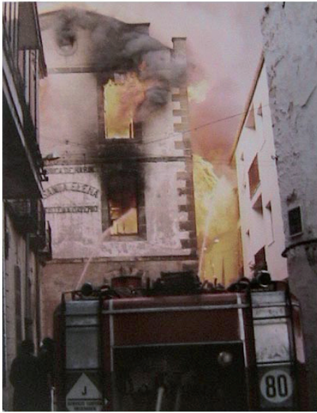
Lámina IX. Fachada de la fábrica incendiándose (21 de junio de 1982).