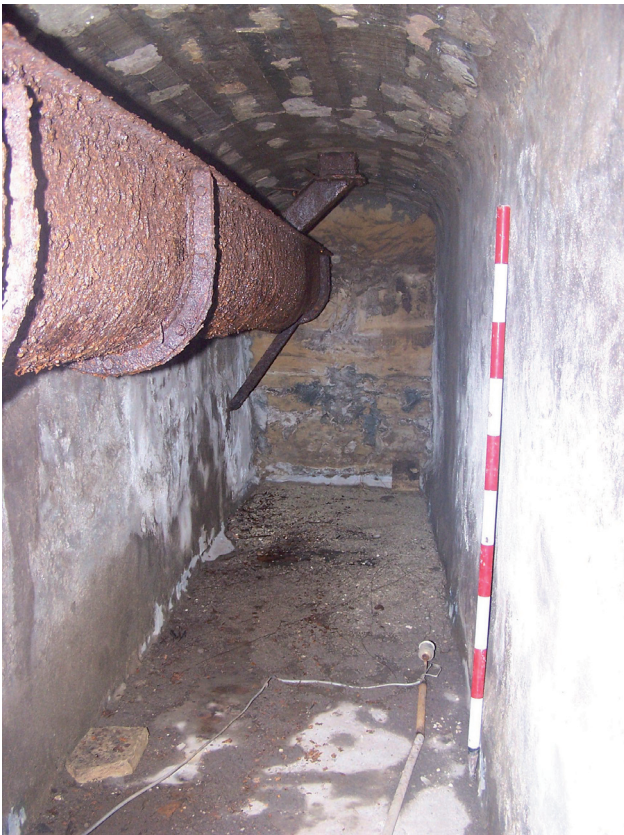
Lámina VI. Corte 9: U.E. 5 (Túnel).

En este corte la roca había sido rebajada para construir un túnel de ladrillos y cemento (UE 5), con una dirección sur-norte, que atravesaba el subsuelo de todos los silos, para trasportar el grano por medio de un sinfín instalado en su interior (Lámina VI).