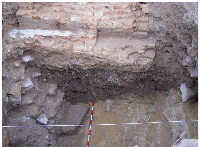
Lámina V. Corte 7: U.E. 4 (pilar), U.E. 6 (pavimento) y U.E. 8 (zapata).

Los restos encontrados pertenecen a una sala de máquinas situada en una planta subterránea de la fábrica.