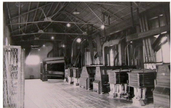
Lámina VIII. Interior de la fábrica, año 1956.