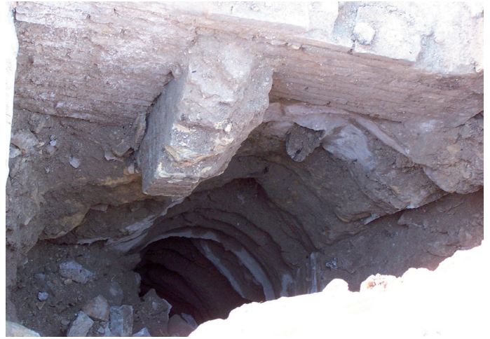
Lámina IV. Corte 6: U.E. 10 (muro de ladrillos) y U.E. 12 (pozo).

Tras la aparición de este pozo se abandonó la actividad en el corte 6, por motivos de seguridad (Lámina IV).