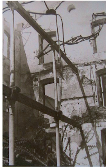
Lámina X. Interior de la fábrica una vez extinguido el incendio.