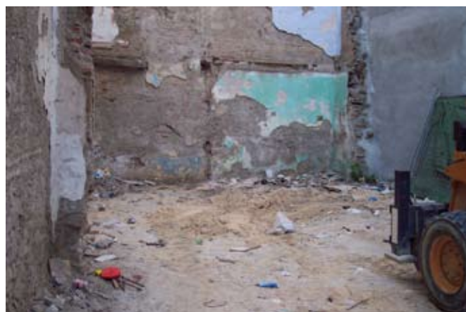
Lámina II. Situación del solar antes de iniciar los trabajos de rebaje.

La metodología seguida ha consistido en la realización de una zanja cautelar que atravesaba la parcela longitudinalmente, sus dimensiones han sido de 15 por 3 mts. En uno de los laterales del solar, en la parte derecha vista desde calle Refino, en su acera, por medidas de seguridad ya que el edificio colindante, en lo que a la medianera se refiere, no presenta las mejores condiciones, la ausencia de restos en uno de los extremos de la zanja, hace que optemos por seguir con la zanja, ante la presencia de nivel geológico, a una profundidad de 1,30 mts.