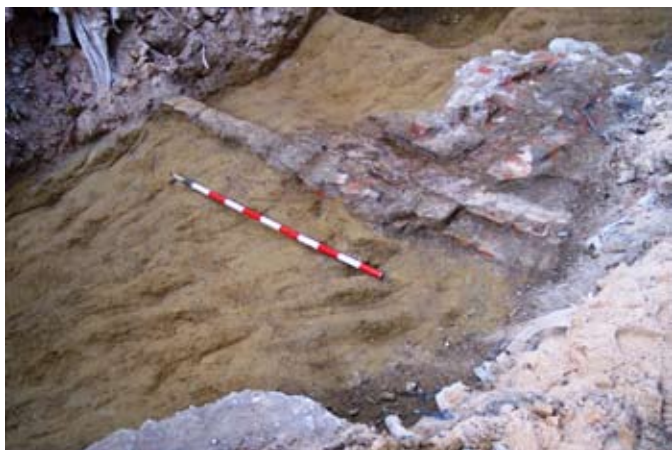
Lámina III. Detalle de la estructura de ladrillo, apoyada sobre los limos amarillos.

Aparece una estructura de ladrillo y mortero, con solamente una fila de ladrillos, de construcción contemporánea, sin restos cerámicos, y de noreste a noroeste en la zanja abierta, apoyado en el nivel geológico. Tras limpiar y documentar mediante fotografía, se continúa una zanja de un metro de ancha y longitudinalmente atraviesa el solar, donde continúa los limos amarillos anteriormente descritos.