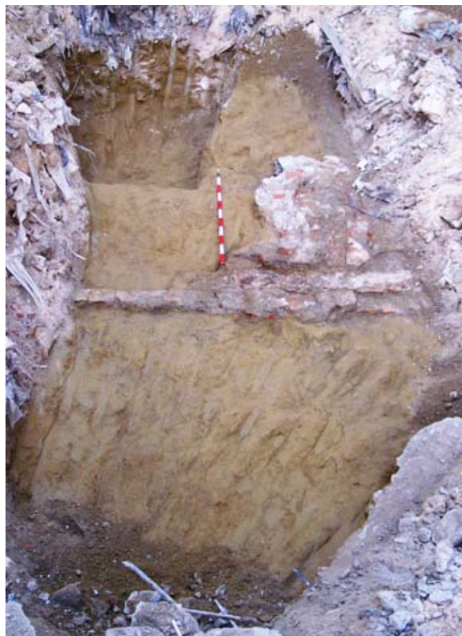
Lámina VI. Vista general del rebaje mecánico en el solar.