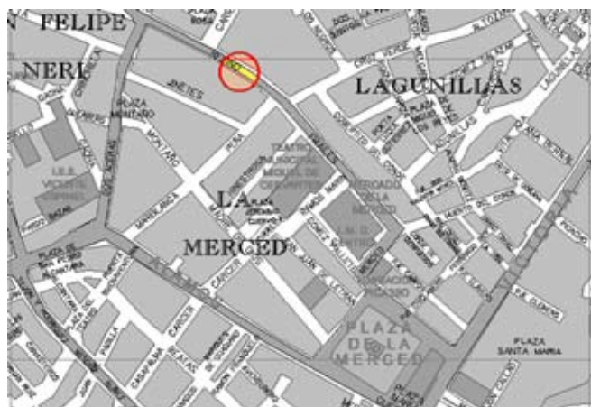
Lámina I. Situación del inmueble. Información obtenida del Mapa topográfico de Andalucía. 1:10.000. Mosaico raster, editado por la Consejería de Obras Públicas y Transportes de la Junta de Andalucía.

La configuración de este sector como zona dedicada a la producción de cerámica no parece casual, si tenemos en cuenta que los niveles geológicos están compuestos fundamentalmente por arcillas sedimentarias que constituyen una excelente materia prima. En este sentido, las evidencias documentada en la intervención de 1998, lejos de revestir carácter puntual, cuentan con un precedente importante en los trabajos arqueológicos realizados en 1994, a raíz de los cuales se obtuvieron datos parangonables con los ya reseñados (MAYORGA, 1994), datos que hacen hincapié en el hecho de que las instalaciones alfareras abarcaban amplios sectores de la ladera meridional de la colina de El Ejido.