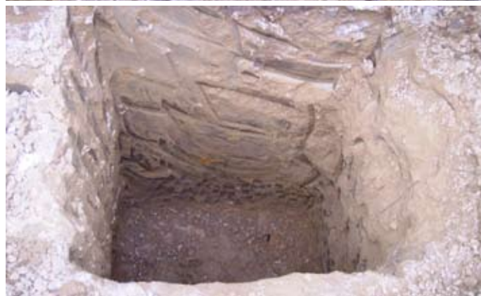
Lámina V. Pozos que se abren según proyecto de obra.