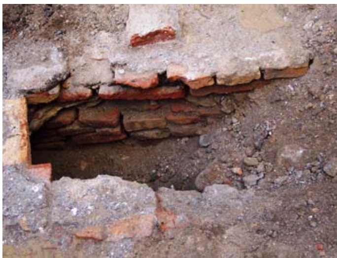
Lámina IV. Arqueta

Los trabajos de extracción de tierra prosiguen, y en la parte derecha del solar aparece una arqueta de construcción contemporánea, ladrillo y mortero, el relleno es terrígeno y basura actual, sin restos cerámicos de interés arqueológico, tras ser documentado se levanta y se deja la parcela en una cota regularizada en la totalidad del solar, donde se aprecian los limos arcillosos.