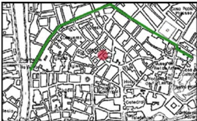
Figura 2. Localización del inmueble (punto rojo) en el contexto de la ciudad islámica, cuyo límite norte aparece marcado en verde.

El tránsito entre la Antigüedad y el Medioevo coincide con la formación de potentes depósitos de limo y arcilla, que evidencian el desarrollo de procesos aluviales más o menos intensos en el eje Juan de Padilla-Convalecientes. En este sentido, solamente a partir del siglo X, se documentan nuevos niveles de ocupación, ya en el contexto de la medina post califal (RODRIGUEZ,2001;LÓPEZ,2002 y MANCILLA,2003).