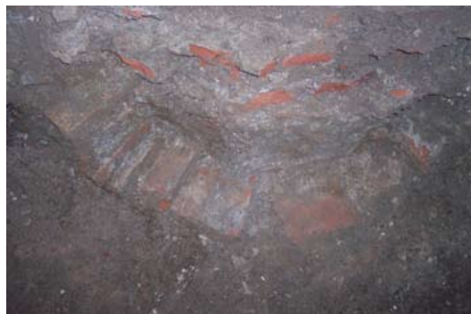
Lámina III. Detalle del pozo.

Otro elemento que se localiza es un pozo, de fábrica con ladrillo y mortero, el cual esta destrozado por una estructura de ladrillo y hormigón, posible cimentación ya que se observa en la totalidad del perfil.