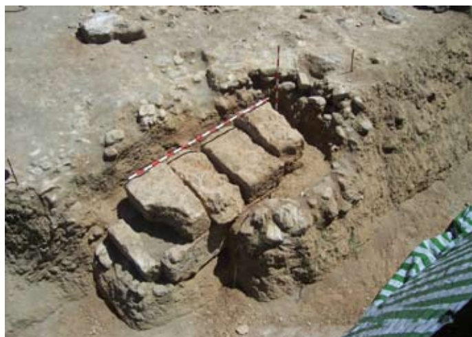
Lámina I. Vista general del enterramiento con su cubierta.

La cubierta del enterramiento desarrollada con cuatro sillares de 50 x 50 x 100 cm. dispuestos horizontalmente sobre el mismo, aun así se apreciaba la ausencia de un quinto sillar por el cual se había practicado el expolio de la misma, documentándose restos de materiales (cerámica, metal, etc.) en el exterior de la tumba.