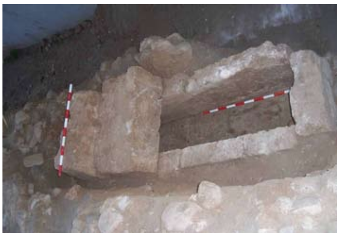
Lámina V. Vista de la tumba del Corte 4 excavada

Este hallazgo supone una importante aportación al conocimiento de los sistemas de enterramiento que tuvieron que desarrollarse durante la transición del mundo púnico al romano-republicano en esta zona de la desembocadura del río Algarrobo.