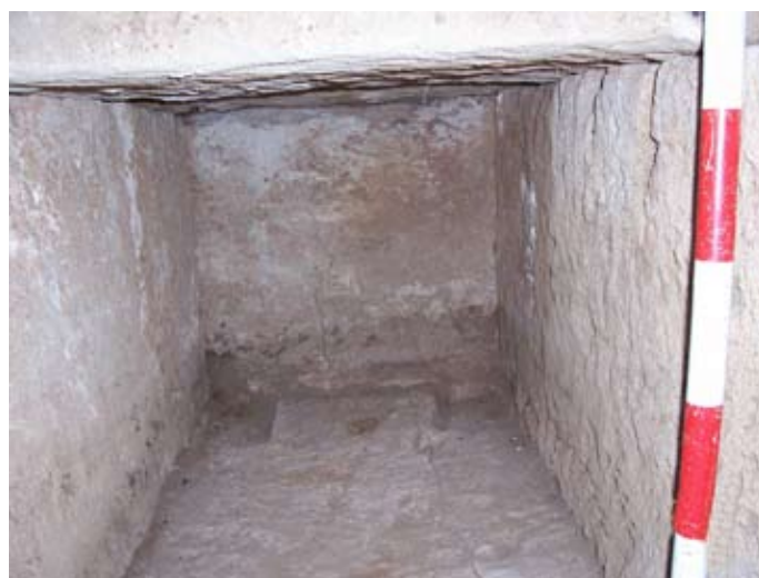
Lámina III. Vista del Interior de la Tumba con los hundimientos citados en las esquinas.

Dentro del enterramiento se documentó un hundimiento de forma cuadrangular (20x 20 cm.) en las cuatro esquinas del mismo, quizás asociado a la colocación del ajuar o para la fijación de las cuatro patas de algún tipo de parihuela en la que fuera colocado el muerto.