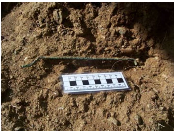
Lámina IV. Hallazgos metálicos localizados al exterior del enterramiento

Lamentablemente las afecciones producidas por el expolio desde antiguo que han provocado un vaciado del mismo, impiden conocer mejor su construcción y la singularidad del rito y el ajuar que la acompañaba, ya que todo parece indicar que pudo poseer un rico ajuar, dado la calidad del enterramiento.