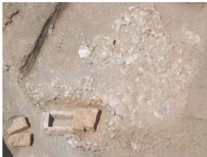
Lámina II. Vista General del enterramiento y la aglomeración de piedras perimetral.

El sistema constructivo de esta tumba, es bien conocido en el mundo antiguo, se dispone de una fosa de cimentación, donde se colocan los sillares que forman la base de la tumba, utilizando para ello sillares calizos, después se colocan las paredes y la cubierta empleando el mismo tipo de materiales, alrededor de la misma se documentó una aglomeración de piedras quizás asociadas a una posible estructura tumular aunque este hecho no ha podido ser fehacientemente constatado por el seccionamiento producido por un bancal en la franja sur del enterramiento.