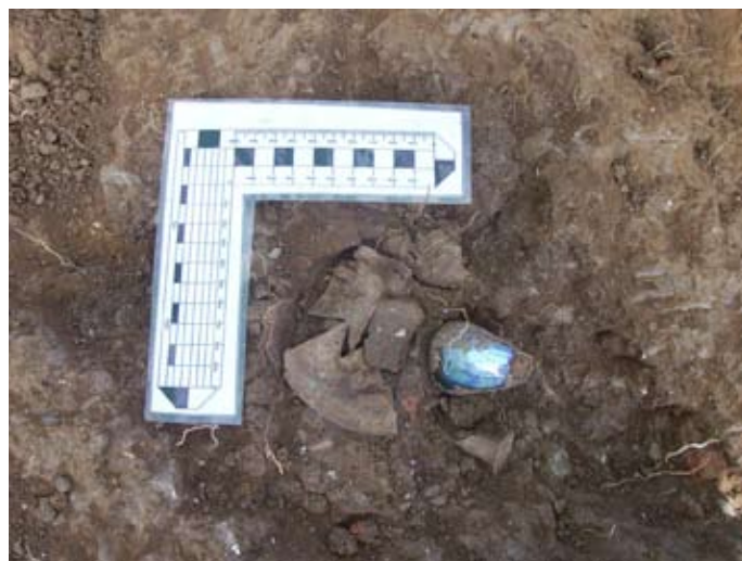
Lámina VI. Ungüentarios de vidrio localizados en el corte 52.

Cabe destacar la presencia de varios ungüentarios de vidrio, de formas diversas, los cuales se encuentran en proceso de restauración, este material avalaría el uso de esta zona como necrópolis, lamentablemente esta se proyectaría hacia el sur, área que ya se encuentra urbanizada, hecho que habrá provocado el arrasamiento de la misma.