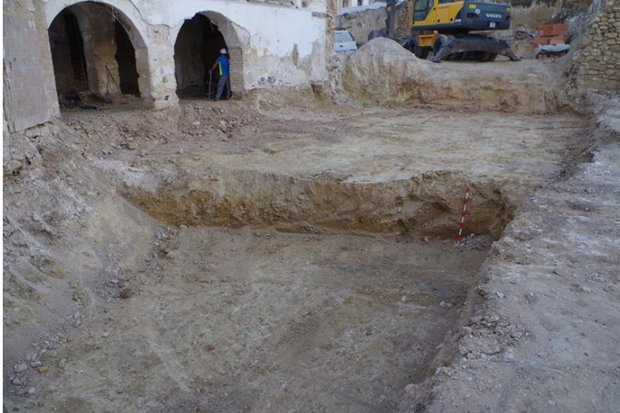
FIG. 3. REBAJE DEL TERRENO EN LA ZONA EL PATIO.

Tras retirar la capa superficial aparece directamente el nivel geológico, que está conformado por margas compactas de color amarillento.