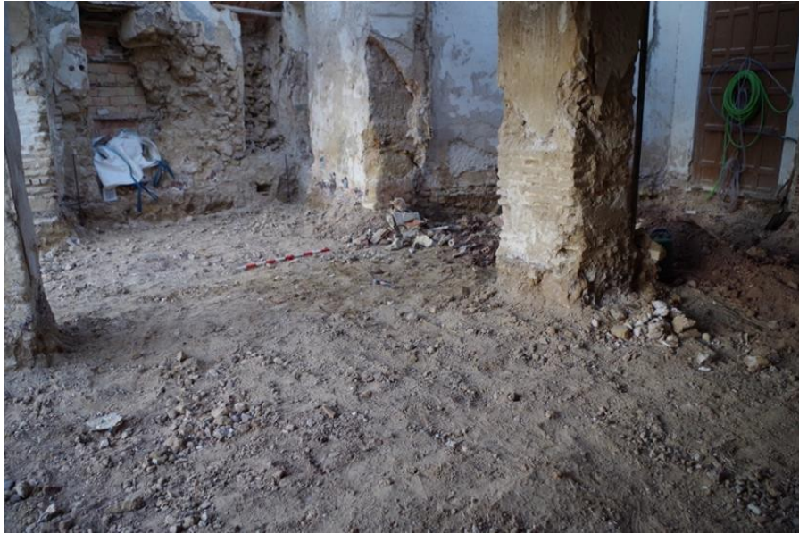
FIG. 2. REBAJE DEL TERRENO EN EL INTERIOR DEL INMUEBLE.

En la zona interior se procede al levantamiento del pavimento, así como al rebaje general de 0,40 m de potencia sobre el que se dispondrá la losa de hormigón armado. Lo retirado consiste en niveles de aterrazamiento para la disposición del pavimento. Los materiales muebles son de época contemporánea, por lo que no albergan interés arqueológico. En algunos puntos se deja ver ya el nivel geológico de base.