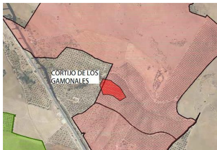
Fig.1. polígono del yacimiento Cortijo de los Gamonales.

Yacimiento Cortijo de los Gamonales. Zona de olivar elevada y próxima al Arroyo de las piedras con una acumulación de material constructivo romano, al igual que fragmentos de asas y de cerámica común. También por su entorno se documentaron fragmentos de sílex manipulados antrópicamente y cerámica bruñida.