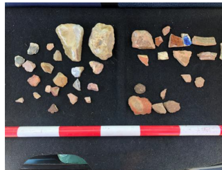
Fig.15. material documentado en el yac. Cortijo de los Cocos/Arroyo del Espinazo.