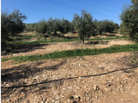
Fig.14. vista yac. Cortijo de los Cocos/Arroyo del Espinazo.