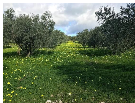
Fig.12. vista del yac. Cortijo las Pelonas.