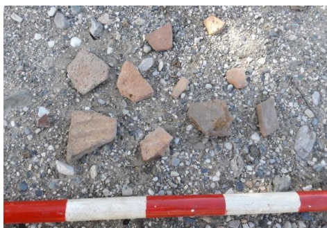
Fig.6. material documentado en el yac. Cortijo del Chopillo.

Yacimiento Loma de los Almendros. Yacimiento situado en la cima de una loma, catalogado con el nº95, se localizaron fragmentos de sílex y núcleos, pero muy escaso, con algún fragmento cerámico prehistórico.