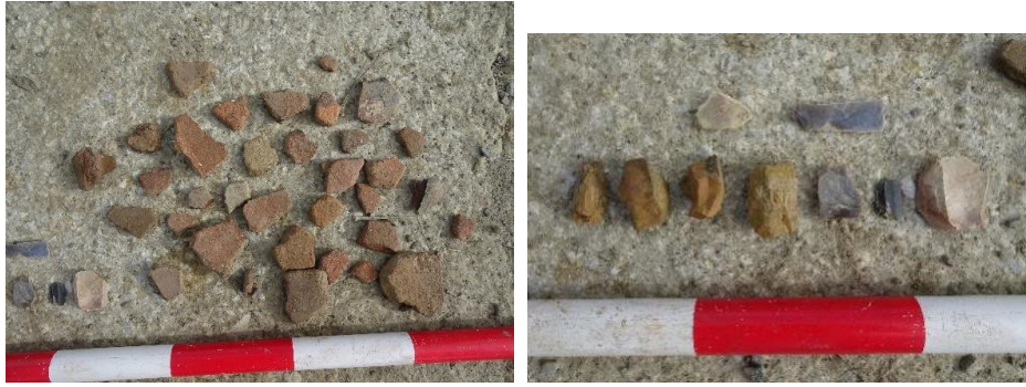
Fig.13. material documentado en el yac. Cortijo las Pelonas. Cerámica y herramientas neolíticas.