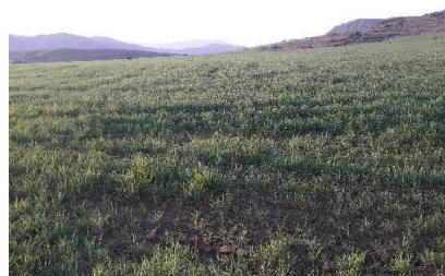
Fig.5. vista del yac. Cortijo del Chopillo.