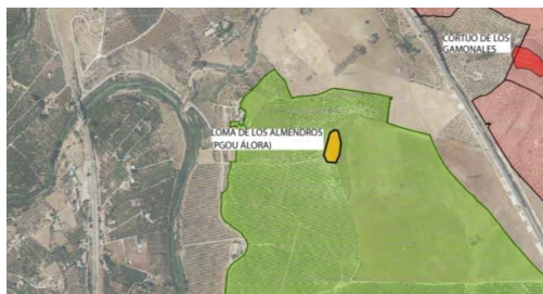
Fig.7. Polígono del yac. Loma de los Almendros.

Yacimiento Loma de los Almendros. Yacimiento situado en la cima de una loma, catalogado con el nº95, se localizaron fragmentos de sílex y núcleos, pero muy escaso, con algún fragmento cerámico prehistórico.