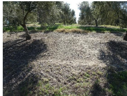
Fig. 2. Vista del yac. Cortijo de los Gamonales.