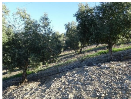
Fig.8. vista del yac. Loma de los Almendros.