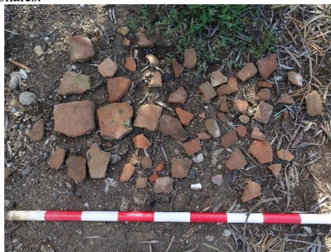
Fig.3. vista del material documentado en el yac. Cortijo de los Gamonales.