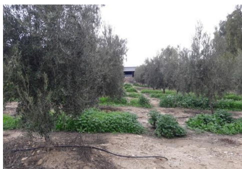
Fig.11. vista del yac. Loma de Morquecho.