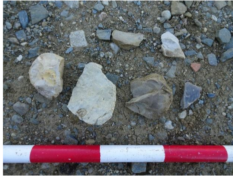
Fig.9. material documentado en el yac. Loma de los Almendros.

Yacimiento Cortijo de los Gamonales. Zona de olivar elevada y próxima al Arroyo de las piedras con una acumulación de material constructivo romano, al igual que fragmentos de asas y de cerámica común. También por su entorno se documentaron fragmentos de sílex manipulados antrópicamente y cerámica bruñida.