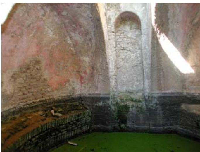
Lámina II. Vista interior de la noria.