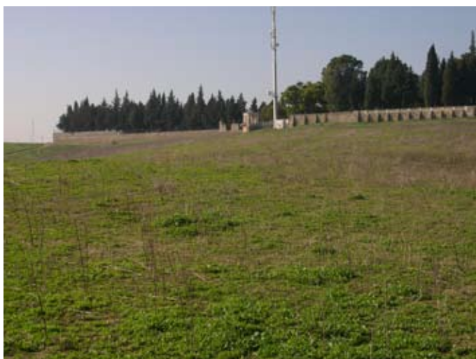
Lámina III. Jardines del Palacio de los Guzmanes.