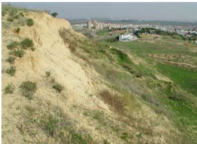
Lámina I. Escarpe con vistas a la cuenca del Guadalquivir.

A diferencia del Área 2, no hemos podido establecer una zonificación en base a la densidad de materiales en superficie, ya que la dispersión de los mismos es más o menos homogénea.