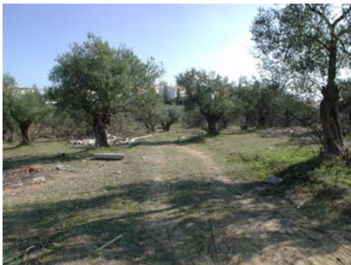
Lámina IV. Olivares junto a la carretera a Castilleja de la Cuesta.