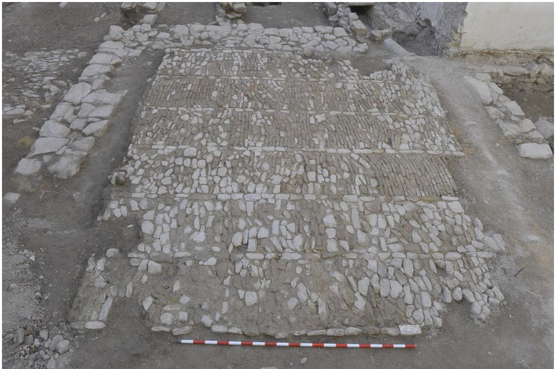
Fig. 03. Vista del pavimento empedrado E-10 en la zona de patios.