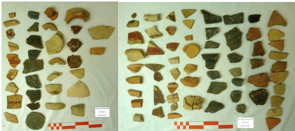
Fig. 12. Contextos cerámicos de la UEC-33.1 ( rudus o firme bajo losas de la calle E-33).