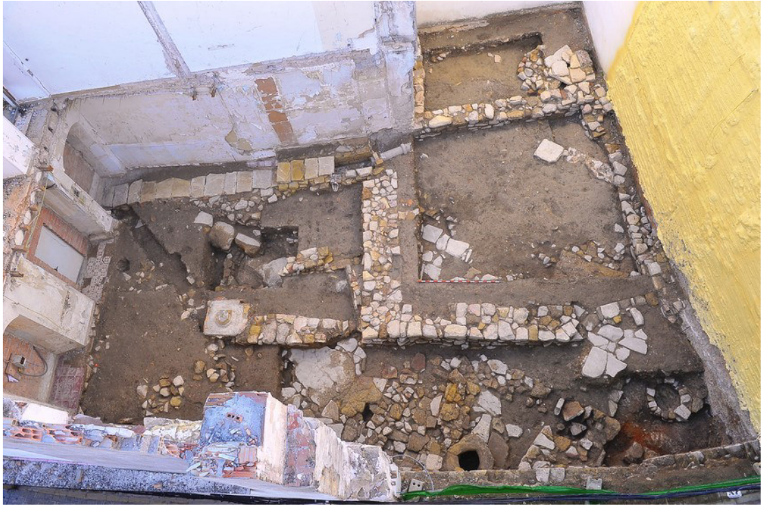
Fig. 09. Vista aérea final de la actividad o intervención. Sign. FD-2020-12-03-ND700-128. Año. 2020.