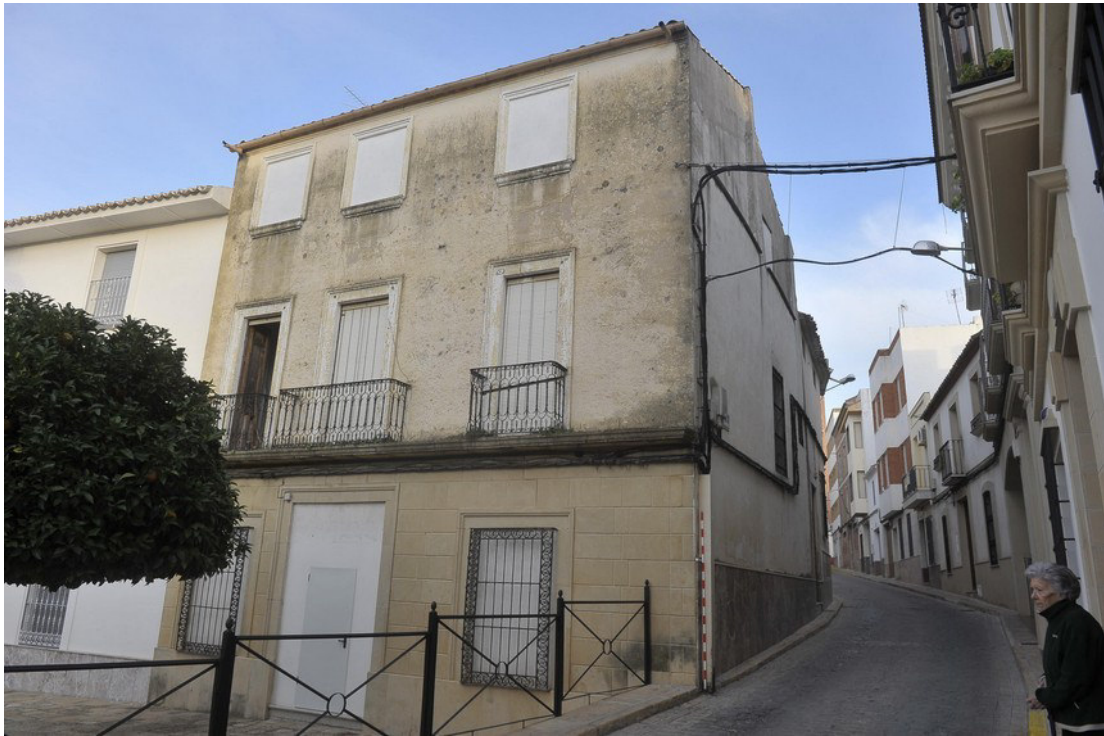
Fig. 01. Vista de la vivienda objeto de intervención.