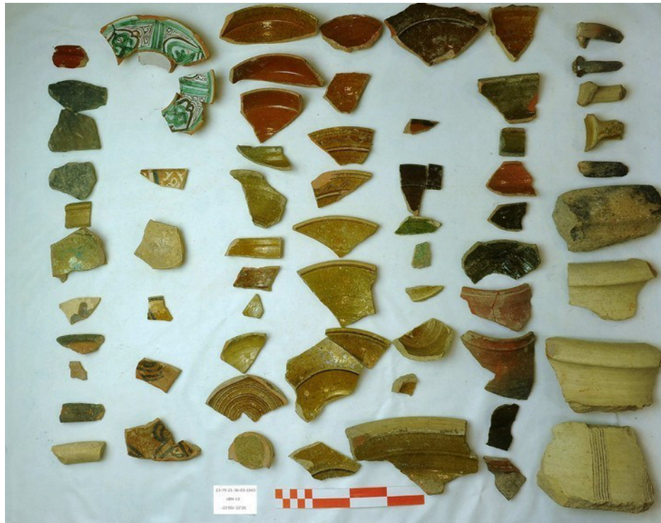
Fig. 11. Contexto cerámico de Época Bajomedieval a principios de la Edad Moderna de la UEN-13.