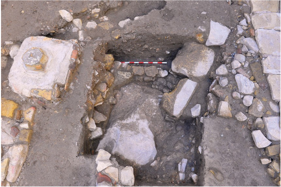
Fig. 07. Vista final de la ampliación del sondeo para el pilar central. Bajo el muro E-17B se documenta la estructura E-40B que delimita el pavimento E-28 por el sur.