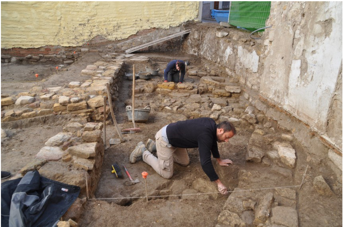
Fig. 08. Trabajos de excavación en el área sur de la parcela una vez retirados los pavimentos E-11 y E-20. Sign. FD-2020-12-30-IMSVSA-003. Año. 2020.