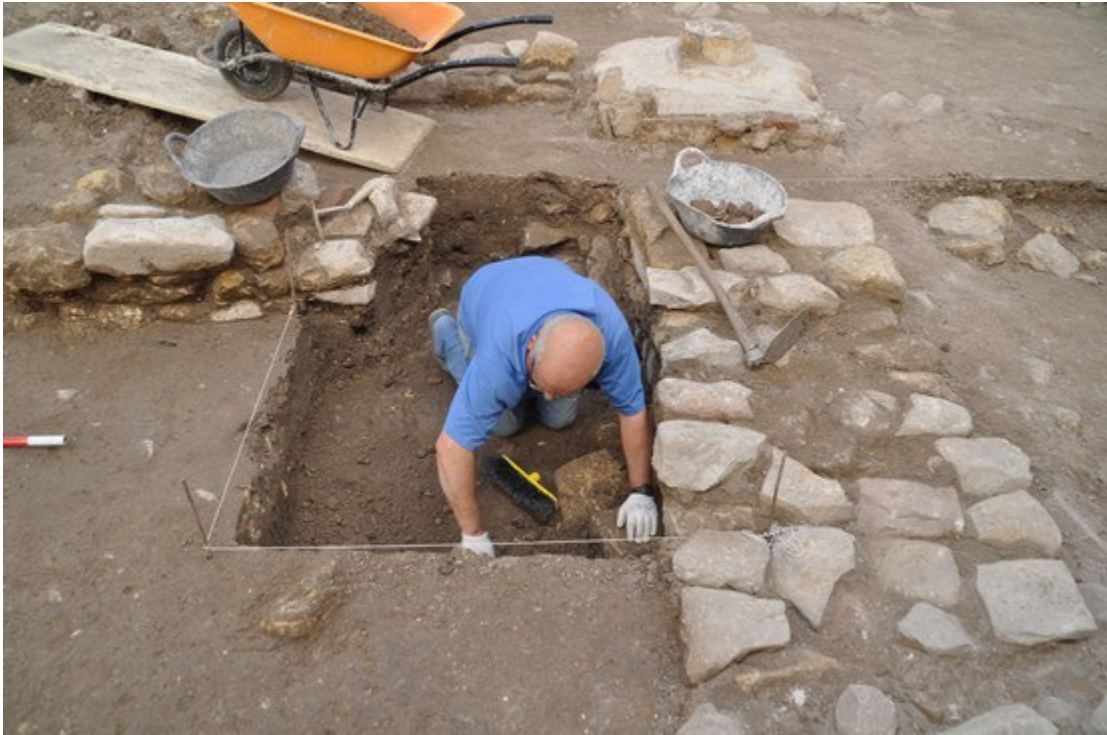
Fig. 05. Trabajos de excavación en el sondeo para la colocación del nuevo pilar central proyectado en el cuerpo delantero de la vivienda.

Fuente: Fototeca ARQVIPO. Sign. FD-2020-12-17 IMSVSA -015. Año. 2020.