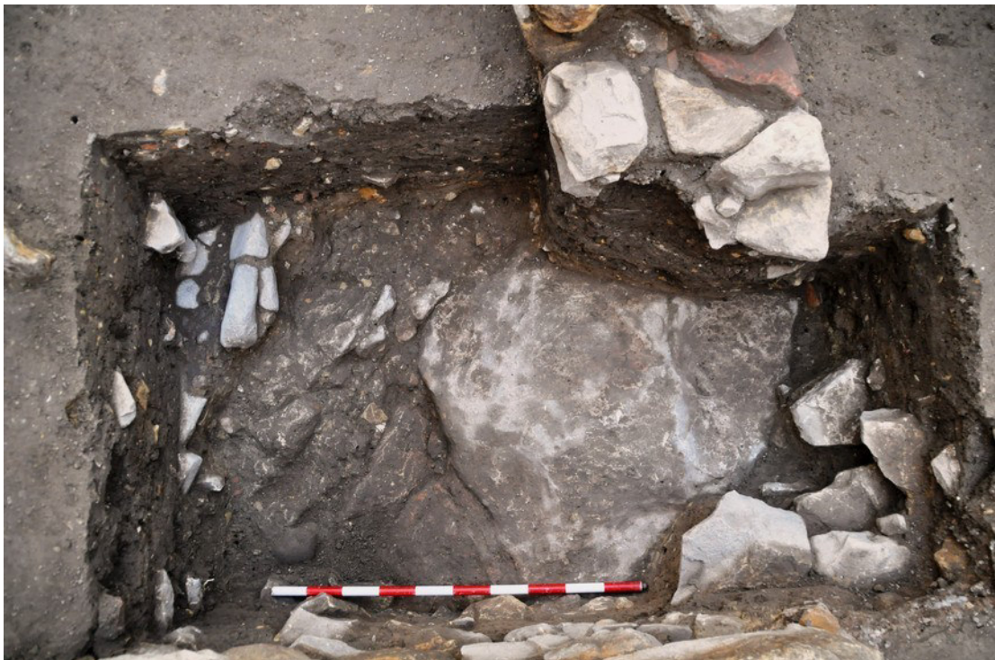
Fig. 06. Planta final del sondeo para el nuevo pilar central. Se ve la roca geológica y en el vértice superior izquierdo aparecen restos del pavimento E-28.

Fuente: Fototeca ARQVIPO. Sign. FD-2020-12-17 IMSVSA -015. Año. 2020.