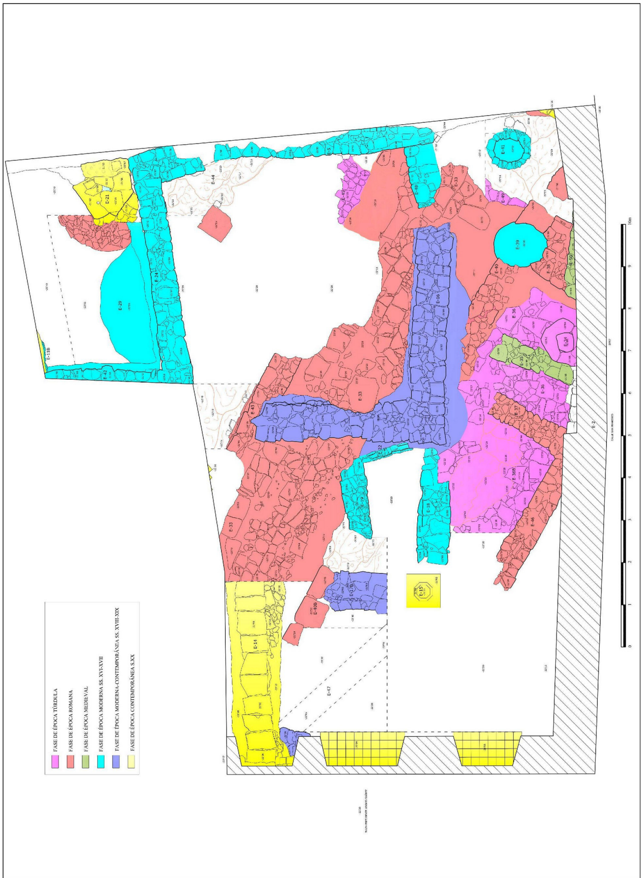
Lámina IV. Planta fases.