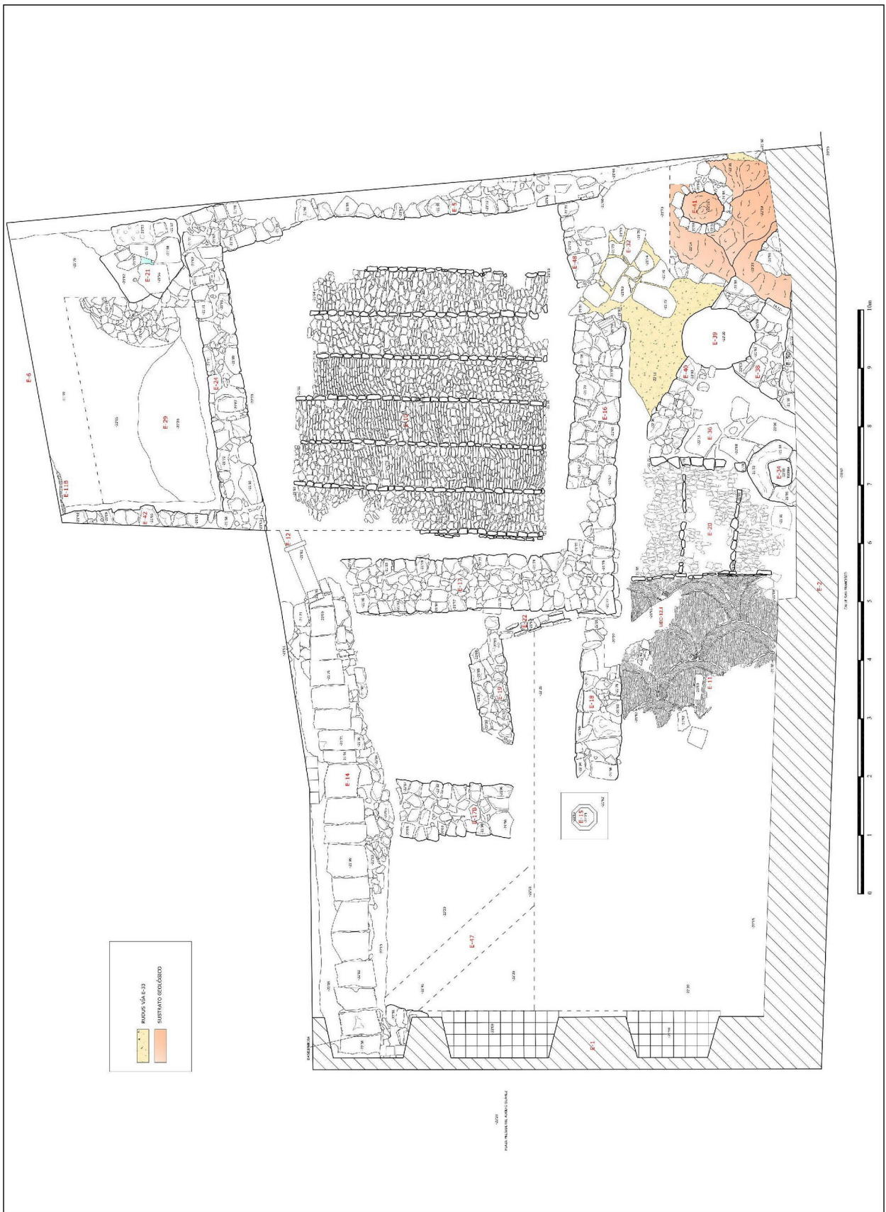
Lámina II. Planta I.