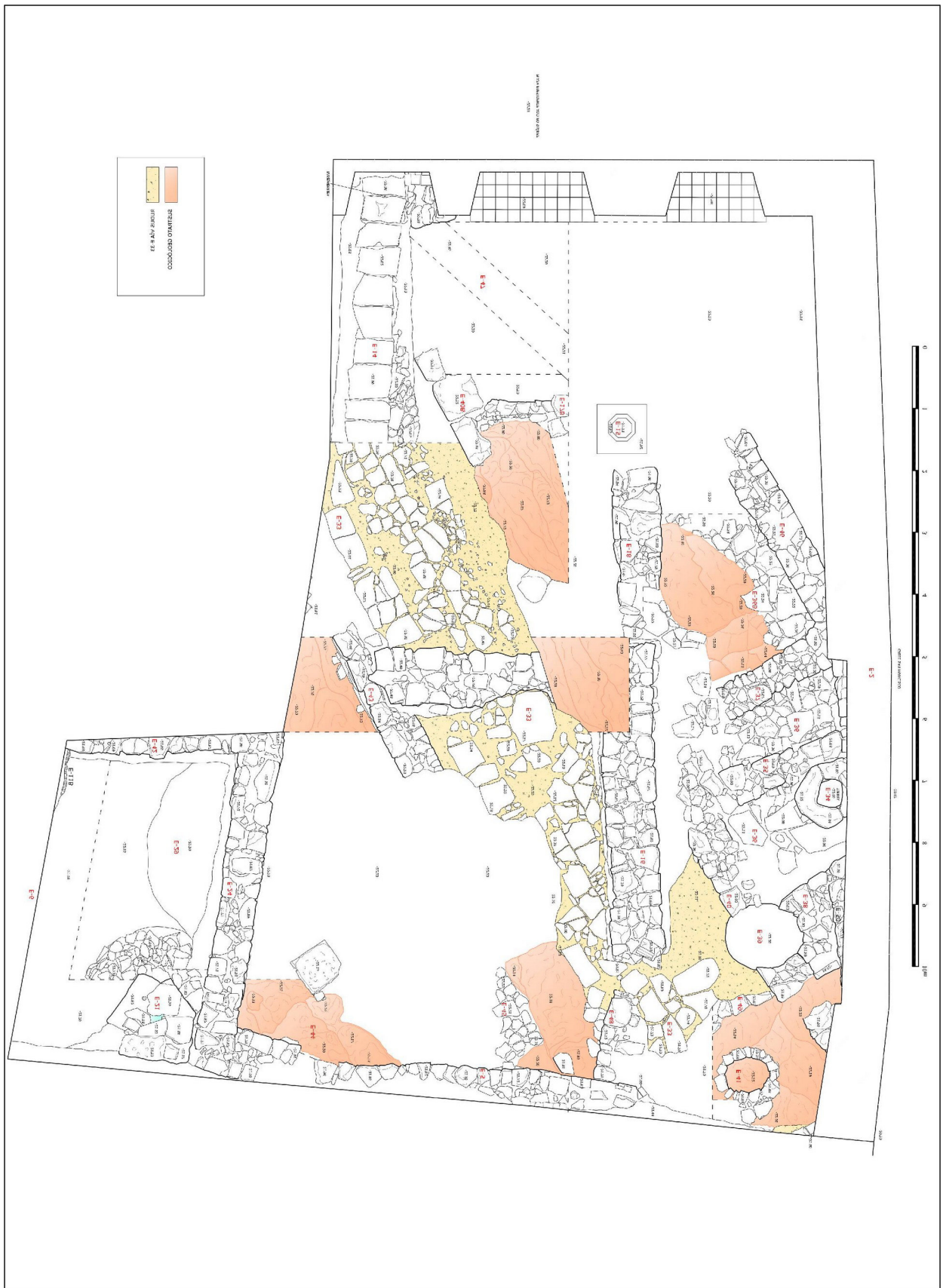
Lámina III. Planta final.