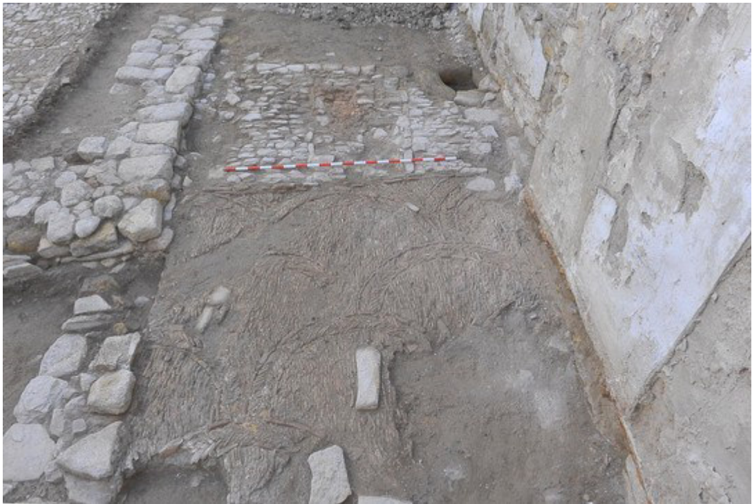
Fig. 04. Vista parcial del área sur de la parcela. Se observa el pavimento de tejas E-11 y el pavimento empedrado E-20 junto al pozo E-34.