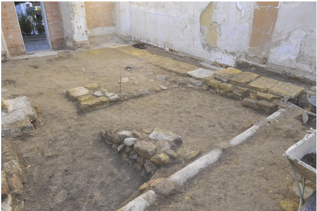
Fig. 02. Vista del cuerpo delantero de la vivienda en el inicio de la excavación.