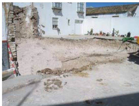
Lámina VIII. Vista general del solar finalizado el rebaje

Por último, tras un largo periodo de vacío ocupacional del solar, es a mediados del siglo XX cuando la parcela se urbaniza, configurándose el trazado actual de la calle Molinos, que por primera vez quedaría integrada plenamente en el entramado urbano de la ciudad, aunque ha permanecido como un área marginal hasta finales de la última década del siglo XX, momento en el que se inicia un importante crecimiento de la urbe, revalorizando esta zona, que pasa a convertirse en un lugar céntrico.