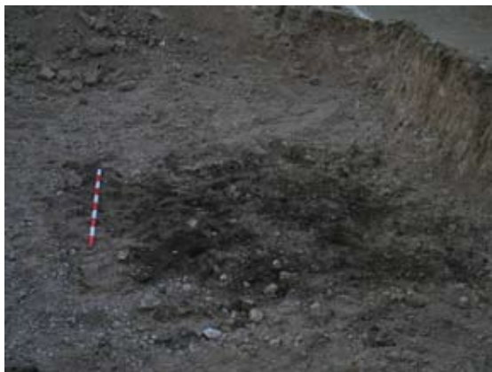
Lámina IV. Detalle de la fosa U. 4 y el relleno U.6

Unidad 4. Interficie o fosa excavada en el sustrato natural (U. 3), de un diámetro aproximado de 1.50 metros, y forma irregular aunque de tendencia circular. Se encontraba en la zona oeste, relativamente alejada de la fachada del inmueble, amortizada por la U.Estratigráfica 2 y colmatada por el relleno denominado U.6, que no contenía material cerámico alguno, por lo que para la datación de estas unidades se ha recurrido a la asimilación de la cronología aportada por las Unidades 5 y 7, con las que comparte claras semejanzas; de este modo, esta fosa se realizaría y colmataría a finales del siglo XIX o inicios del siglo XX, y aunque su función no está del todo clara parece corresponder a un pozo ciego o, más probablemente, a un alcorque o fosa donde se cultivó un frutal o vid. Su cota superior se documentó a -0.05 m., mientras que, al igual que en la unidad anterior, tampoco se pudo localizar su cota inferior, por encontrarse ésta por debajo de la cota de afección del rebaje de la obra.