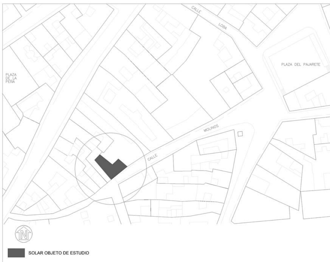
Figura 1. Ubicación del solar objeto de estudio en su entorno Urbano.

La parcela, ubicada en el nº 11 de la calle Molinos, de la localidad de Lebrija (Sevilla), contaba con una superficie total de 85,68 m 2 (Lámina III); presentando fachada a dicha calle. Se trata de una parcela sensiblemente llana, de forma irregular, con una fachada de 10,14 m. y presentando una profundidad máxima de 12,51 m. aproximadamente.