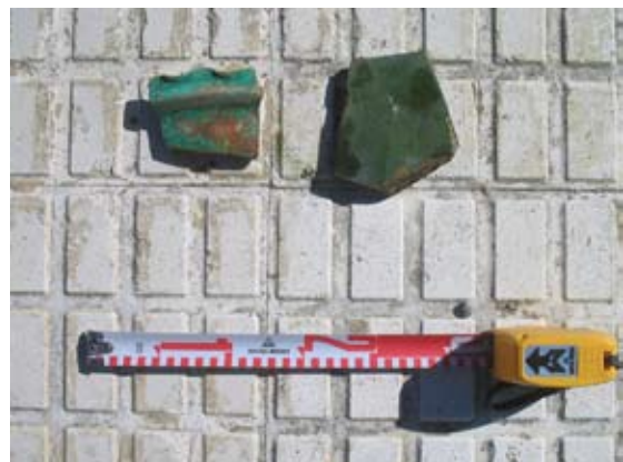
Lámina II. Materiales procedentes de U.2

La Unidad 2 corresponde a un relleno de tierra (Unidad Estratigráfica) caracterizado por tener una textura arenosa y suelta, y un color gris oscuro, que se localizó sólo en un extremo de la parcela, pero que debió de extenderse a todo lo largo y ancho del solar; se encontraba entre las cotas +0.10 m. de máxima y -0.02/-0.05 m. de cota inferior. Su ubicación estratigráfica queda definida al encontrarse depositado bajo la Unidad 1, y amortizando a su vez a las Unidades 3, 4, 5, 6, y 7. Los materiales hallados en esta Unidad Estratigráfica son escasos pero concluyentes a la hora de fijar una cronología, que no se remonta más allá de la segunda mitad del siglo XX, tal y como se puede observar en la fotografía abajo expuesta.