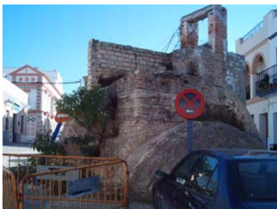
Lámina VII. Noria-Pozo de calle Eduardo Dato