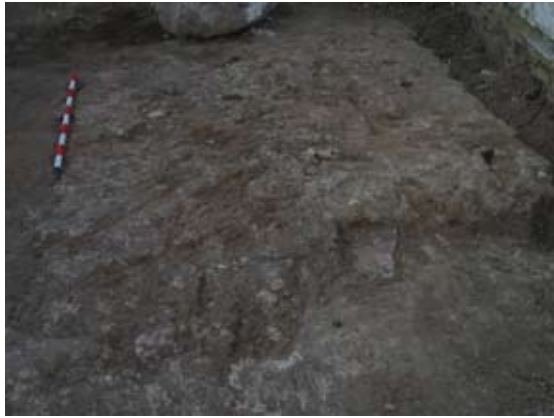
Lámina III. Detalle de la superficie del terreno natural (U.3)

Unidad 4. Interficie o fosa excavada en el sustrato natural (U. 3), de un diámetro aproximado de 1.50 metros, y forma irregular aunque de tendencia circular. Se encontraba en la zona oeste, relativamente alejada de la fachada del inmueble, amortizada por la U.Estratigráfica 2 y colmatada por el relleno denominado U.6, que no contenía material cerámico alguno, por lo que para la datación de estas unidades se ha recurrido a la asimilación de la cronología aportada por las Unidades 5 y 7, con las que comparte claras semejanzas; de este modo, esta fosa se realizaría y colmataría a finales del siglo XIX o inicios del siglo XX, y aunque su función no está del todo clara parece corresponder a un pozo ciego o, más probablemente, a un alcorque o fosa donde se cultivó un frutal o vid. Su cota superior se documentó a -0.05 m., mientras que, al igual que en la unidad anterior, tampoco se pudo localizar su cota inferior, por encontrarse ésta por debajo de la cota de afección del rebaje de la obra.