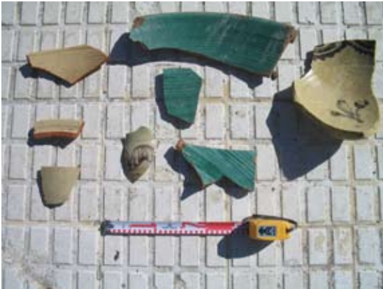
Lámina VI. Materiales cerámicos procedentes de U.7

En definitiva, durante los trabajos de vigilancia arqueológica llevados a cabo en esta parcela, y a pesar de lo limitado del rebaje (70 cm.), hemos podido documentar los estratos arqueológicamente estériles (U.3), que aparecen a cotas muy elevadas, casi aflorando a la superficie, por lo que son escasos los rellenos de tierra antropizados depositados sobre el firme (U.3); esto nos hace pensar que esta zona, contrariamente a lo que sucede en otros lugares de la ciudad como en las calles Corredera, Andrés Sánchez de Alva o Tetuán, no fue ocupada de forma permanente o continua hasta momentos muy recientes (segunda mitad del siglo XX), como así lo muestran los materiales hallados en las Unidades Estratigráficas 2 y 7, cuyas cerámicas aportan una cronología que no se remonta más allá de principios del siglo XX.