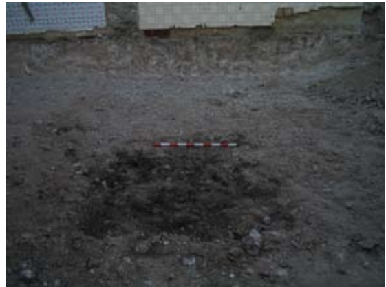
Lámina V. Detalle de la fosa U. 5

a algún molino u otra explotación agropecuaria. Su cota superior relativa se documentó a -0.02 m., no pudiéndose localizar su cota inferior.