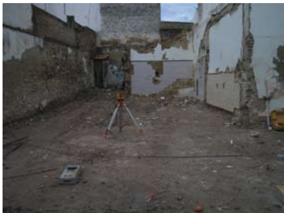
Lámina I. Parcela antes del inicio del rebaje

Así, se procedió a un desmonte controlado del terreno de la parcela objeto de estudio, empleándose medios mecánicos para la eliminación progresiva de los diferentes rellenos y estructuras, que fueron convenientemente documentados y que han aportado una secuencia estratigráfica muy pobre.