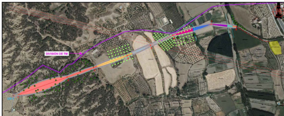
Figura 1. Emplazamiento de la línea eléctrica.

La longitud de la línea es de 1,17 km (1011 m tramo aéreo y 158 m en tramo subterráneo).