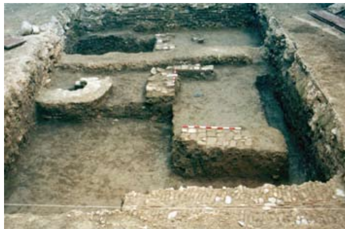
Lámina IV. Vista general del sondeo con las estructuras de la fase moderna

oscila entre -0'34 / -0'28 m. para la uc.29 y -0'20 / -0'26 m. para la uc. 49.