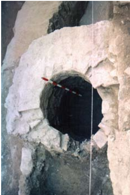
Lámina VIII. Vista del pozo uc. 43.

dispuestos planos tendentes a tizón. Presenta unas dimensiones de 1'80 m. de diámetro exterior y una altura de + 1'60 m. Tanto el coronamiento como el exterior del pozo presentan un recubrimiento de mortero hidráulico.