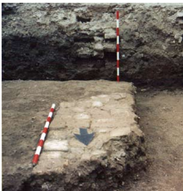
Lámina VI. Vista de detalle del muro uc. 13/31.

- Uc. 13 (Lámina VI): Muro localizado y reflejado en el perfil meridional del sondeo, con un desarrollo transversal a éste y una orientación N – 18° - E, configurándose como el límite oriental de la pavimentación uc. 9 a la que se adosa. Presenta un aparejo de ladrillos dispuestos planos en hiladas a soga, con unas dimensiones 0'50 m. de anchura y 0'53 m. de altura, trabada con un mortero de arena que rellena llagas de 0'02 m. entre hiladas y de 0'015 / 0'02 m. entre ladrillos, con un arranque de siete hiladas.