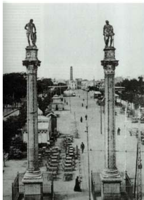
Lámina I. Vista costumbrista de la Alameda de Hércules

En estos momentos se va a llevar a cabo otro hecho significativo en nuestro sector, que también va a incidir en la configuración urbanística de la zona. Se trata de la urbanización de la Alameda en 1574 a manos del primer Conde de Barajas (Lámina I). El sector ocupado por la actual Alameda se correspondía en épocas pasadas con un antiguo brazo del río Guadalquivir.