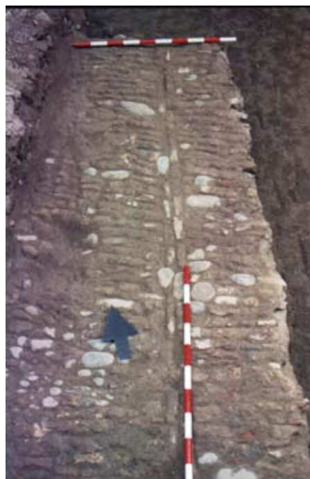
Lámina V. Vista de detalle del pavimento uc. 9

La mitad occidental del sondeo presenta una serie de alineaciones y pavimentaciones que articulan un espacio de marcado carácter abierto, ya que las pavimentaciones documentadas poseen todas las características físicas que envuelven a los patios: aparejo de ladrillos y cantos rodados dispuestos de canto a soga o a tizón conformando un empedrado y buzamiento acusado de la pavimentación hacia los pozos de saneamiento localizados en el perfil septentrional. La cota de implantación de esta fase se establece sobre las pavimentaciones formando un horizonte de ocupación que oscila entre los -0'25 y -0'60 m.