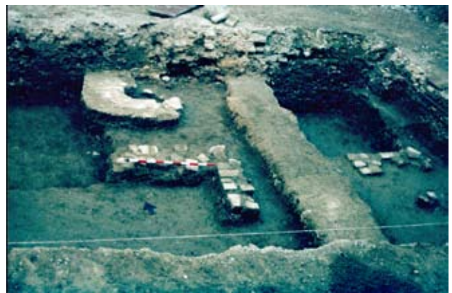
Lámina IX. Vista general del sector oriental del sondeo.

En este apartado desarrollaremos las unidades constructivas con sus rellenos deposicionales asociados que configuran el ámbito habitacional localizado en el sondeo estratigráfico. Esta fase constructiva posee una cota de implantación que oscila entre -0'38 7 -0'28 m. de la uc. 29 y -0'20 / 0'26 m. de la uc. 49.