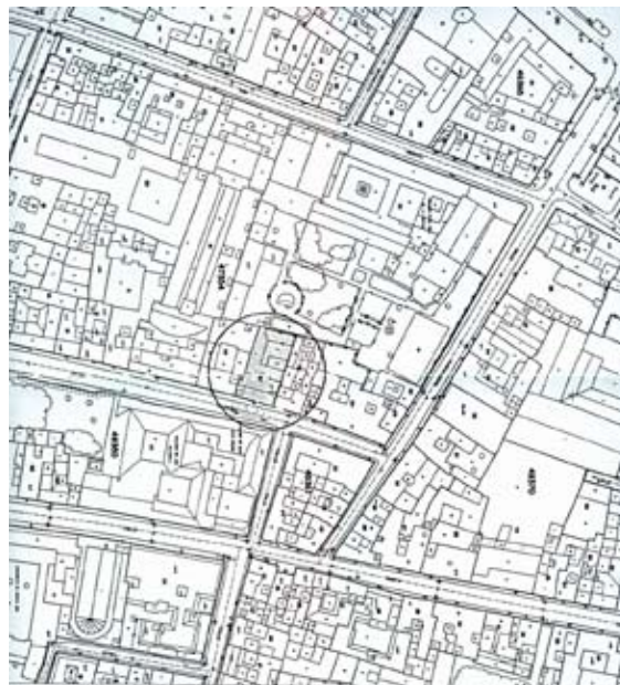
Figura 1. Plano de situación del solar nº. 89 de la calle Teodosio en el parcelario actual.

En la aplicación de la Normativa del Protección del Patrimonio Arqueológico, basada en el Catálogo de Protección del sector 9 del Conjunto Histórico: "San Lorenzo – San Vicente" , la parcela objeto de estudio presentaba cautela arqueológica de protección II a nivel subyacente, la cual implicaba la realización de sondeos arqueológicos sobre una superficie de entre 51 – 75 m 2 . Se llevó a cabo un área de intervención de 63'25 m 2 , donde debía alcanzarse la profundidad máxima proyectada para el sótano (-2'98 m.) establecida a partir de la cota del actual acerado de la calle Teodosio.