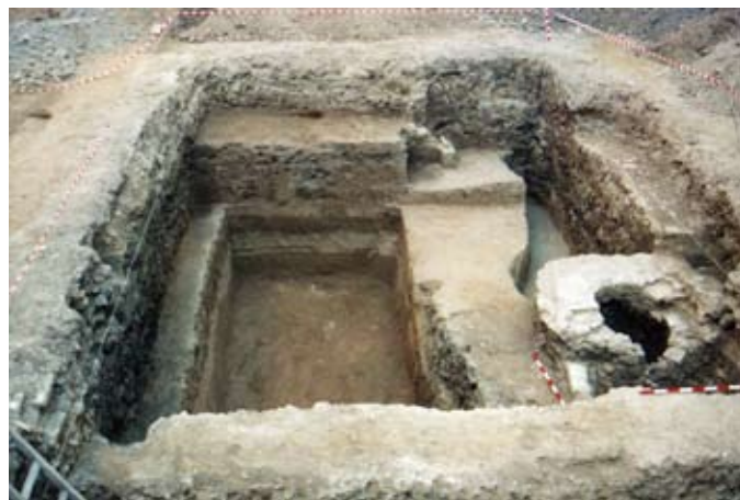
Lámina II. Vista general del sondeo estratigráfico

En base a las disposiciones establecidas se propuso la ubicación de un sondeo estratigráfico de carácter central, con unas dimensiones de 9'5 x 6 m., situado a 3 m. de las medianeras septentrional y meridional, a 2'5 m. de la occidental y a 7 m. de la calle Teodosio, junto a dos catas perimetrales, una en el sector oriental del sondeo con unas dimensiones de 5'50 m. de longitud y una anchura de 1'10 m., y la segunda en el perfil septentrional con unas dimensiones de 5'50 m de longitud y una anchura de 0'90 m. De esta manera el área de actuación cubría una superficie de 63'25 m 2 (Lámina II). La intervención debía llevarse a cabo con medios estrictamente manuales hasta la cota de afección (-2'98 m.), exigiéndose igualmente que debía agotarse el registro arqueológico en algún punto del solar, independientemente de las cotas de rebaje que ofreciesen las obras de nueva edificación, a fin de la evaluación de la totalidad estratigráfica; objetivo conseguido al producirse la aparición de los limos fluviales vírgenes (ud. 81) antes de llegar a la cota de afección de la edificación de nueva planta. La intervención arqueológica comenzó el 28 de Marzo de 2005, finalizando el 28 de Abril de 2005 y habiendo conseguido los objetivos establecidos en el Proyecto de Intervención.