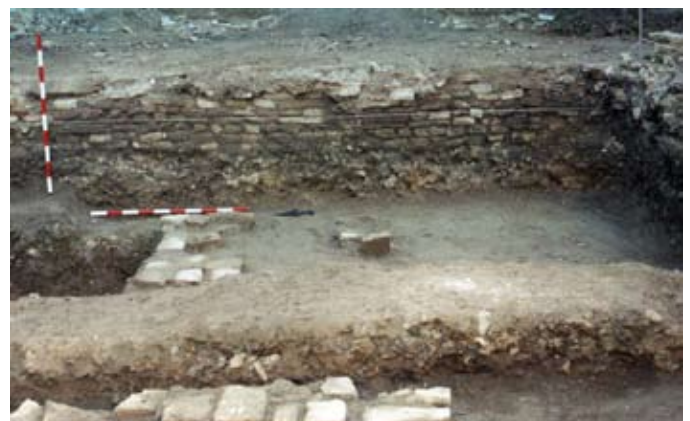
Lámina X. Vista general del muro uc. 37.