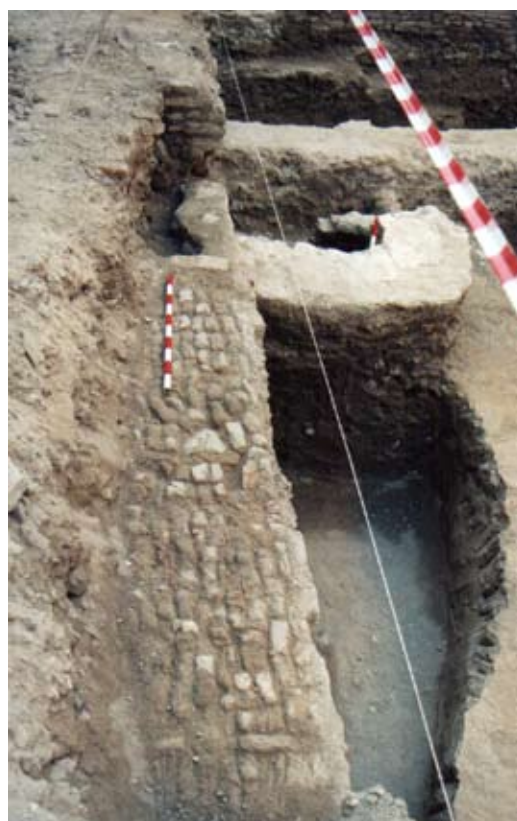
Lámina VII. Vista del pavimento uc. 72.

- Uc. 72 (Lámina VII): Pavimentación de ladrillos localizada en el sector septentrional del sondeo, excavada en planta en la cata de ampliación que se realiza en este sector, realizada con ladrillos y algunos cantos rodados (guijarros) dispuestos de canto tendentes a tizón. Presenta una guía central que se desarrolla transversalmente al sondeo (dirección N – S) de un módulo de anchura dispuesto de canto a tizón. Presenta unas dimensiones conservadas de 3'60 m. de longitud y una anchura excavada de 0'90 m.