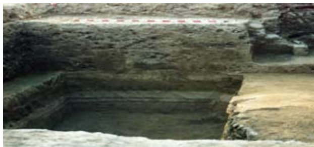
Lámina XI. Vista general del perfil occidental.

En primer lugar, debemos señalar la rápida aparición de los limos fluviales (ud. 81), con una cota de implantación en su parte más alta de -1'06 m., y que oscila entre esto y -1'24 m. para su techo. La ubicación topográfica del solar con respecto al río, así como su evolución histórica han condicionado su potencialidad arqueológica y estratigráfica (Lámina XI).