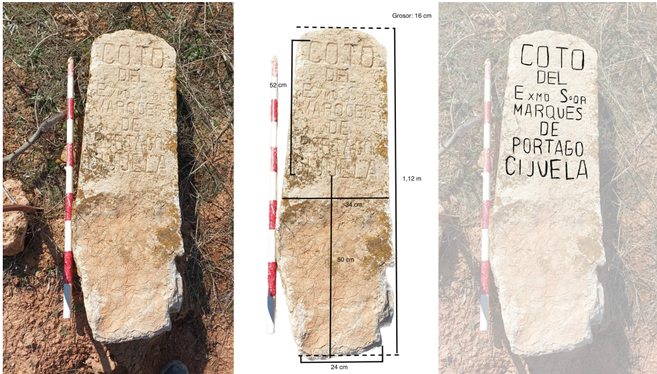
Lámina 12: Hito de señalización en piedra. Vista frontal, dimensiones y texto epigráfico.