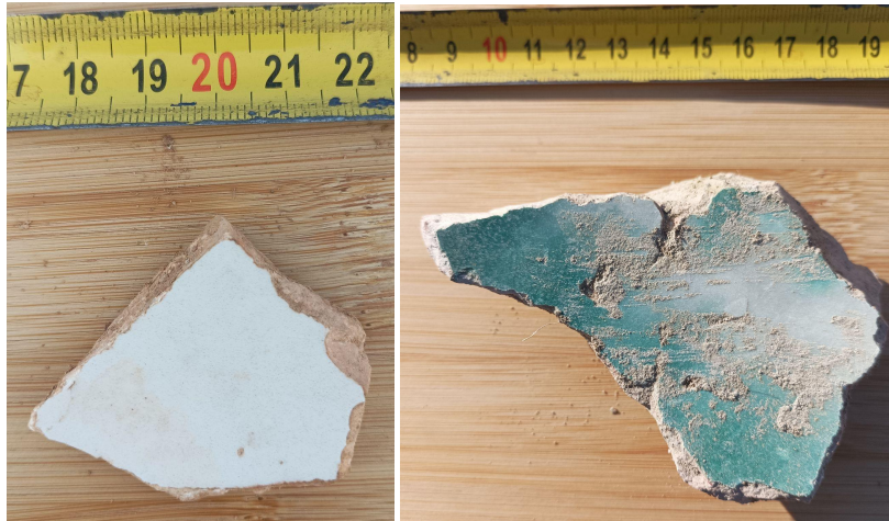
Láminas 8 y 9: Fragmentos cerámicos documentados (nº 4 y nº 5)

En una zona limítrofe al área de este proyecto, en Cijuela, se halló, volcado en el suelo, un hito de piedra de señalización de una zona de coto privado, la cual poseía una inscripción en la que se indicaba el nombre del propietario y el municipio al que pertenecía.