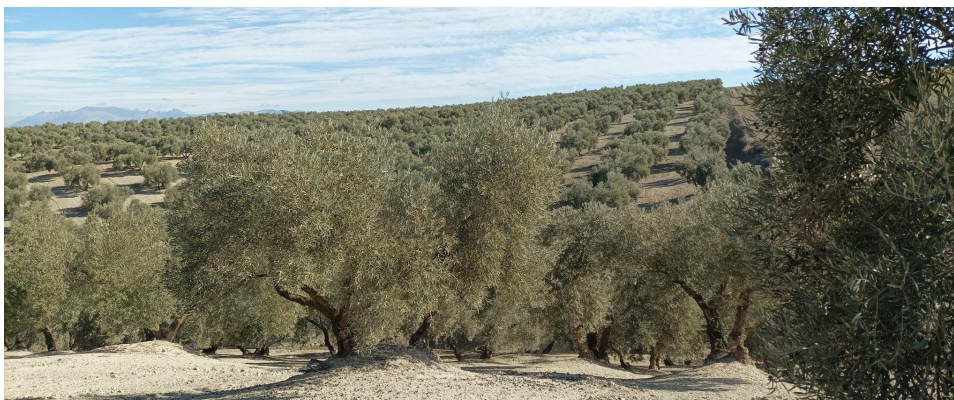
Lámina 2: Parcelas cultivadas de olivos

Otras parcelas se hallaban cultivadas de olivos, por lo que los recorridos se llevaron a cabo a lo largo de los pasillos existentes entre los árboles.