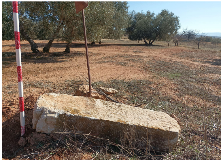
Lámina 10: Hito de piedra volcado en el suelo, junto a la placa actual de coto

En una zona limítrofe al área de este proyecto, en Cijuela, se halló, volcado en el suelo, un hito de piedra de señalización de una zona de coto privado, la cual poseía una inscripción en la que se indicaba el nombre del propietario y el municipio al que pertenecía.