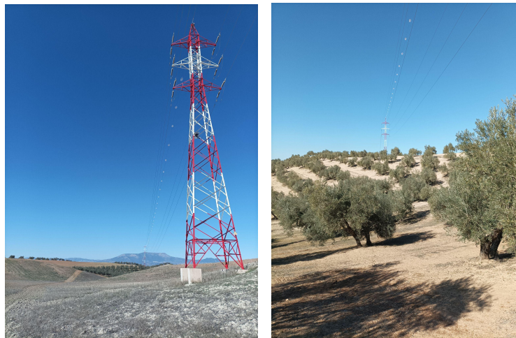
Láminas 3 y 4: Vistas hacia el noroeste de diferentes zonas del trazado por donde discurrirá la línea, en paralelo con la actual.

Como ya se indicaba con anterioridad, el trazado de la línea eléctrica discurre en su mayor parte junto a la ya existente, salvo en su tramo final, en Láchar, que será de nueva instalación.