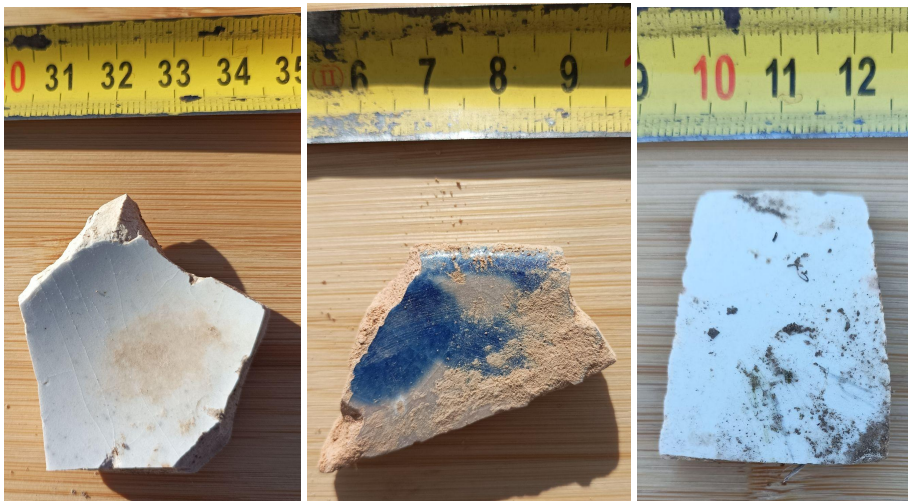
Láminas 5, 6 y 7: Fragmentos cerámicos documentados (nº 1- nº 3)

El escaso conjunto de material cerámico hallado en toda la prospección fue documentado fotográficamente, in situ , y georreferenciado. En concreto, corresponden a producciones en porcelana blanca (nº 1 y 3) y loza blanca (nº 4), y de tipo granadino o Fajalauza, en azul (cerámica de mesa) (nº 2) y verde (pertenece posiblemente a un lebrillo) (nº 5).