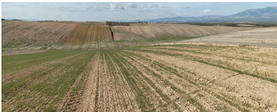
Lámina 1: Parcelas cultivadas de cereal (bajo crecimiento)

Otras parcelas se hallaban cultivadas de olivos, por lo que los recorridos se llevaron a cabo a lo largo de los pasillos existentes entre los árboles.