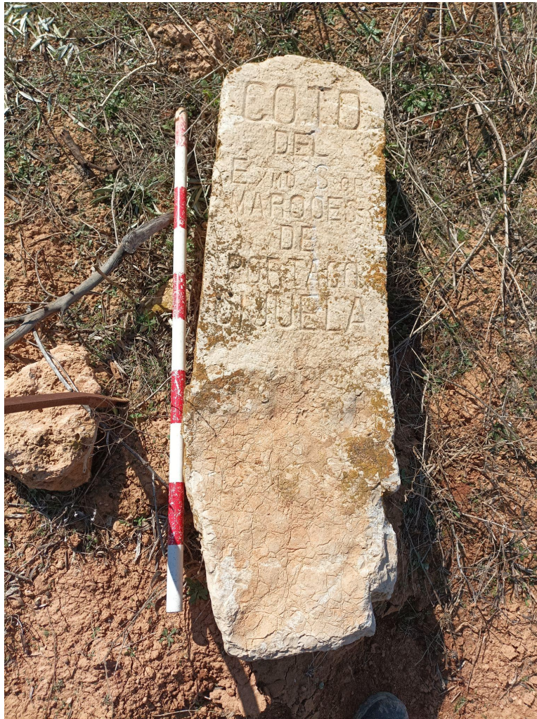
Lámina 11: Texto epigráfico del hito de piedra

Se trata de un bloque rectangular de piedra caliza, de 112 cm de longitud, 24 cm de anchura y 16 cm de grosor. La parte inferior, que sería la que estaría hincada en el suelo y, por tanto, soterrada, tiene los laterales más estrechos y recortados en forma de punta, para favorecer su colocación bajo tierra. La pieza se encuentra en bastante buen estado de conservación, si bien se observan colonias de líquenes en algunas zonas.