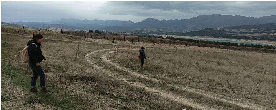
Lámina 1: Parcela sin cultivar

La mayor parte de las áreas prospectadas estaban cultivadas, si bien la vegetación presentaba un corto crecimiento por lo que el terreno era visible, permitiendo ello su correcto escrutinio. Así pues, esta época del año (invierno) resulta óptima para el desarrollo de este tipo de trabajos en zonas cultivadas de cereal, como las del presente proyecto.