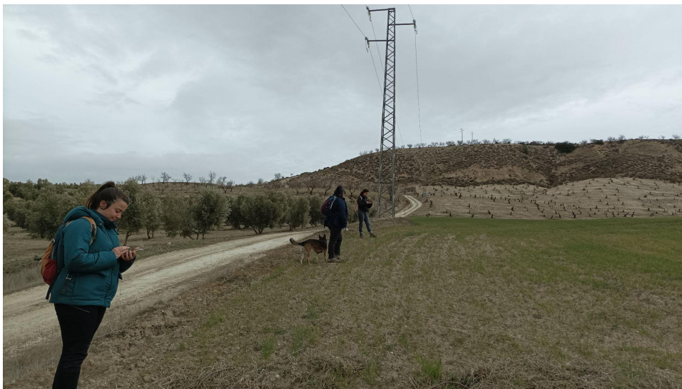
Lámina 2: Parcelas cultivadas (con bajo crecimiento)