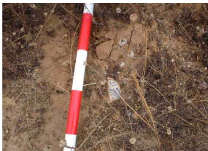
Lámina I. Material moderno.

1º. Materiales contemporáneos y modernos : pequeños fragmentos de loza azul sobre blanco, datables a finales del siglo XIX y comienzos del XX; algunos restos amorfos de melados y vajilla de cocina basta, datados en el XVI-XVIII muy diseminados en general y que entendemos producto de acarreo y paso por el lugar en estas épocas. Este primer grupo se detecta en los sectores 44, 45, 46, 52, 58, 59 y 60. Esto es, en su mayoría junto al Camino de la Dehesa, en la zona noroeste de la parcela.