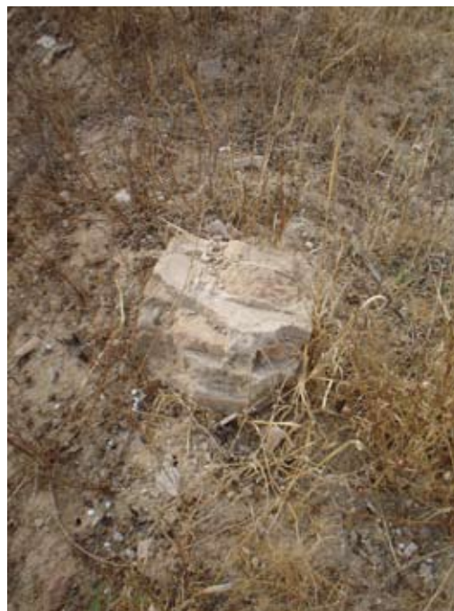
Lámina IV. Resto de tapia contemporánea.

No obstante lo dicho solo es en la zona Norte sectores 57 y 62 donde aparecen restos de una tapia contemporánea que posiblemente delimitara y cerrara la finca en la segunda mitad del siglo XX, hoy totalmente destruida. Estos restos son también apreciable en la fotografía área de satélite. Paralelos a estos restos datamos las terreras y escombreras, ya que el material que aparece es idéntico al de los restos de la susodicha tapia, además de recibir componentes de limpieza del sector Norte de la finca.