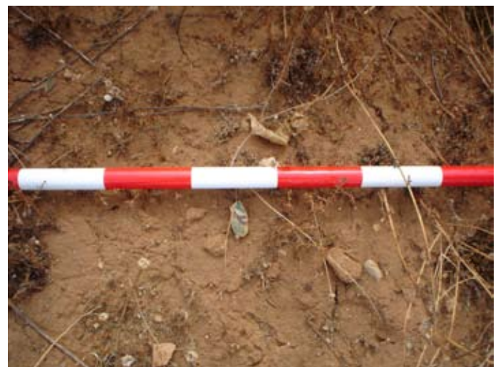
Lámina II. Material medieval.

2º Materiales de origen medieval : Fragmentos muy pequeños y rodados, amorfos de vajilla de cocina de carácter usual, algún melado y que resultan de muy complicada datación, aunque nos inclinamos a una temporalidad cristiana, esto es siglos XIII al XV. La mínima entidad de estos restos y su distribución espacial en los sectores 59, 60, 61, 62, 52, 53, 54, 55, 56, 40, 41, 28, 19 y 20, con una distribución claramente mayor hacia los sectores situados en el norte y una dinámica descendente de aparición cuanto más al sur nos encontramos, nos obligan a entender en un proceso de ocupación radial del espacio, con respecto al núcleo urbano situado al norte.