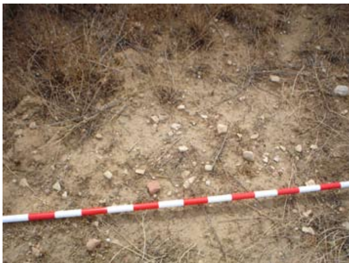
Lámina III. Material Romano.

Algo más destacado parece la proliferación de estos materiales, sin llegar a tener entidad arqueológica, en una pequeña extensión de los sectores 54 y 55. Aunque no se aprecia una magnitud interesante para con posibles elementos soterrados, ya que estos se entienden más como producto de actividad agraria que de ocupación efectiva del espacio.