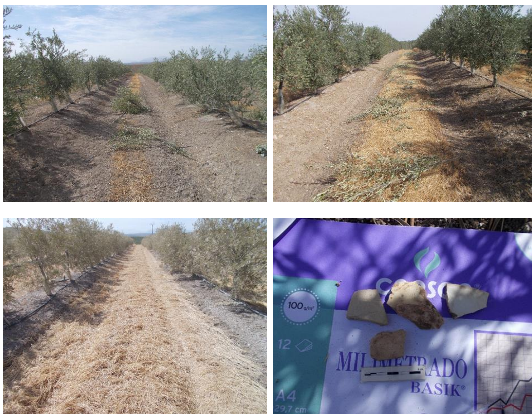
Láms. VI, VII, VIII, IX. Vista de las camadas por donde discurren las bandas de prospección y muestra del escaso material hallado en ellas.

Las camadas situadas en el extremo Este de la finca, en la zona más cercana a las instalaciones de la planta de valorización de residuos, están atravesadas en su tercio central por una franja de terreno sin cultivar que separa el vallado de las balsas de las citadas instalaciones situadas al este y el olivar, presentando una superficie prácticamente limpia de vegetación, siendo la visibilidad del suelo muy buena. Sin embargo, en este espacio no se ha detectado ningún tipo de restos.