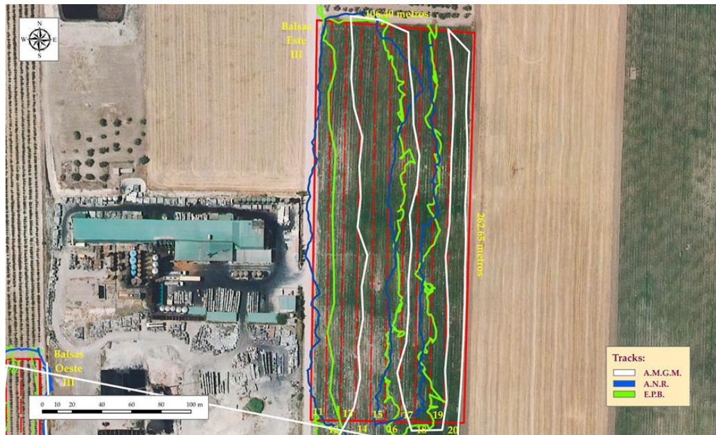
Fig. 4. Recorridos realizados por los prospectores en las “Balsas Oeste III” ( tracks ).

Además, para elaborar la planimetría hemos creado un Sistema de Información Geográfica (S.I.G.) específico mediante el programa de ESRI ArcGIS 10.5, empleando para ello cartografía específica del Centro Nacional de Información Geográfica, del Instituto Geográfico Nacional (Ministerio de Fomento), georreferenciada con el datum “ETRS 89”, Huso 30 N, disponible en el “Centro de Descargas” del CNIG y la “Fototeca Digital” de la Junta de Andalucía.