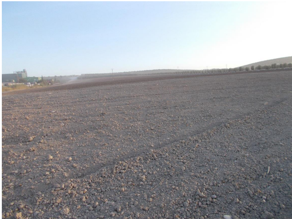
Lám. I. Vista general de los terrenos donde irá el Grupo de Balsas Este III.

Por lo que respecta a la prospección de los terrenos donde irá ubicado el Grupo de Balsas Este III , las bandas de prospección estaban numeradas desde la nº 11 a la 20, y las batidas se hicieron siguiendo las bandas longitudinales ya planteadas en el Proyecto Arqueológico, teniendo una anchura de unos 10m y siguiendo una orientación norte-sur, de manera que se abarcase mayor cantidad de superficie.