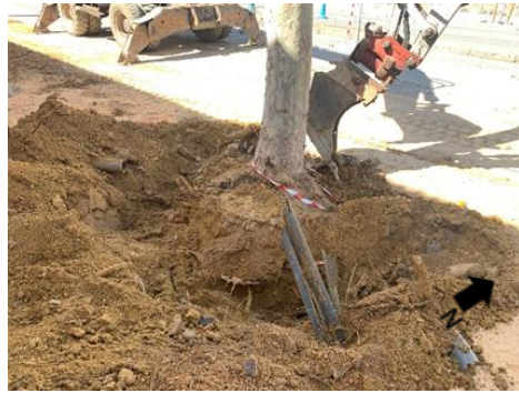
Lámina 3 Detalle extracción arboleda