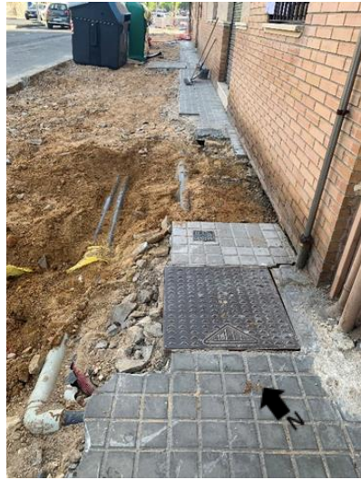
Lámina 5 Red suministro de gas y agua