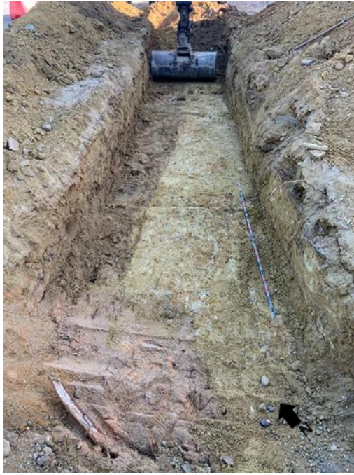
Lámina 6 Zanja UE 22 y Nivel geológico UE 15