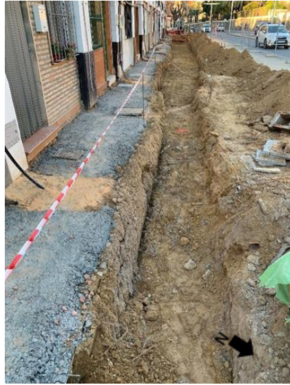
Lámina 4 Detalle apertura nuevas arquetas y zanja principal