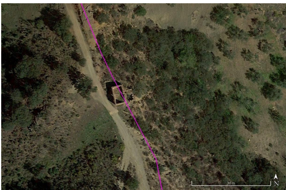
Localización del Elemento Etnográfico E.E 03

Se trata de una pequeña construcción de uso agrícola ganadero, ubicada junto a un camino rural. La edificación tiene una estancia de planta rectangular y, adosada a ésta otra pequeña estancia que apoya en la ladera, posiblemente un corral. La cubierta no se conserva, aunque parece ser de tejas curvas a un agua. La fábrica de los muros es de piedra seca, trabando los mampuestos más grandes con otros de menor tamaño. Presenta restos de revoco de mortero de cal.