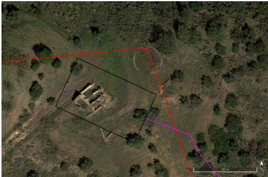
Localización del Elemento Etnográfico E.E

Se trata de una construcción de uso agrícola ganadero, presenta una pequeña estancia al frente y tres corrales en paralelo en la parte trasera. Sólo se conservan parcialmente los muros, la cubierta a dos aguas, con vigas de madera y tejas curvas se ha vencido. La fábrica de los muros es de piedra seca, trabando los mampuestos más grandes con otros de menor tamaño. Presenta revoco de mortero de cal. Asociada a la edificación se encuentra una era circular completamente cubierta de vegetación.