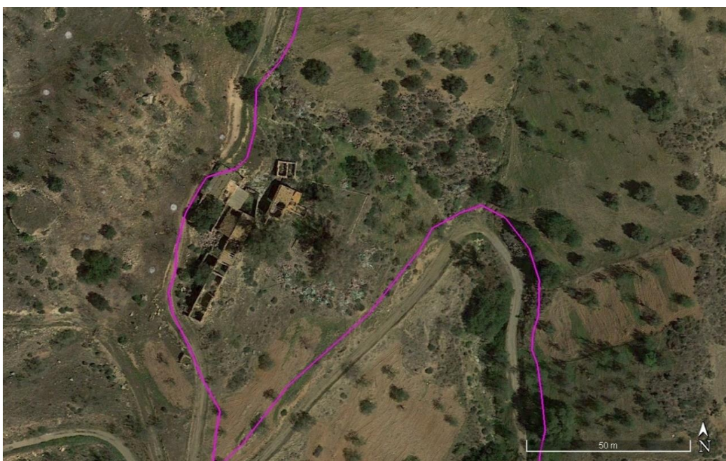
Localización del Elemento Etnográfico E.E 02

Se trata de una construcción de uso agrícola ganadero, ubicada junto a un camino rural. La edificación se extiende a lo largo del camino, presentando estancias cuadrangulares que podrían estar destinadas a corrales o a almacenaje. Se localizan varias construcciones, algunas con cubiertas a dos aguas de vigas de madera y tejas curvas, hoy en día vencidas y otras, con tejados de uralita, en mejor estado de conservación. La fábrica de los muros es de piedra seca, trabando los mampuestos más grandes con otros de menor tamaño. Presenta revoco de mortero de cal.