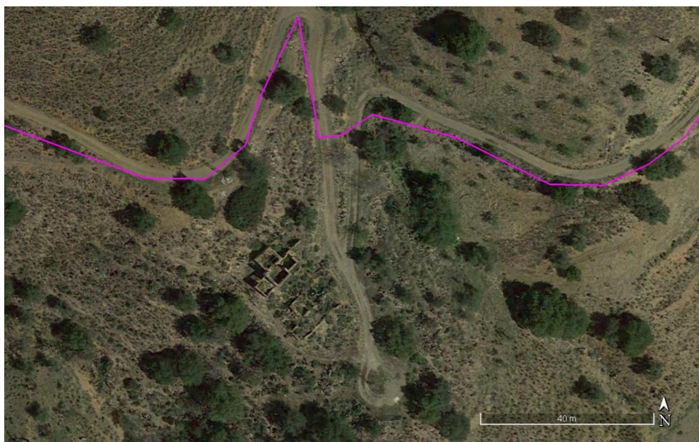
Localización del Elemento Etnográfico E.E 05

Se trata de una pequeña construcción de uso agrícola ganadero, ubicada en una ladera junto a un camino rural. Se conservan restos de una construcción de planta rectangular, de pequeño tamaño y con muretes de corrales adosados. La fábrica de los muros es de piedra seca, con revoco de mortero de cal. La cubierta no se conserva.