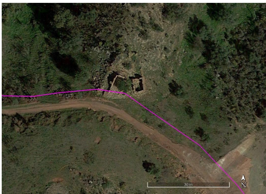
Localización del Elemento Etnográfico E.E 04

Se trata de una pequeña construcción de uso agrícola ganadero, ubicada en una ladera junto a un camino rural. Consta de dos pequeñas construcciones de planta rectangular, de las que apenas se conserva el arranque de los muros. La fábrica de los muros es de piedra seca, trabando los mampuestos más grandes con otros de menor tamaño. La cubierta no se conserva.