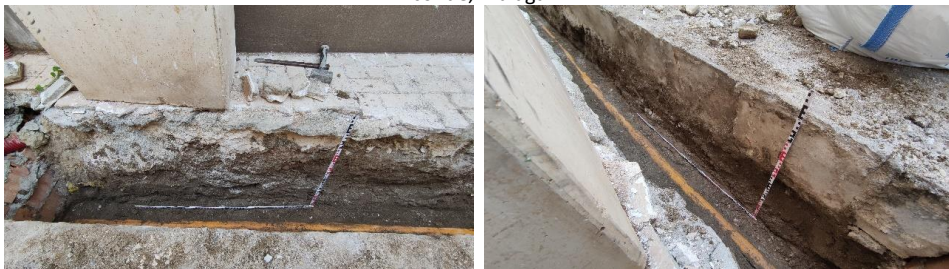
Perfil norte (izq.) y perfil sur (dcha.) del final de la zanja para la nueva instalación eléctrica entre los números 19 y 17 de calle Huerto del conde, Málaga