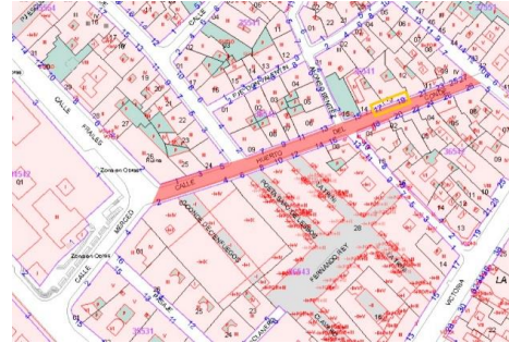
Ubicación en el mapa provincial (izq.) y localización de la calle Huerto del conde y la zona de intervención en plano catastral (dcha.)