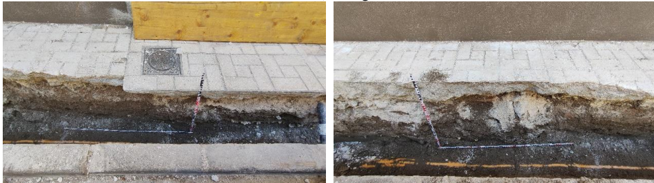
Perfil norte de la zanja para la nueva instalación eléctrica entre los números 19 y 17 de calle Huerto del conde, Málaga