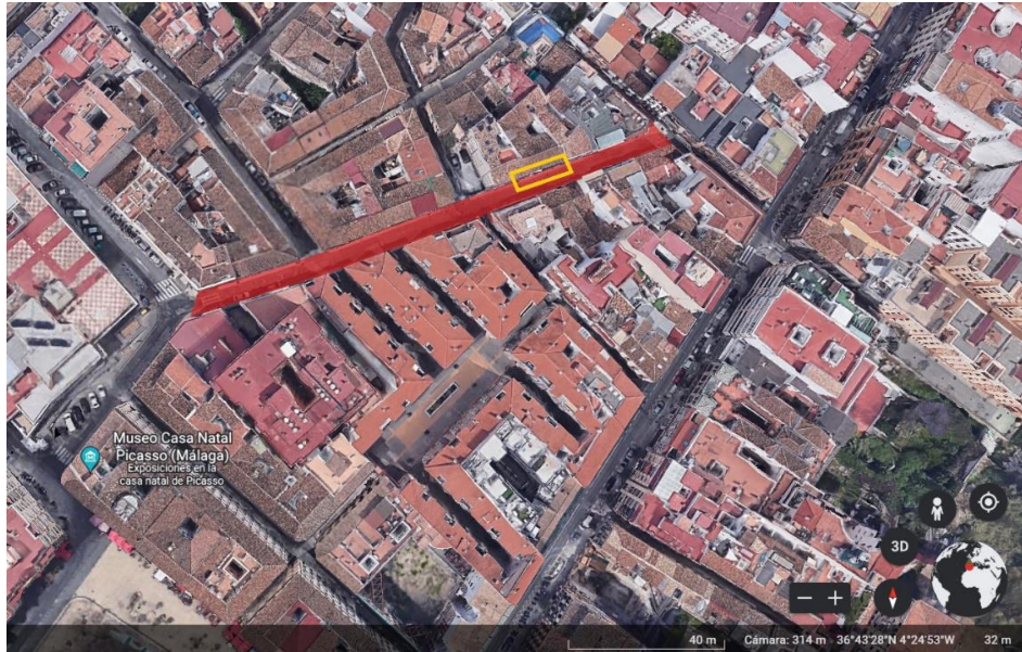
Ubicación en la calle Huerto del conde del área de intervención (captura GoogleEarth, 2022)