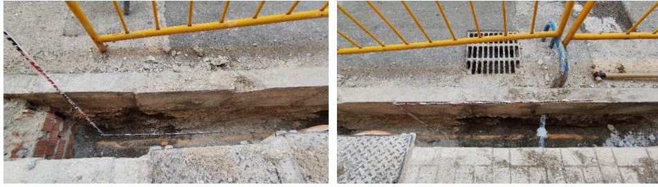
Perfil sur de la zanja para la nueva instalación eléctrica entre los números 19 y 17 de calle Huerto del conde, Málaga