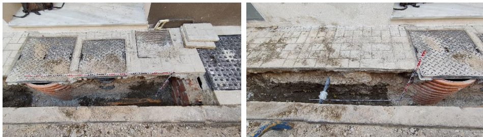
Perfil norte de la zanja para la nueva instalación eléctrica entre los números 19 y 17 de calle Huerto del conde, Málaga

La excavación de la nueva zanja se ejecuta en su totalidad sobre el relleno de la instalación de gas preexistente, de la que hemos podido visualizar su canalización (UE 10), a muro de la secuencia estratigráfica, a lo largo de todo el recorrido de la zanja. Su relleno, conformado por arena de playa (UE 11), se ha visto alterado en diversas ocasiones por la ejecución de las instalaciones de abastecimiento de agua (UE's 07, 08 y 09), saneamiento y pluviales (UE's 04, 05 y 06) de la vivienda alojada en el número 19 de la calle. En algunos puntos finales de la zanja, es decir, en el extremo Oeste de la misma, hemos podido identificar la interfaz de la zanja para la instalación de gas (UE 12), cortando el relleno de la zanja de cimentación de la misma vivienda, compuesto por un paquete de arenas marrones abigarradas con inclusión de algunos fragmentos de ladrillo (UE 13). A techo de la secuencia se localizan las baldosas de la acera con cama de arena y capa de hormigón de limpieza (UE 02), junto con el bordillo de la propia acera y el hormigón necesario para su colocación (UE 03).