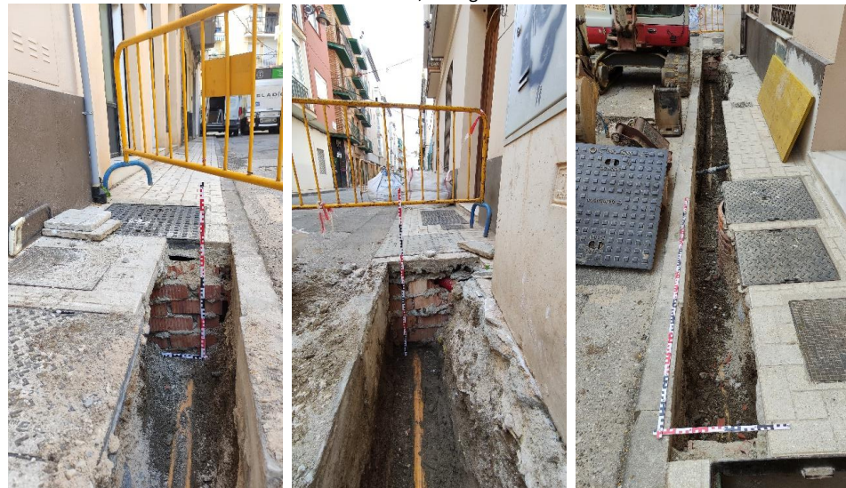
Arqueta inicial (izq.) y arqueta final (centro) de la zanja para la nueva instalación eléctrica. Zanja finalizada (dcha.) entre los números 19 y 17 de calle Huerto del conde, Málaga