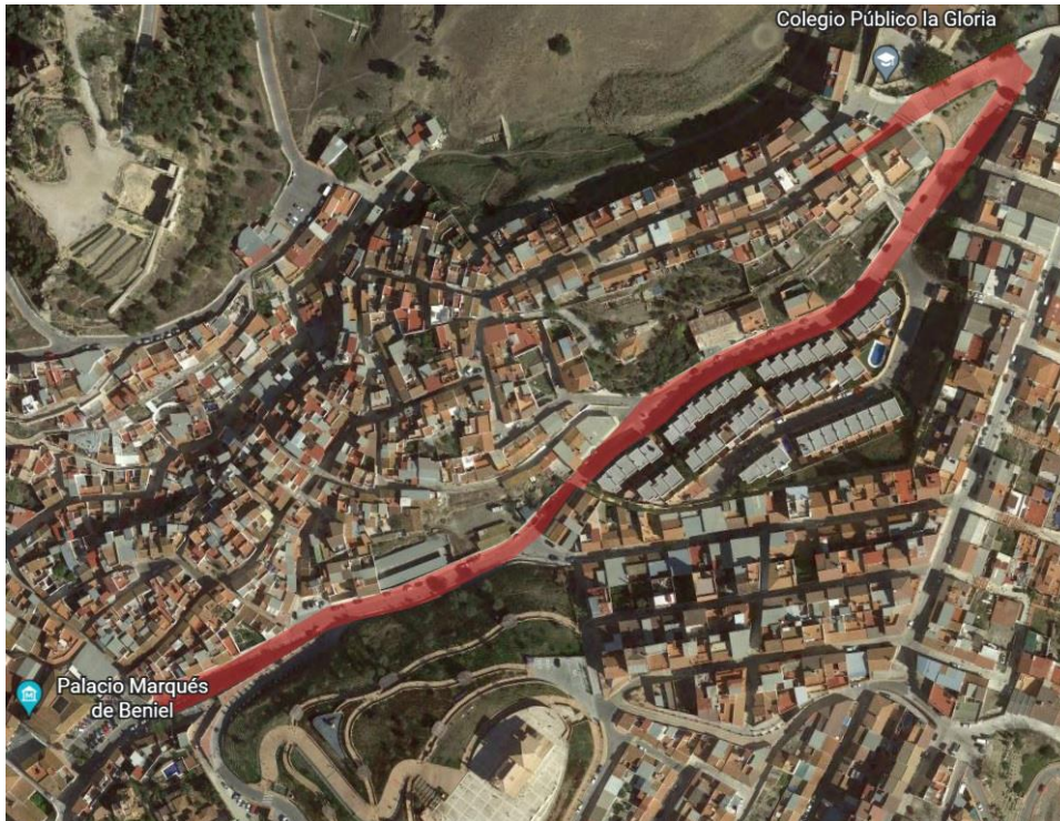
Ubicación del área de intervención del Tramo 01 de la instalación, Vélez Málaga