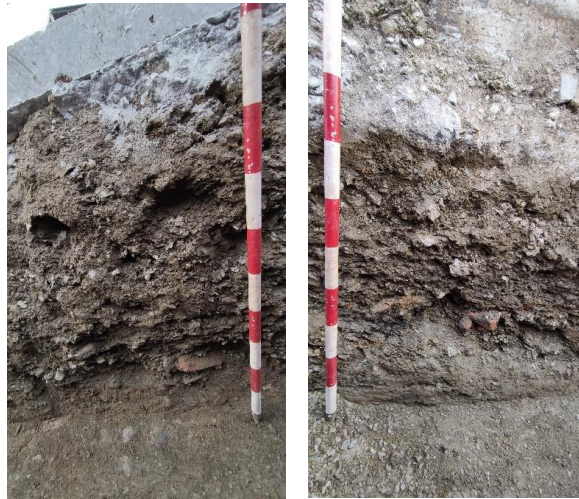
Perfil Norte (izq.) y perfil Sur (dcha.), en detalle, calle Arroyo La Molineta, Vélez Málaga

A techo, el nivel parece estar delimitado por fragmentos de ladrillos y algunas piedras de mediano tamaño que, a su vez, parecen haber sido alterados por el paquete superior de rellenos. Al Oeste, se apoya en el terreno natural y, al Este, desaparece bruscamente, posiblemente debido a los movimientos de tierra que se realizaron para la ejecución de un registro de pluviales en las inmediaciones de su localización y/o a la construcción del propio muro de contención de calle Cristo del Cerro.