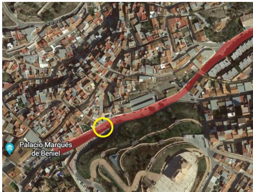
Ubicación en plano (círculo amarillo) con la zona donde se localiza el posible nivel arqueológico, calle Arroyo La Molineta, Vélez Málaga. Captura GoogleEarth, 2023.

A 6,20 m de la esquina del muro de contención de calle Cristo del Cerro en dirección Oeste y a 1,80 m del mismo, en sentido Norte, se documenta a muro de la secuencia estratigráfica un nivel o con una potencia entre 15-20 cm, visible en ambos perfiles y presente a cota de suelo de la zanja. Se extiende a lo largo de 2,50 m de longitud, aproximadamente.