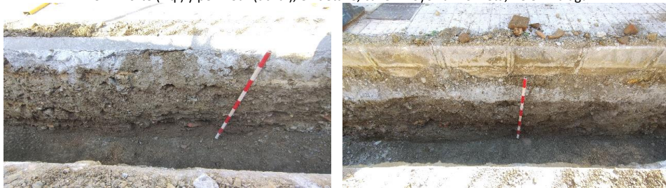
Perfil Norte (izq.) y perfil Sur (dcha.), calle Arroyo La Molineta, Vélez Málaga