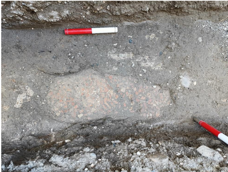
Fig. 5. Detalle del sector documentado del pavimento musivo de opus signinum .