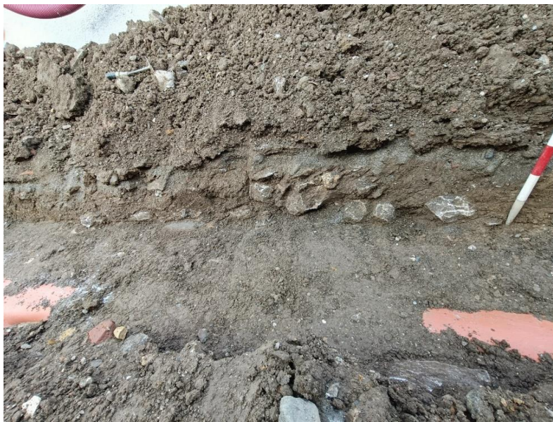
Fig. 3. Limpieza de un lateral de la zanja de fecales en el tercio norte de la calle, donde se aprecia la estratigrafía arqueológica a 0,40 m desde la rasante de la calle.

Para minimizar los movimientos de tierra se decide abrir una única zanja junto a la anterior de fecales, para introducir la red de pluviales y la de los demás servicios que se acometen sobre esta.