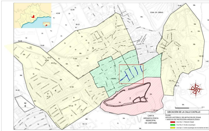
Fig. 1. Ubicación de las calles objeto de estudio en el entorno del Centro Histórico y protecciones arqueológicas de la Carta Arqueológica Municipal de Cártama.