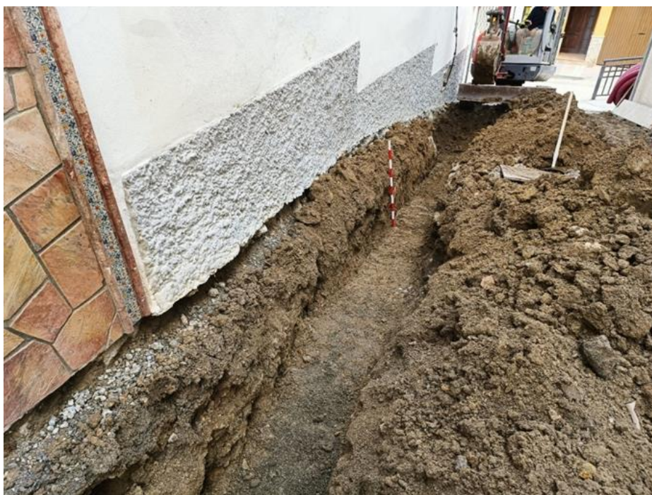
Fig. 4. Tercio norte de la calle. Detalle de los niveles de color marrón claro donde se detiene la profundización de las zanjas laterales para introducción de servicios.

Tras ello se abre una zanja lateral por el oeste de la anterior para la introducción de los servicios, y otra por la margen este para la red de pluviales. En ambos casos la profundización de la zanja se detiene al alcanzar el techo de los niveles arqueológicos, identificados con el color marrón claro que, como vimos en la actividad anterior de sondeos, se corresponden las fases de la ciudad ibérica. La profundidad varía entre 0,40 y 0,60 m.