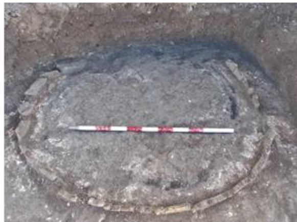
Lám. 10. C.E. 10

aledañas. Así como una gran cantidad de tejas de gran tamaño, paredes aplanadas y señales de exposición al fuego.