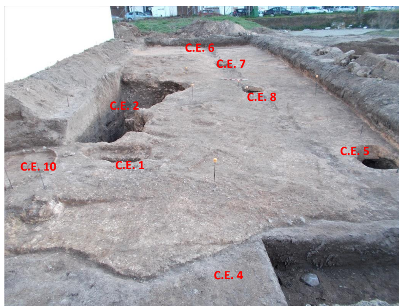
Lám. 12. Vista general de la parcela desde el sur.

Una vez documentadas todas las estructuras, se procedió a su cubrición con tela geotextil.