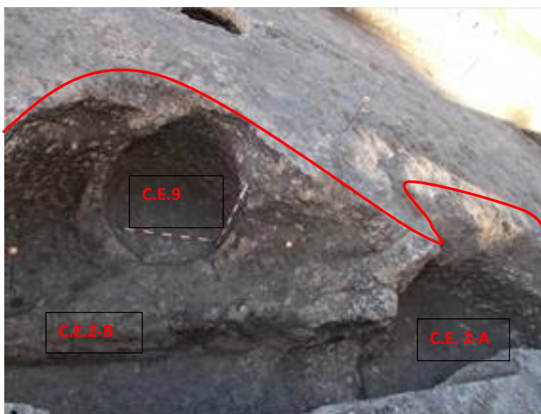
Lám. 9. Vista general del C.E. 2 y del C.E. 9

Es la continuación de la U.E.C. 7 del C.E. 2-A, de modo que se trata de la misma unidad construida. En su totalidad tiene forma geminada y sección acampanada, ya que va abriendo conforme vamos bajando de nivel. Aunque de forma irregular, ya que aprovecha el silo anterior (C.E. 9) y corta la base en forma de zanja en el espacio B. Ambos espacios se comunican a través de un escalón.