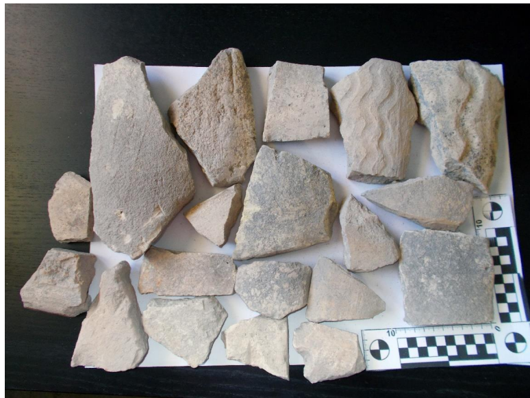
Lám. 5. Muestras de teja hallados en este nivel donde observamos las bandas onduladas que recorren la teja longitudinalmente.

Algunos fragmentos de teja presentan motivos decorativos consistentes en bandas incisas longitudinales, formando ondas, hechas con los dedos cuando la pasta aún estaba húmeda.