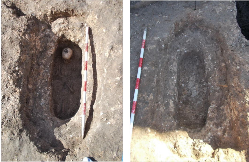
Láms. 2 y 3. C.E. 1. U.E.C.3. Prefosa y fosa de inhumación con el cuerpo decúbite supino orientado hacia el SE. Tumba excavada (en la segunda imagen, la fotografía está tomada desde el lado este).