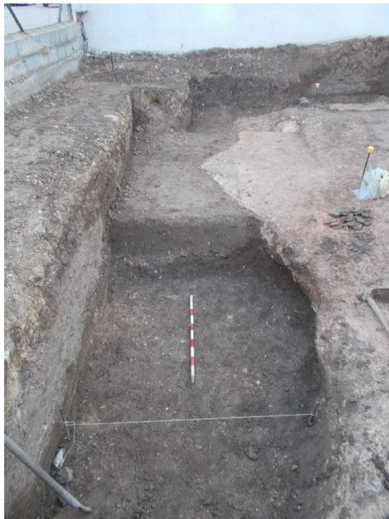
Lám. 11. C.E. 4

Estructura excavada en el sustrato geológico, tiene forma geminada y una orientación E-W. Se encuentra a la entrada del solar, paralela a la línea de fachada, con una