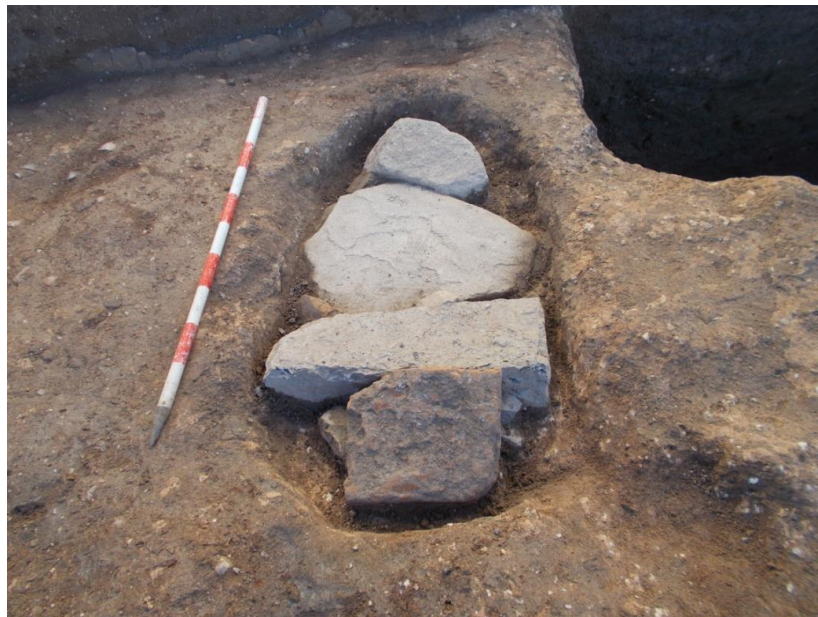
Lám. 1. C.E. 1

● U.E. 2: Es un nivel de colmatación que rellena el complejo estructural. Está formado por un estrato de tierra de color marrón oscuro. No contiene cerámica y cubre los restos óseos del individuo enterrado en el interior.