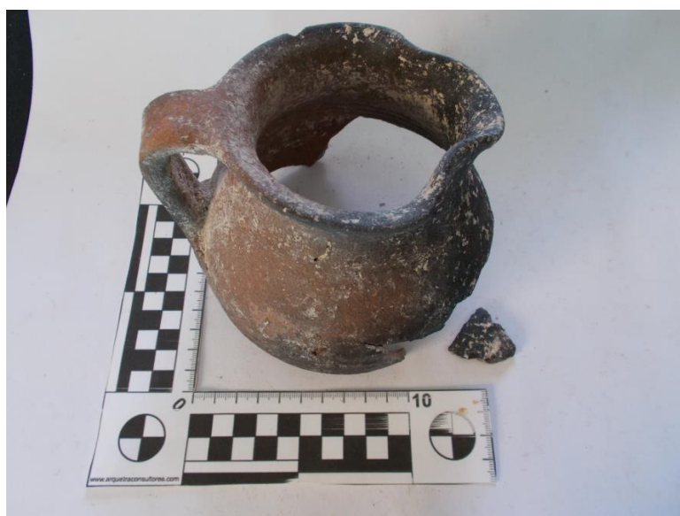
Lám. 6. Jarra encontrada en esta unidad.

Destaca la presencia de una jarra de cocción reductora y pasta gris que se conserva casi completa.