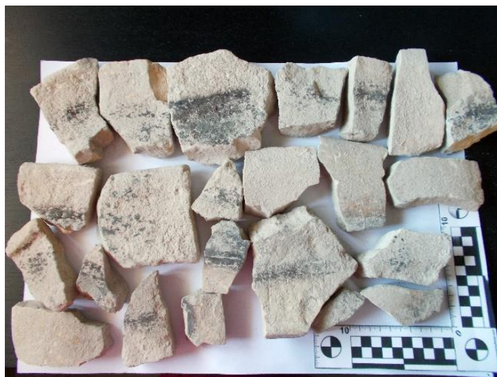
Lám. 4. Muestras de material de construcción

También hay abundancia de teja de paredes gruesas con señales de exposición al fuego, así como restos de fauna con predominio de huesos largos con marcas de corte, y algunos aparecen quemados, también hallamos un trozo de cuerno, seguramente de vacuno y presencia de malacofauna.