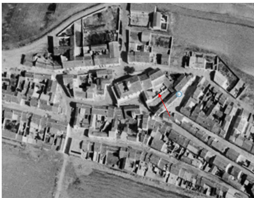
Fotografía aérea de 1973-86. Se señala con flecha la estructura

Una de ellas se corresponde claramente al pavimento empedrado existente en el patio abierto y la otra por ubicación y orientación se correspondería con un límite de patio anterior. El área que actualmente vemos sería el resultado de la unificación en una misma propiedad de varias parcelas y por tanto conllevó la eliminación del muro divisorio del que hemos detectado su base. Tanto en las fichas del catastro (donde se refleja la división de parcelas) como en las fotografías aéreas históricas es posible distinguir esa estructura.