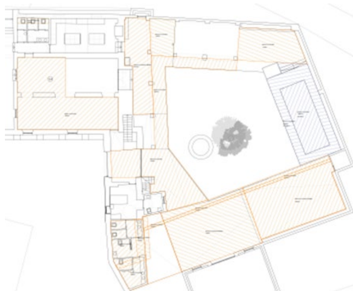
En rojo, áreas de movimiento de tierras previstas

Estos movimientos de tierras se realizarían en principio en las zonas exteriores perimetrales al patio/jardín (porches y cuerpos anejos de reciente construcción), así como en las dos salas principales a las que se accede por ese lado, el zagúan de entrada, y los nuevos aseos exteriores. En su práctica totalidad son excavaciones de poca envergadura, entre 15 y 50cm, con el objetivo de renovar los pavimentos interiores, nivelar y mejorar el terreno en los nuevos aseos (sobre el que se ejecutará la losa de cimentación) y nivelar y acondicionar las zonas exteriores, en las que se dispondrá de un pavimento de barro sobre solera de hormigón, posibilitando así la circulación alrededor del jardín. Se incluye también una zanja para saneamiento en el lateral sur del patio/jardín.