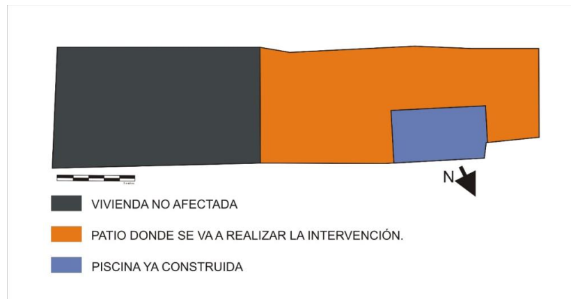
Fig. 3. Planteamiento de la excavación.

El patio presenta en torno a 85,00 m 2 de los que han sido afectados 12'5 m 2 (color azul) por tanto se plantea la excavación de 62,75 m 2 restantes (en color naranja), con las respectivas cautelas de seguridad, se respeta una zona de reserva apegada a las medianeras de la vivienda presentándose un sondeo de 12,35 x 5,10 metros.