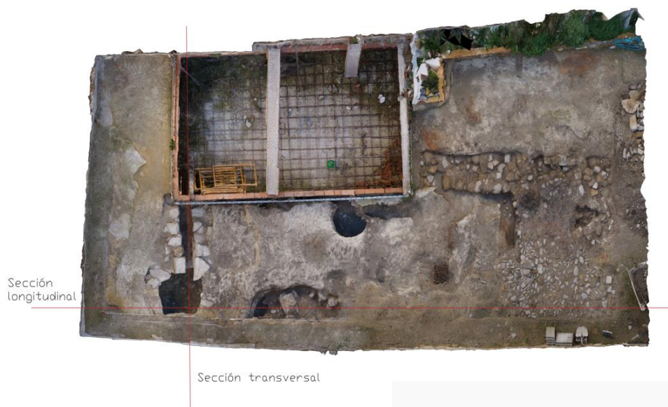
Fig. 5. Planta de la excavación.