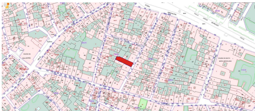
Fig. 1. Situación de la vivienda en el parcelario de Baeza.

La planta del solar es rectangular irregular y ocupa una superficie de 225,00 m 2 según mediciones del catastro. Según la ficha de esta construcción en el catastro está catalogado como parcela edificada sin división horizontal, con un año de construcción de 1900.