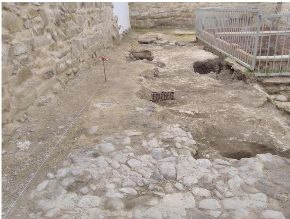
Fig. 4. Empedrado de la vivienda y estructuras asociadas al patio de la vivienda.

UE1010 presenta una cota de -0,22 metros con respecto al punto 00 de la excavación. Ocupa el vértice sur-este de la excavación y alcanza un ancho de 2,87 metros en su parte más ancha, llegando a fusionarse con la base geológica a la que va nivelando para alcanzar una superficie de suelo más equilibrada.