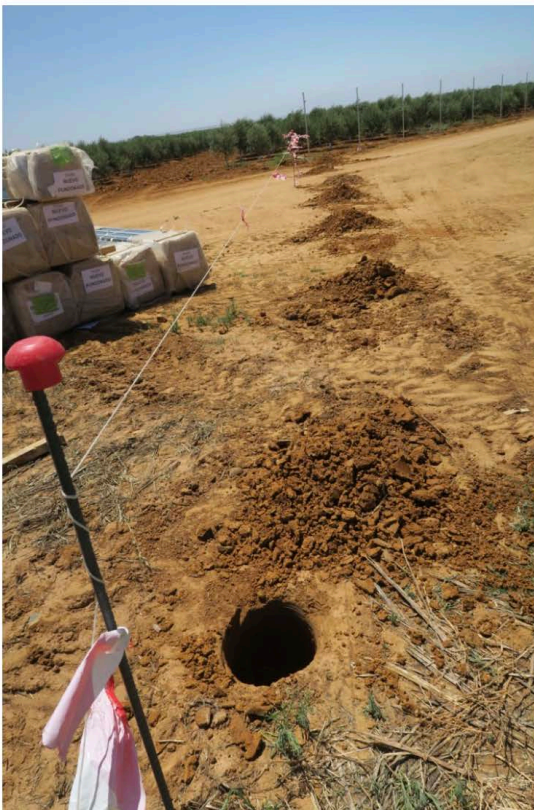
Láms. I a III. Vallado perimetral.