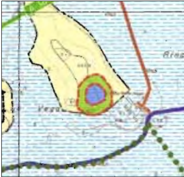
Figura 1. Yacimiento arqueológico próximo al Cortijo de las Vegas.