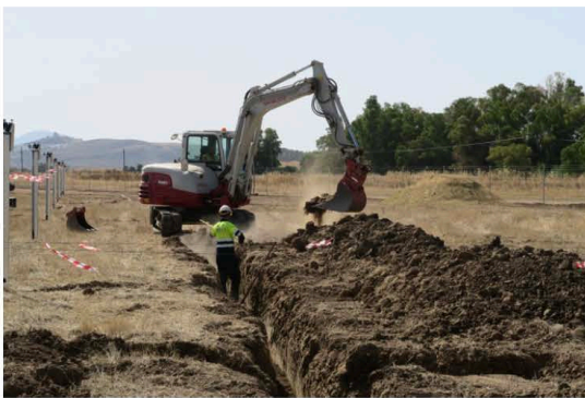
Láms. XVII a XXIII. Canalizaciones