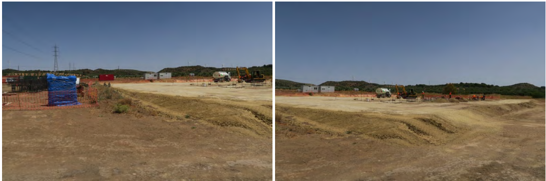
Láms. XXVI y XXVII. Aportes de tierra a la SET.

No observamos que existan afecciones que deterioren yacimientos arqueológicos ya reconocidos o restos de carácter etnográfico, ya que éstos se hallan muy alejados de las obras, y tampoco se han localizado otros nuevos.