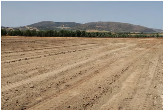
Láms. XXIII a XXV. Explanación del área de la SET.