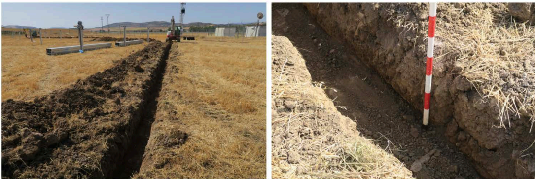
Láms. XV y XVI. Canalizaciones.