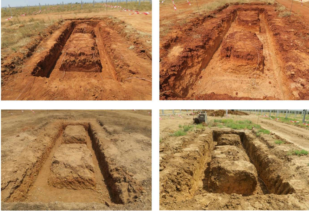
Láms. XI a XIV. Algunos ejemplos de excavación de cimentación de centros de transformación.