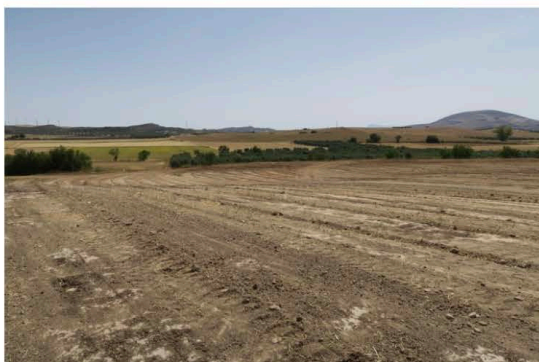
Láms. IV a VIII. Debroce y niveleación del terreno.