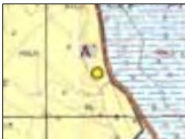
Figura 3. Resto arqueológico aislado.