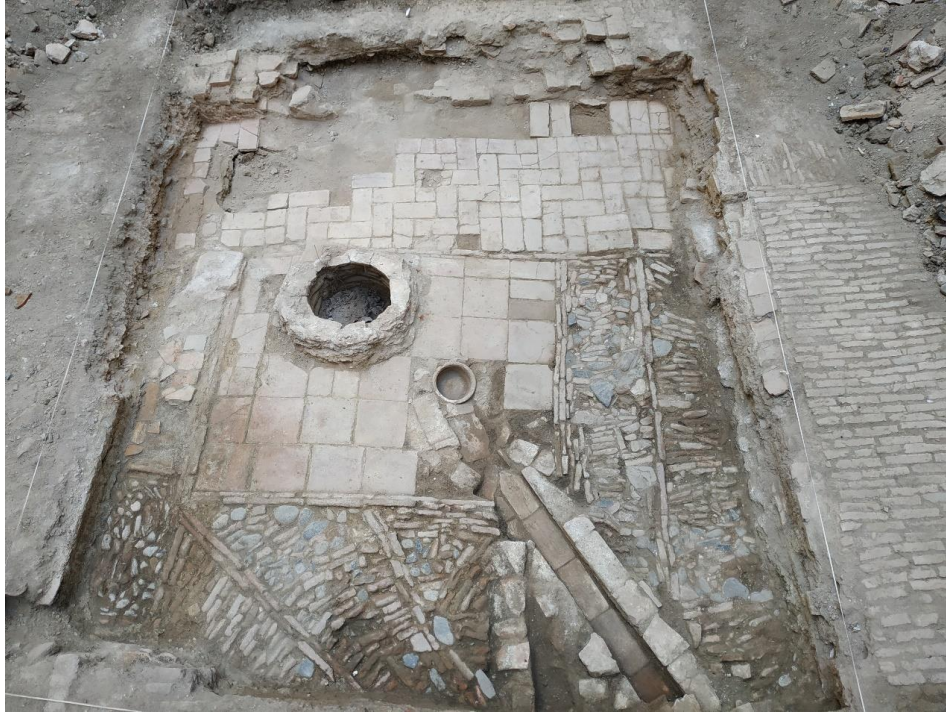
Segunda fase documentada: edad contemporánea

la superficie del sondeo, 5 x 4, como se muestra a continuación. De esta época también es el pozo que apareció en la primera fase, UE 1002, el cual fue excavado hasta la localización del nivel freático. Por el tipo de suelo, unos de ladrillo, otros de baldosas y otros de canto piedras, todos ellos contruidos en torno a un pozo, unido a la presencia de una canalización de ladrillo, este espacio pudo tener una funcionalidad de patio interior de una o varias viviendas, muy típico en esta época en la comunidad andaluza.