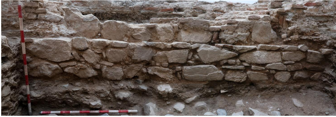
Tercera fase documentada: época moderna

Debido a estas estructuras murarias y a la aparición de un segundo pozo, al que se le adosan varios niveles de suelos de ladrillo y canalizaciones, el uso del espacio que ocupa el sondeo podría seguir siendo de viviendas con un patio a modo de espacio abierto, ya que el agua tanto del primer pozo contemporáneo como de este segundo podría proceder del río Guadalmedina que transcurre cerca de este lugar y, por tanto, proporcionaría agua dulce para el uso doméstico.