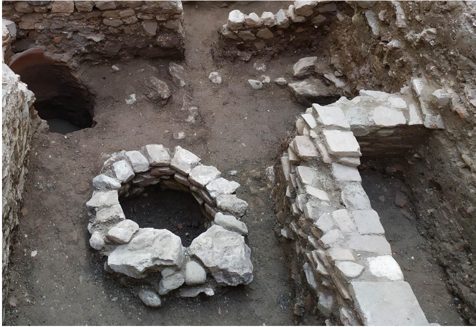
Cuarta fase documentada: época musulmana

Una última estructura (UE 1079) de esta época es de piedras de diferentes tamaños e indeterminada, de la cual no se ha podido conocer su función debido a la aparición del nivel freático.