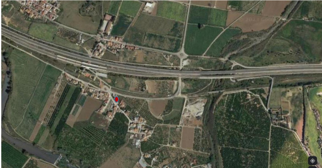
Ubicación de la parcela