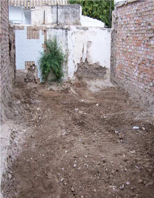
Lámina II. Vista general del solar tras la retirada de las unidades iniciales.

de los condicionantes técnicos que impusieron la evolución cotidiana del trabajo de campo, es decir: la garantía de las medidas oportunas de seguridad en el trabajo que sugirieron no agotar completamente las medianeras en los cuatro puntos cardinales de la excavación.