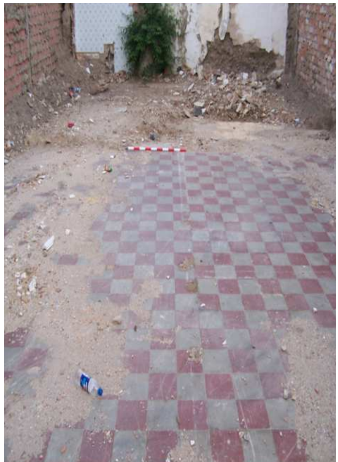
Lámina I. Vista general del solar y de las unidades estratigráficas iniciales (U.U.E. 0, 1 y 2)

Los trabajos de campo se iniciaron con la retirada por medios mecánicos de las primeras unidades contemporáneas (U.E 0 a U.E. 3) -Lám. 1 y 2-.