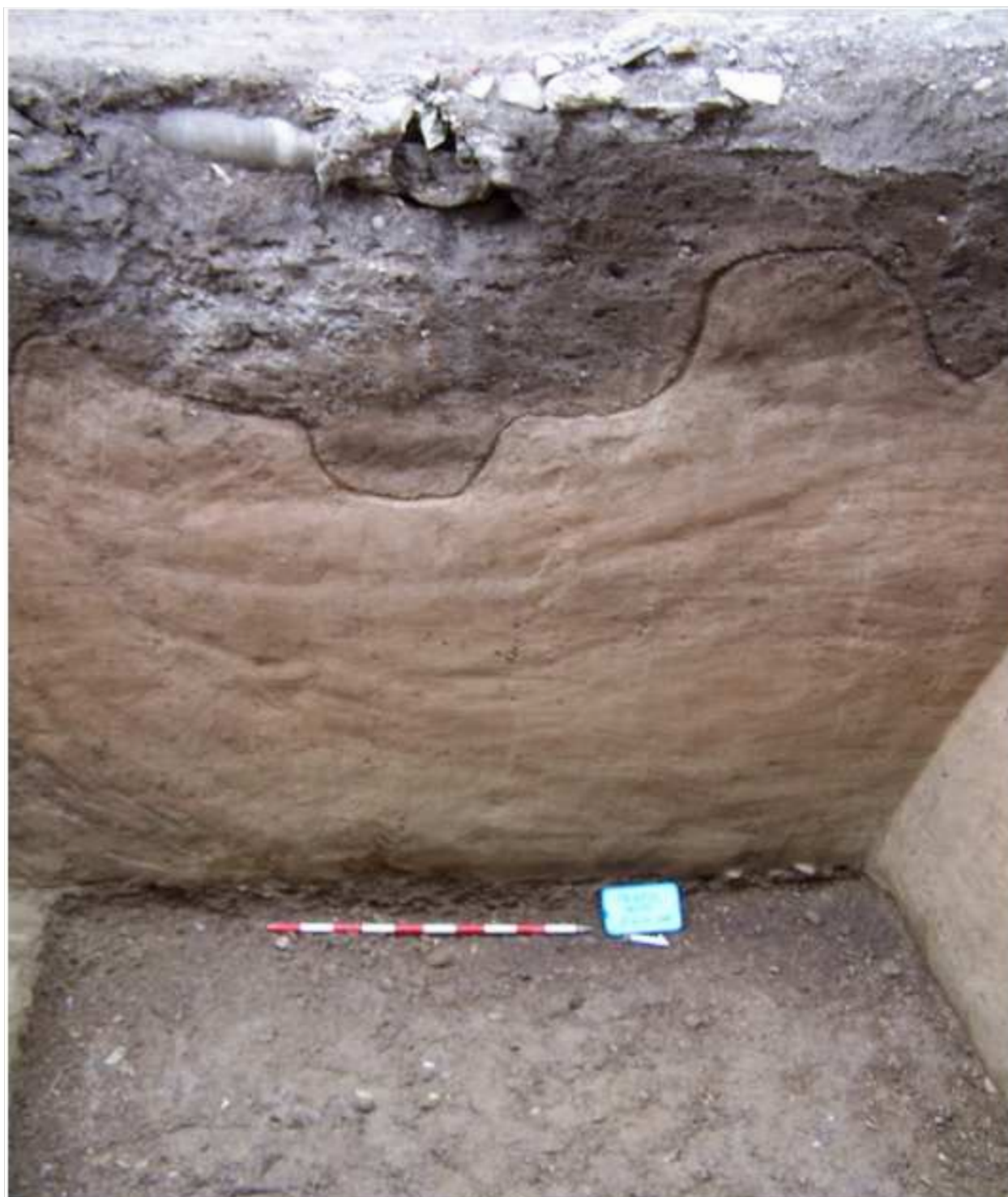
Lámina III. Vista de las unidades estratigráficas U.U.E. 9 y 10 (estratos geológicos) en el perfil Oeste.