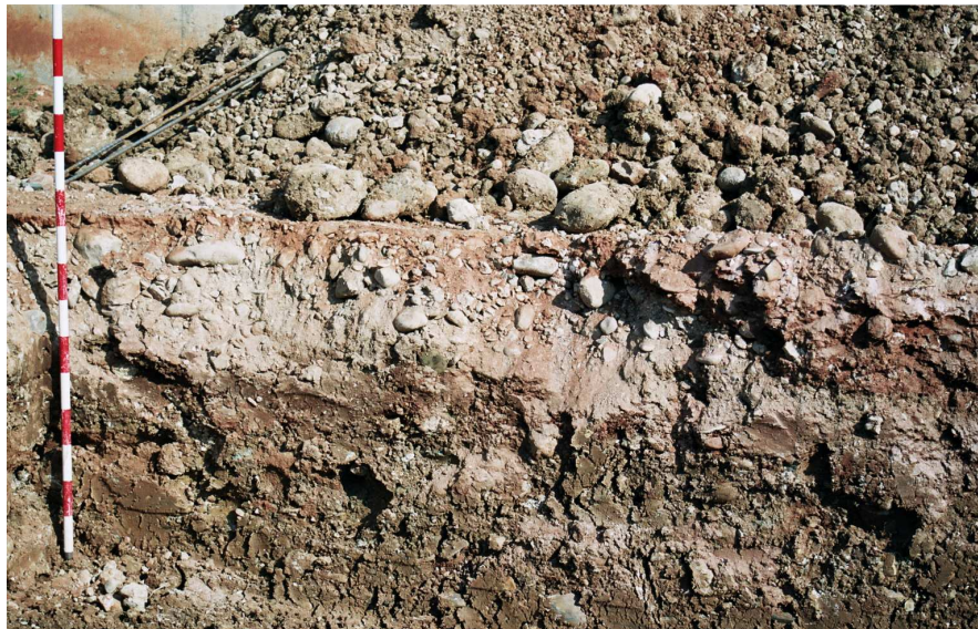
Lámina II: Detalle del perfil norte del sondeo 2