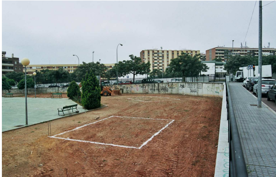
Lámina I: Vista general de la parcela.