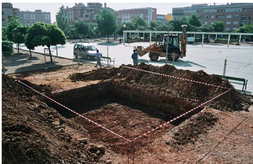
Lámina III: Vista general del sondeo 3.