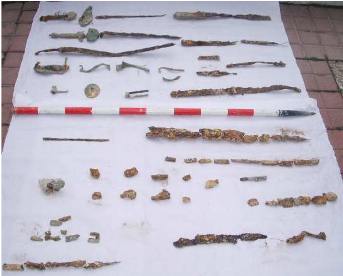
Lámina II: Algunos de los materiales de uso militar documentados.