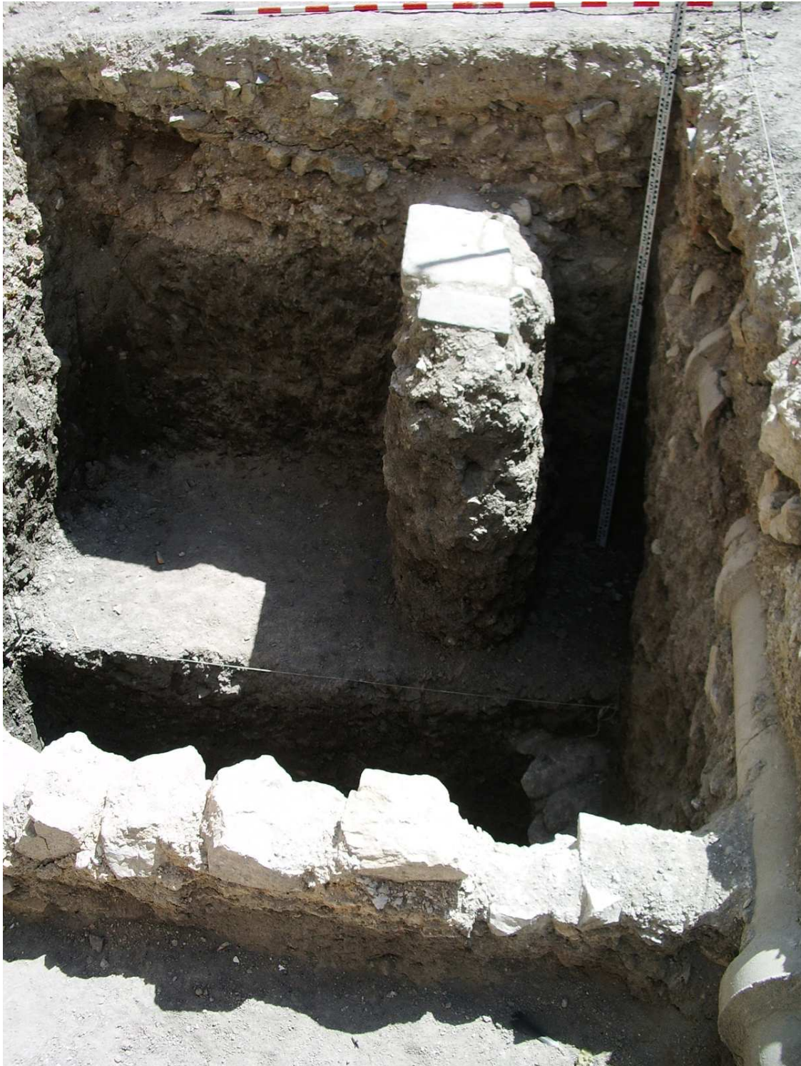
Lámina I: Aspecto General de la intervención a su finalización.