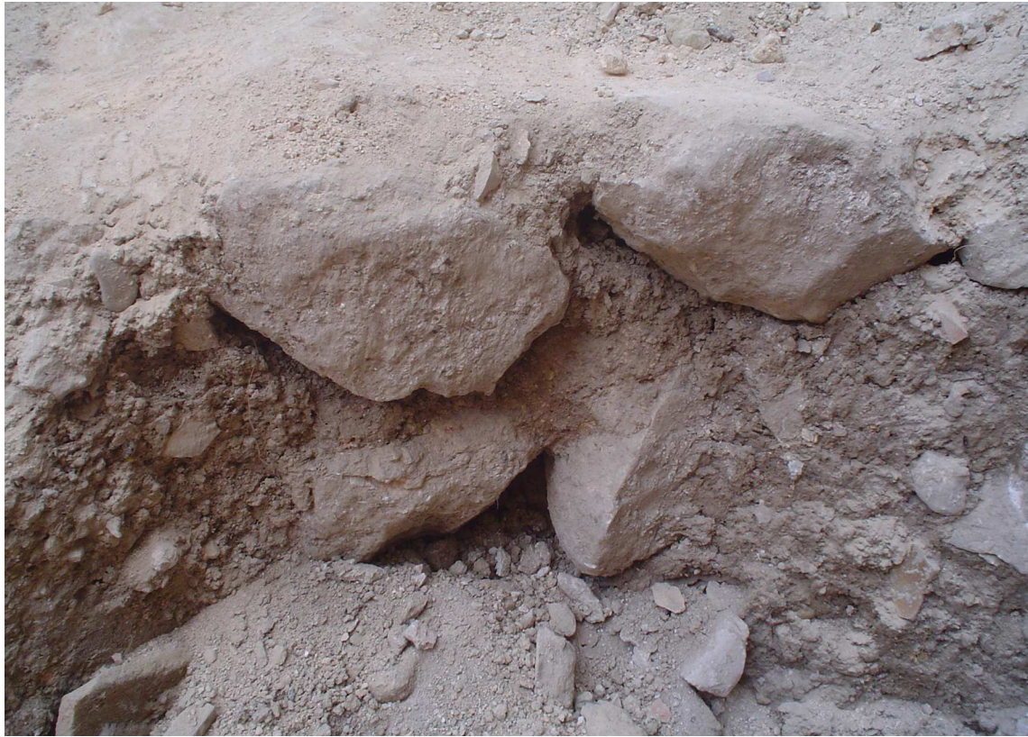
Lámina II.- Detalle del CE 1 (pozo ciego).