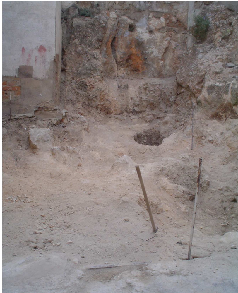
Lámina III.- Vista general del solar tras finalizar las labores de destierro.