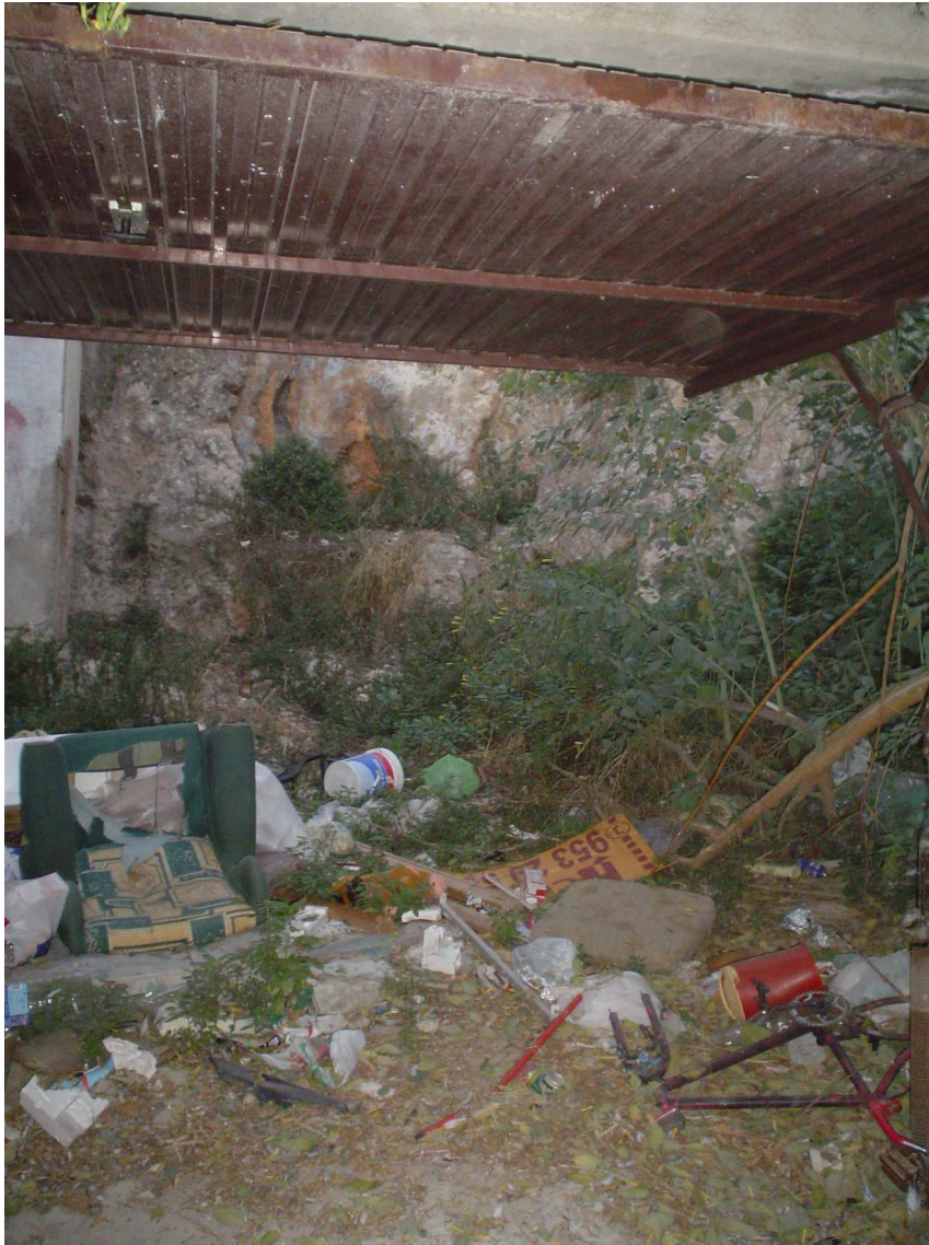
Lámina I.- Vista del estado previo de solar.